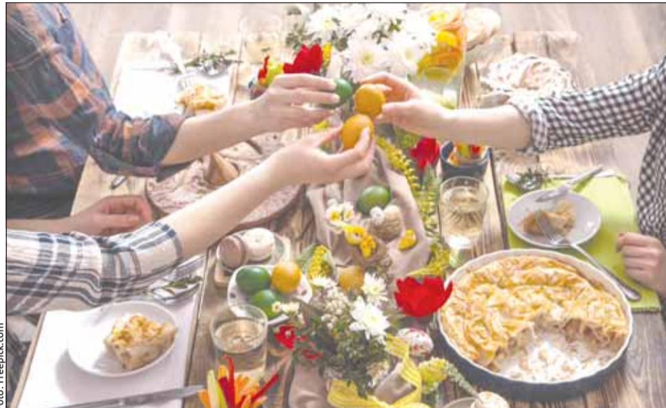
Au mai rămas patru zile până la Paște, iar pregătirile sunt în toi

Indiferent de produse, de ce produse vorbim atunci când vine vorba despre carne, nu doar aceste preparate au scumpiri comparativ cu anul trecut. Legumele, fructele înregistrează creșteri de preț semnificative față de Paștele trecut. De asemenea, dulciurile se cumpără mai