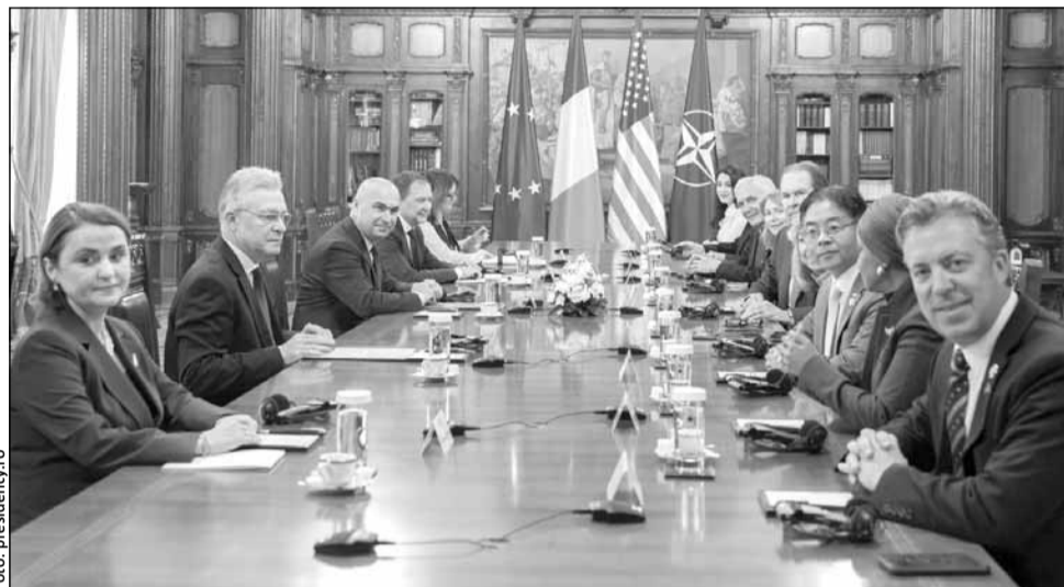
Americanii nu au comentat alegerile din România

Președintele a evidențiat importanța consolidării prezenței americane în România, în special în contextul actualilor provocări de securita-