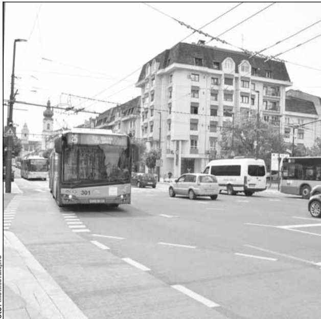
Linie dedicată transportului public pe axa Florești – IRA

Astfel, prin realizarea de noi benzi dedicate transportului public, precum și prin crearea unei stații suplimentare de tren metropolitan în zona Aeroportului, Clujul va dispune de facilități integrate de transport și o mobilitate crescută.