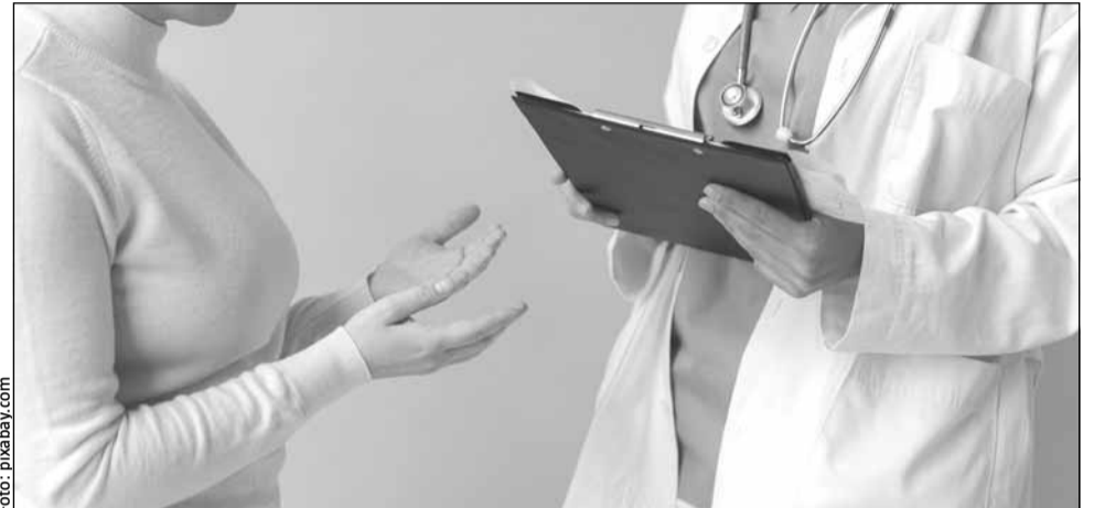
Pacienții vor putea face donații spitalelor, în loc să ofere atenții medicilor, prevede o lege adoptată de Parlament

Inițiatorii, mai mulți deputați USR, precizează că, de-a lungul anilor, această practică „a primit varii interpretări din partea diferitelor segmen-