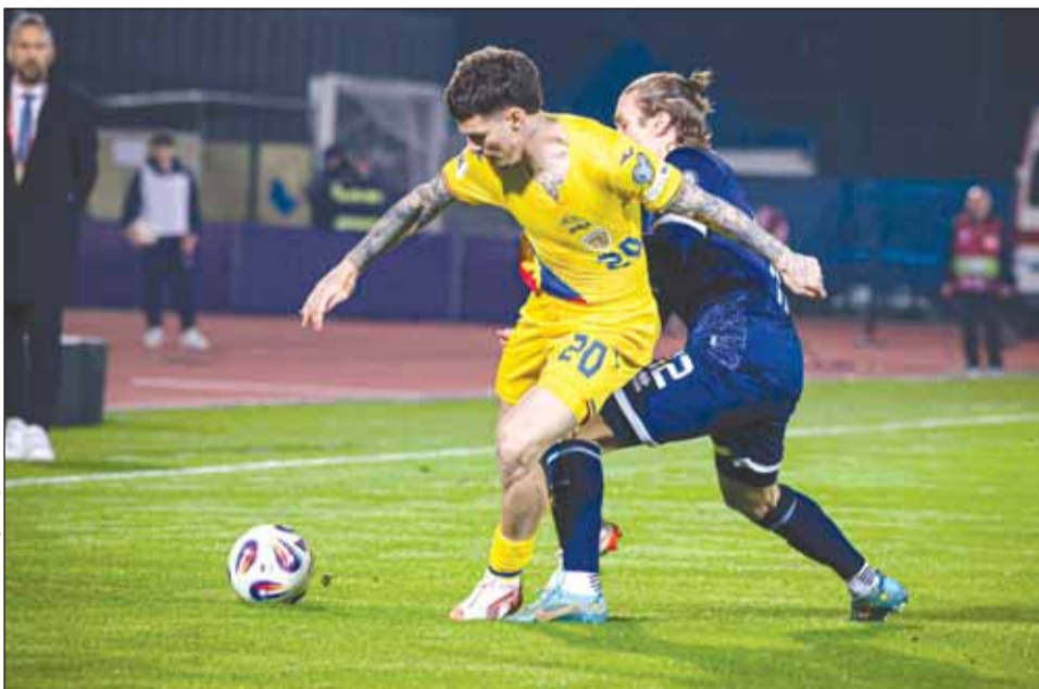
România coboară șapte poziții în clasamentul FIFA

Anul trecut, grație parcurșului foarte bun de la Campionatul European din Germania, unde naționala a ajuns până în optimi, și mai apoi a avut 6 victorii din 6 meciuri