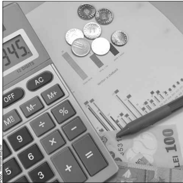
Deficitul bugetar a trecut de 30 de miliarde de lei

Totodată, evoluții pozitive au fost consemnate și în cazul încasărilor din impozitul pe salarii (18,2%) – peste dinamica fondului de salarii din economie (12,4%), evoluția acestei categorii de venituri fiind influențată de eliminarea facilităților fiscale acordate salariaților din