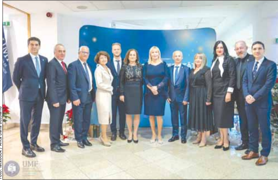
UMF Cluj are în derulare 101 proiecte cu o valoare de 56,8 milioane de euro

„Realizând acest raport, am analizat parcursul universității noastre în 2024, un an marcat de inițiative îndrăznețe, investiții strategice și rezultate remarcabile. Am continuat să ne consolidăm poziția ca instituție de referință în învățământul