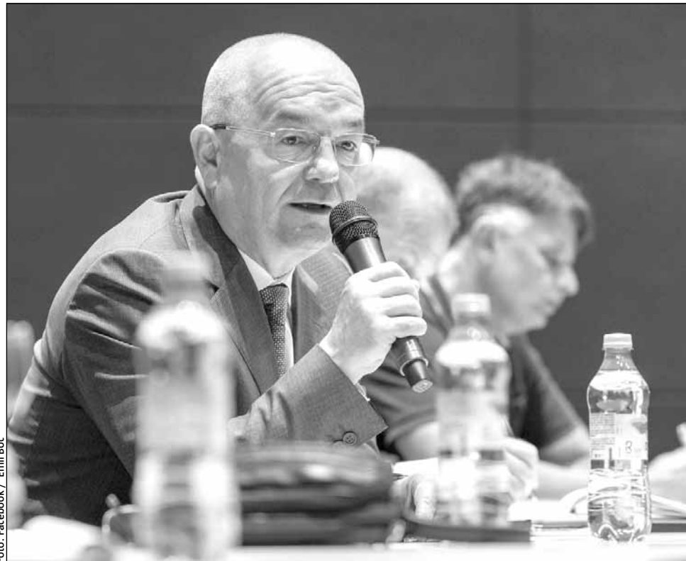
Emil Boc spune că reforma administrativă reprezintă o necesitate pentru a da o șansă dezvoltării României

„Cred că trebuie să cadă un Guvern ca această reformă să se facă. Nu va fi făcută ușor, din cauza problemelor structurale și a oamenilor