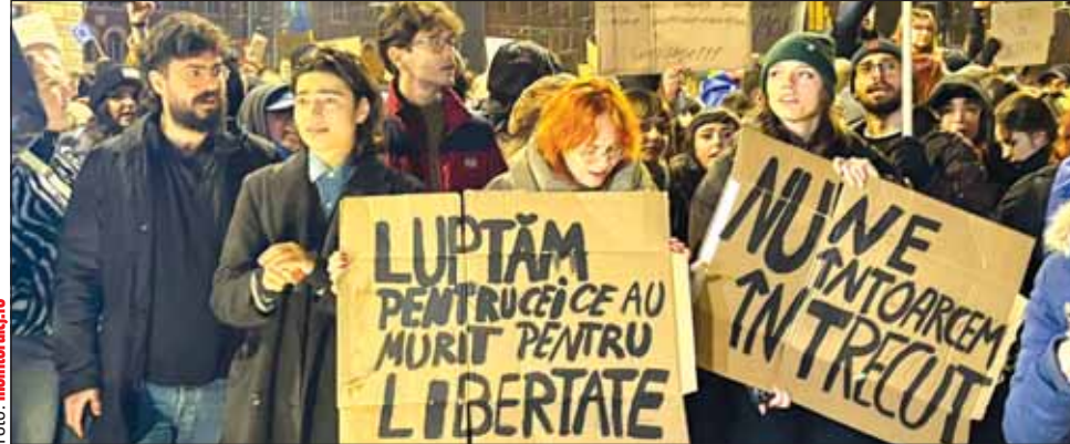
Studenții își doresc un lider deschis, pro-european, implicat în educație și conectat la nevoile societății

„Vrem un președinte care să înțeleagă că democrația și educația sunt fundamentale pentru un viitor de succes al unei țări”, transmite federația națională studențească, într-un comunicat. Tinerii subliniază că, prin campania „Noi știm ce vrem, dar cine își asumă?”, își doresc un președinte care să respecte democrația și apartenența României la UE și NATO, să promoveze educația ca instrument diplomatic, să colaboreze cu instituțiile naționale pentru dezvoltarea învățământului superior, să asigure transparență și