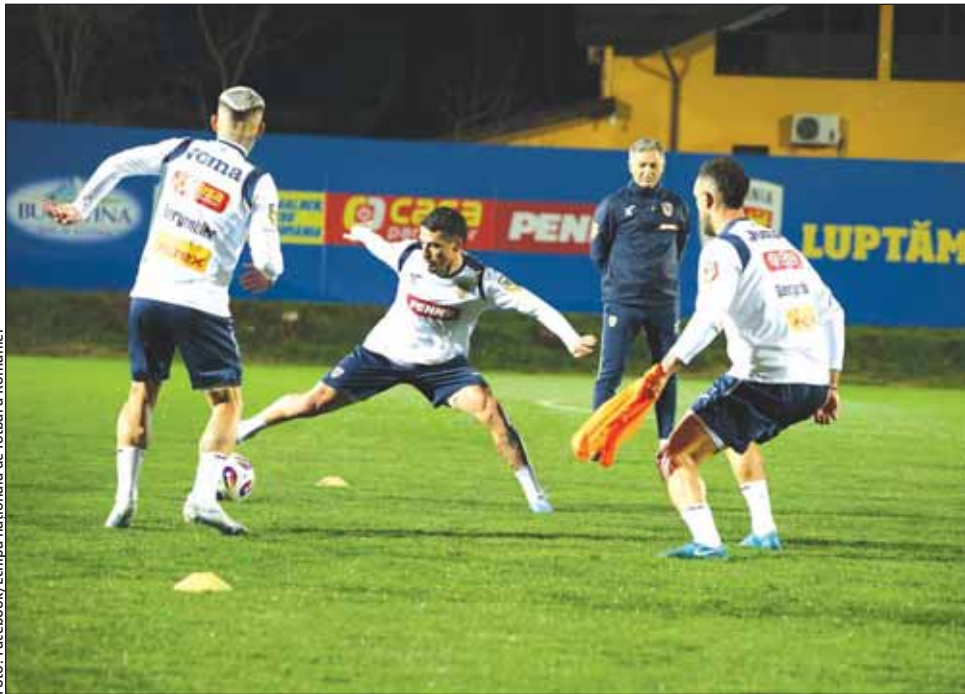
România este cotatează cu 32% șanse să termine grupa pe primul loc în preliminariile din Cupa Mondială

Internaționalul Alexandru Chipciu a declarat că selecți-