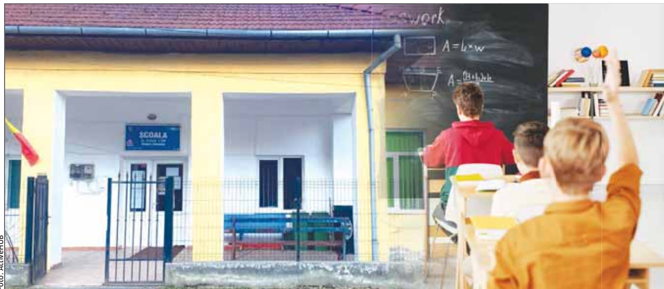
Prima ediție a concursului „Cunoașterea ne unește” se va desfășura în acest weekend la Școala Măguri-Răcătău

La această primă ediție sunt înscrise patru școli din comuna clujeană Măguri-Răcătău,