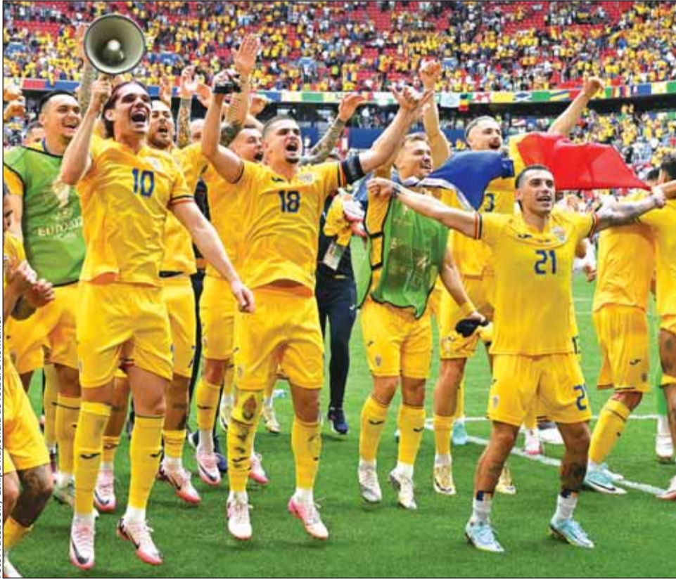
Naționala lui Mircea Lucescu a început pregătirile pentru primele două meciuri

Internaționalul Răzvan Marin a declarat că el și colegii săi