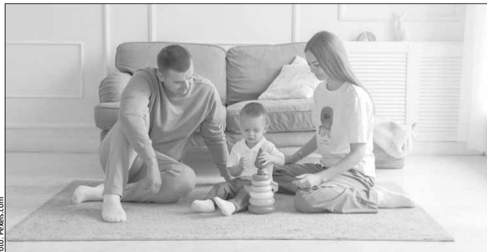
Costurile cu meditații, after school și materiale didactice au crescut de trei ori în ultimii 7 ani

Costul mediu total anual crește odată cu vârsta copilului, de la 6.803 lei în cazul ciclului primar, la 10.781 de lei la gimnaziu și 12.119 de lei la liceu.