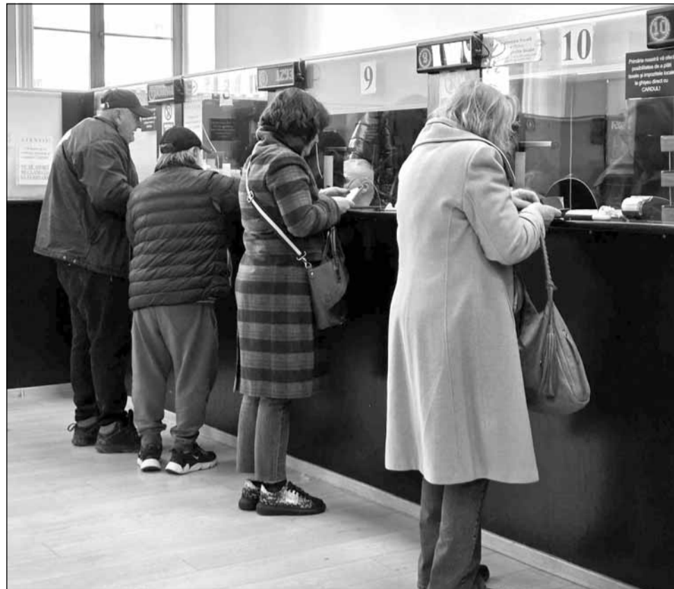
Clujenii scapă de drumurile între instituții pentru avize! Consiliul Județean accelerează digitalizarea și elimină hârtiile

„Lucrăm la Ghișeul Unic de mult timp. Deja puteți primi în timp util pe telefon anumite informații sau online, deja semnăm autorizații și