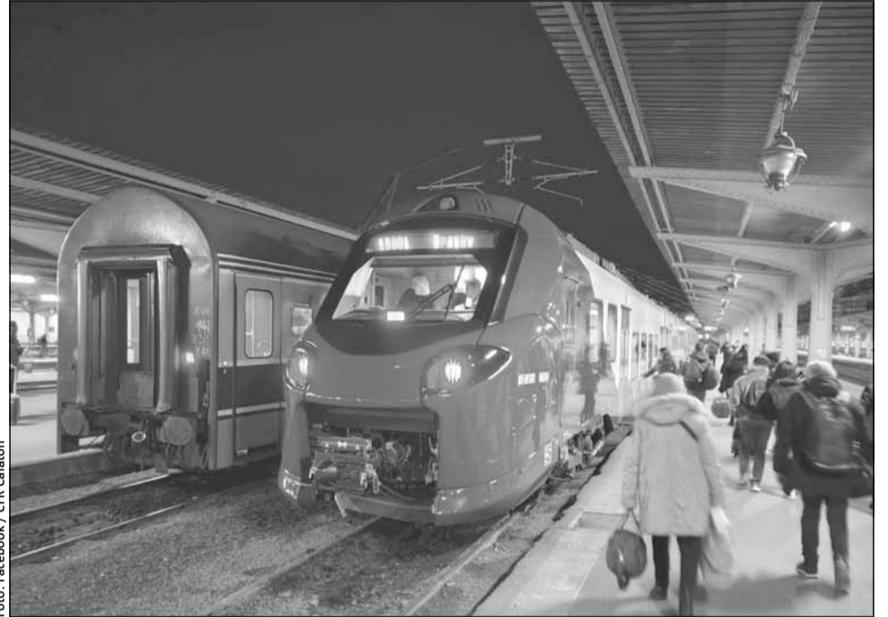
Mai puține trenuri, întârzieri mai mari, modernizări lente

„Toate cele 4 loturi Simeria-KM 614 se înscriu în intervalul noiembrie 2023-noiembrie 2024 în acest dezolant