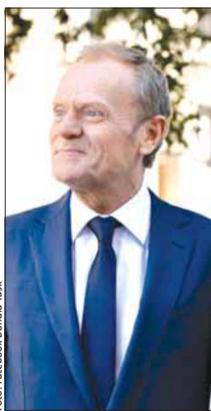
Donald Tusk

„Este inacceptabil că energia noastră este una dintre cele mai scumpe. Haideți să fim sinceri, unele dintre regulamentele europene din nefericire ne-au adus într-o situație