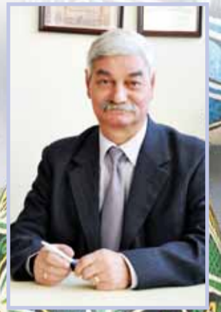
Primarul Municipiului Câmpia Turzii Ing. Ioan VASINCA

Sărbătoarea Învierii Domnului îmi oferă deosebitul prilej de a vă adresa, din toată inima, multă sănătate, putere de muncă. Să vă bucurați de aceste binemeritate zile de sărbătoare alături de cei dragi!