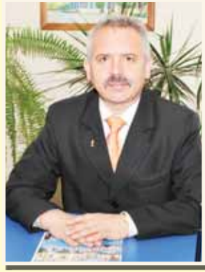
Ovidiu Drăgan Primarul Municipiului Gherla

Sărbătoarea Învierii Domnului îmi oferă deosebitul prilej de a vă adresa, din toată inima, multă sănătate, putere de muncă. Să vă bucurați de aceste binemeritate zile de sărbătoare alături de cei dragi!