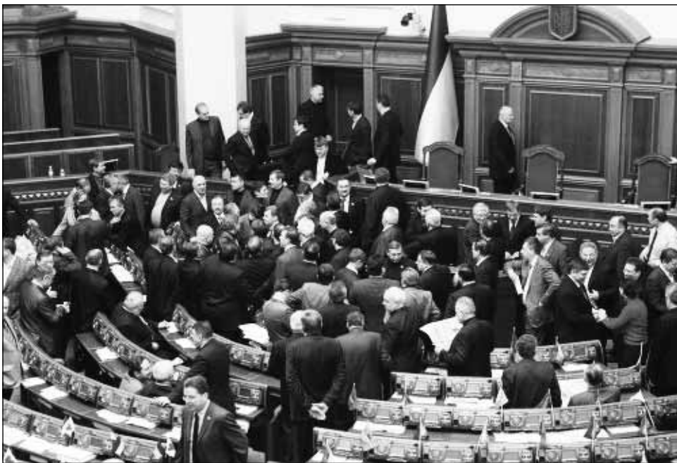
Din cei 450 de parlamentari ucraineni, 271 au votat în favoarea declarației

Declarația adoptată marți de parlamentul ucrainean (Rada