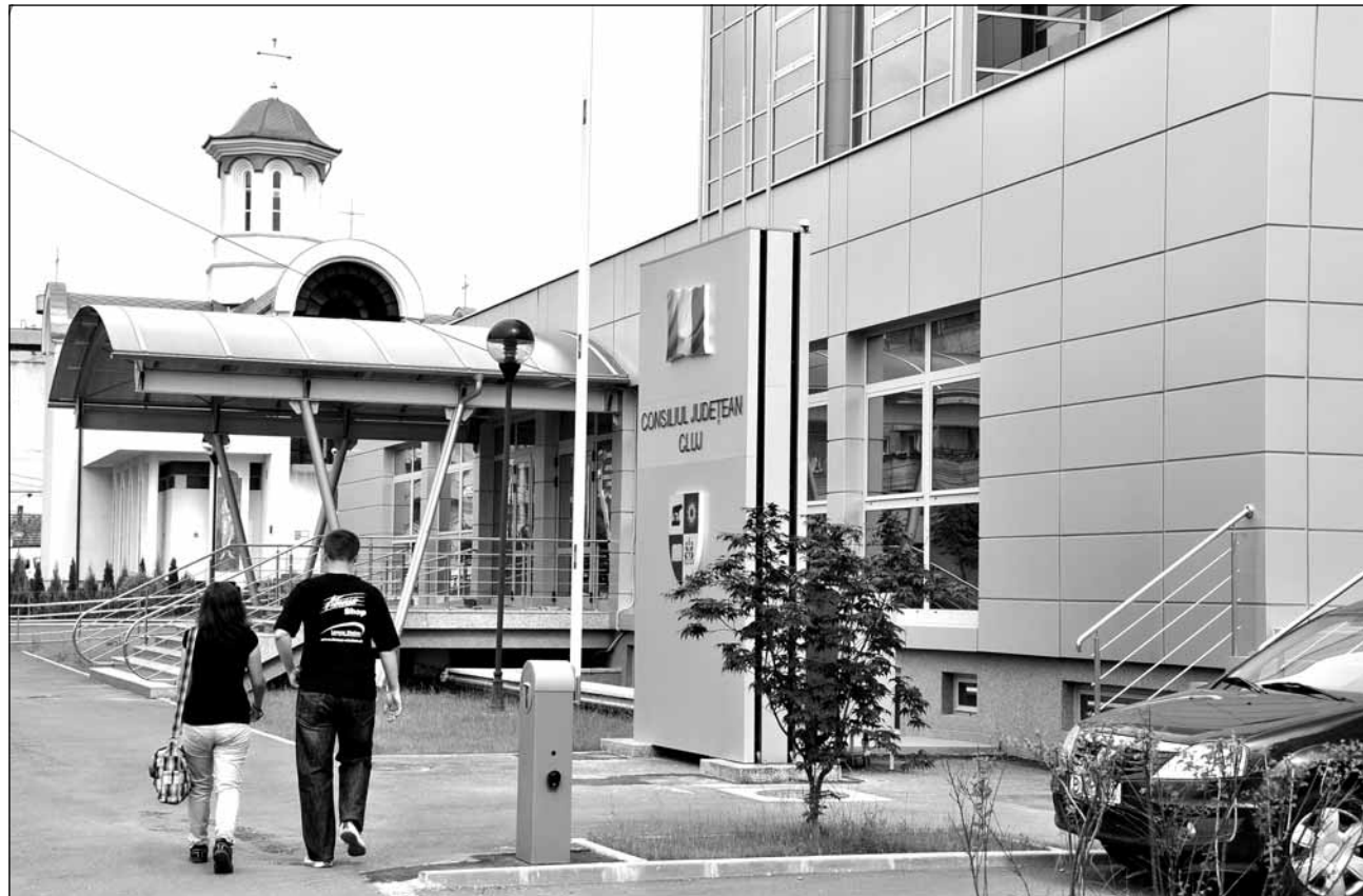
Angajații și conducerea Consiliului Județean Cluj tratează cu indiferență marile proiecte cu finanțare europeană

În loc să se preocupe de bunul mers al acestor proiecte, astfel încât județul să nu piardă finanțările europene,