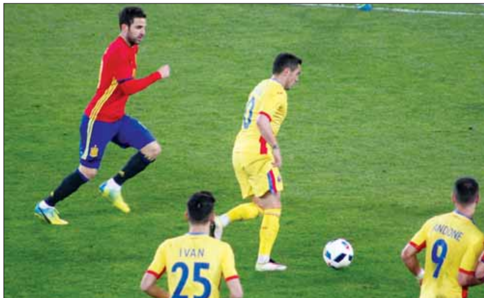
Cluj Arena a găzduit în acest an amicalul România - Spania

Reprezentanții FRF sunt încrăzătorii că administratorii arene sportive vor asigura o sta-