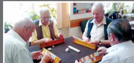
Rummy-ul este unul din jocurile preferate ale seniorilor