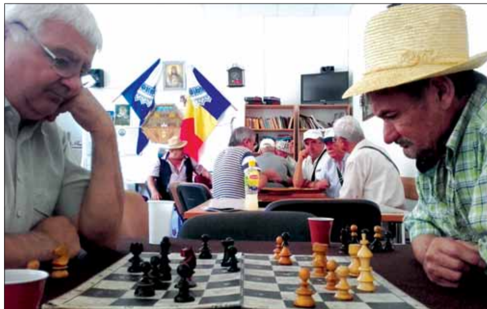
Doi dintre membrii Clubului Pensionarilor de pe strada Horea joacă o partidă de șah

Spune că dimineața, primul lucru pe care îl face este să se barbierască. Face zilnic acest lucru. Apoi, după micul dejun