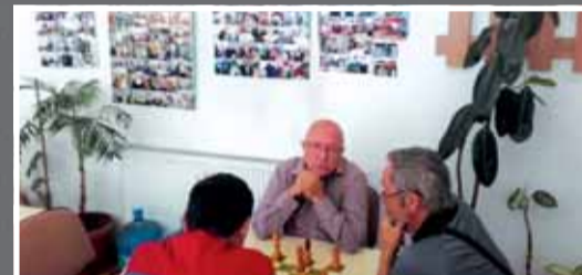
Pe pereți sunt fotografiile de la evenimentele speciale