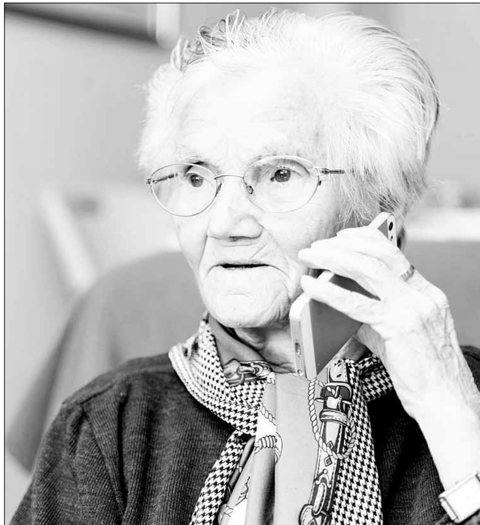
Programul Necta îi ajută pe seniori să folosească smartphone-ul, prin comenzi mai simple și intuitive.

Soluția aparentă la această problemă este să vă orientați către achiziția unuia dintre multiplele modele de telefoane de seniori, informează playtech.ro. Acestea nu sunt neapărat smart, dar au butoane mari, câteva funcții simple și destul de multe limitări. Datorită flexibilității sistemului de operare Android, mai există însă o soluție nu foarte evidentă. Aceasta implică utilizarea unui launcher gratuit care vă schimbă complet interfața telefonului pentru a o face mult mai prietenoasă cu persoanele care