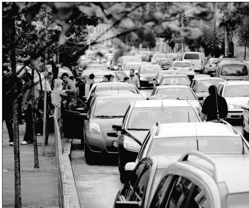
Să fii șofer pe unele străzi din Cluj-Napoca, la orele amiezii, poate fi un adevărat calvar

Numărul de autoturisme a crescut în ultimii ani. Mașinile înmatriculate în județul Cluj