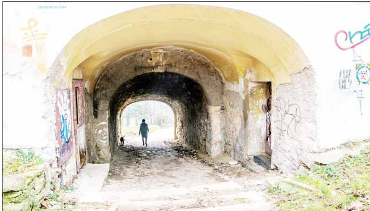
Cele mai ieftine bordeluri din Cluj, în perioada interbelică, erau pe Cetățuia

În Cluj, în perioada interbelică sexul pe bani puțini se practica pe Cetățuia. Acolo prestau fetele fără școală, majoritatea țigănci și care nici nu aveau pretenții financiare mari din partea clienților. Istorisirile de can-can ale Clujului spun că o partidă de amor cu fetele de pe Cetățuia costa cât un bilet la cinema. „În perioada interbelică, pe Cetățuia funcționau cele mai ieftine bordeluri. În vremea respectivă, elevii de la Barițiu (care avea sediul în actuala clădire a U-