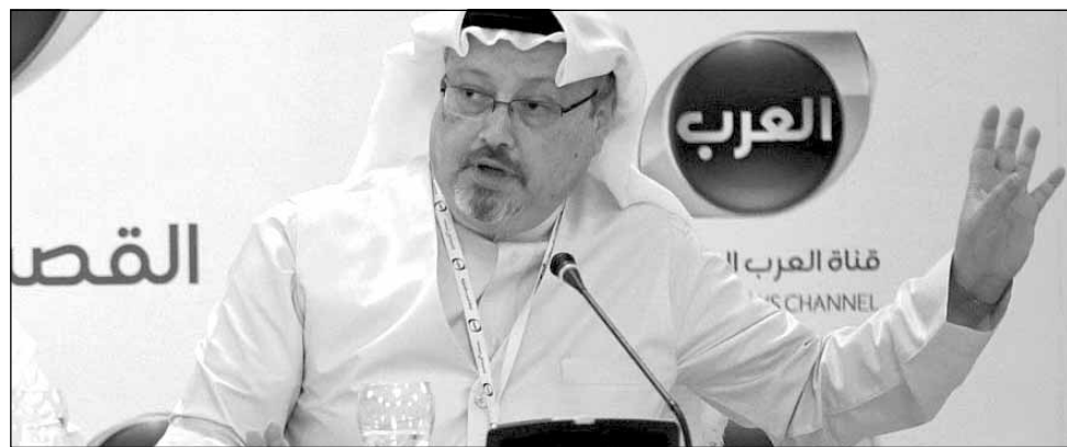
Jamal Khashoggi a dispărut după ce a intrat în consulatul din Istanbul la 2 octombrie

Arabia Saudită a trimis o echipă în Turcia pentru o investigație comună și găsirea de dovezi despre crima comisă în Consulatul Arabiei Saudite din Istanbul, a declarat ministrul saudit într-o conferință de presă în timpul unei