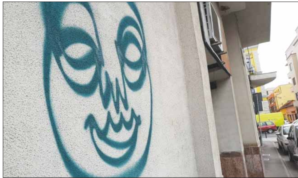
Pe clădirile din centrul istoric al Clujului sunt desenate diferite inscripții de tip graffiti