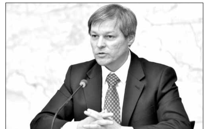
Dacian Ciolos: „nu funcționează niciunde perfect justiția”

„E foarte bine că președintele convoacă această discuție acum, după ce institu-