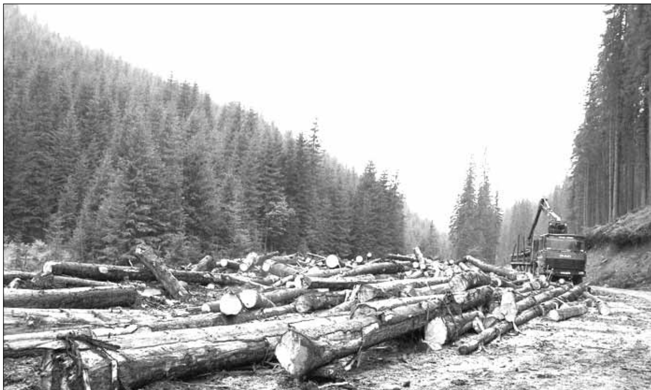
De pe o suprafață de 463 de hectare a dispărut vegetația forestieră fără documente, prejudiciul estimat ridicându-se la aproximativ 700.000 de lei

Pădurea aparținând Composesoratului Măguri Cluj ocupă o suprafață de 2.000 de hec-