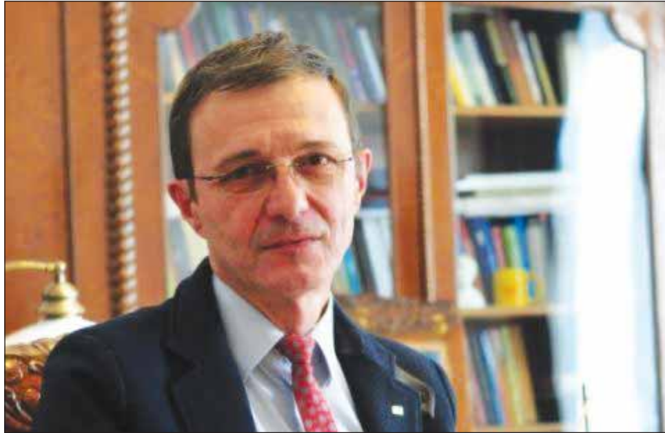
Ioan-Aurel Pop consideră că tinerii confundă ideea națională cu naționalismul și cu șovinismul

„Eu cred că în mințile tinerilor de astăzi există o idee națională speriată și plăpândă, pentru că unii confundă ideea națională cu naționalismul și confundă naționalismul cu șovinismul și confundă naționalismul cu xenofobia. Ori asta este o imensă greșeală. Toate