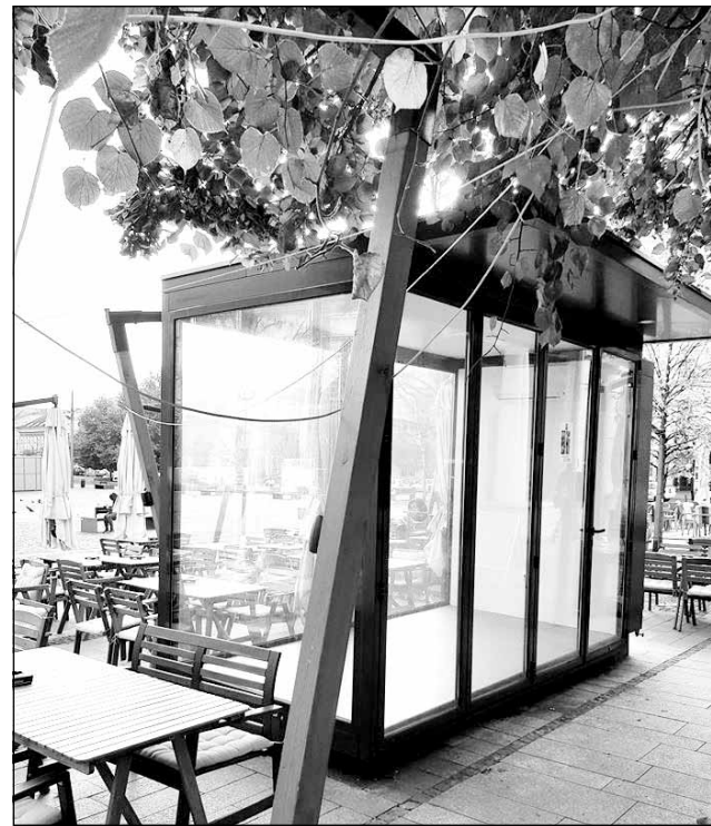
În urmă cu un an și jumătate, primăria Cluj-Napoca a inaugurat chioșcurile de lux din Piața Unirii