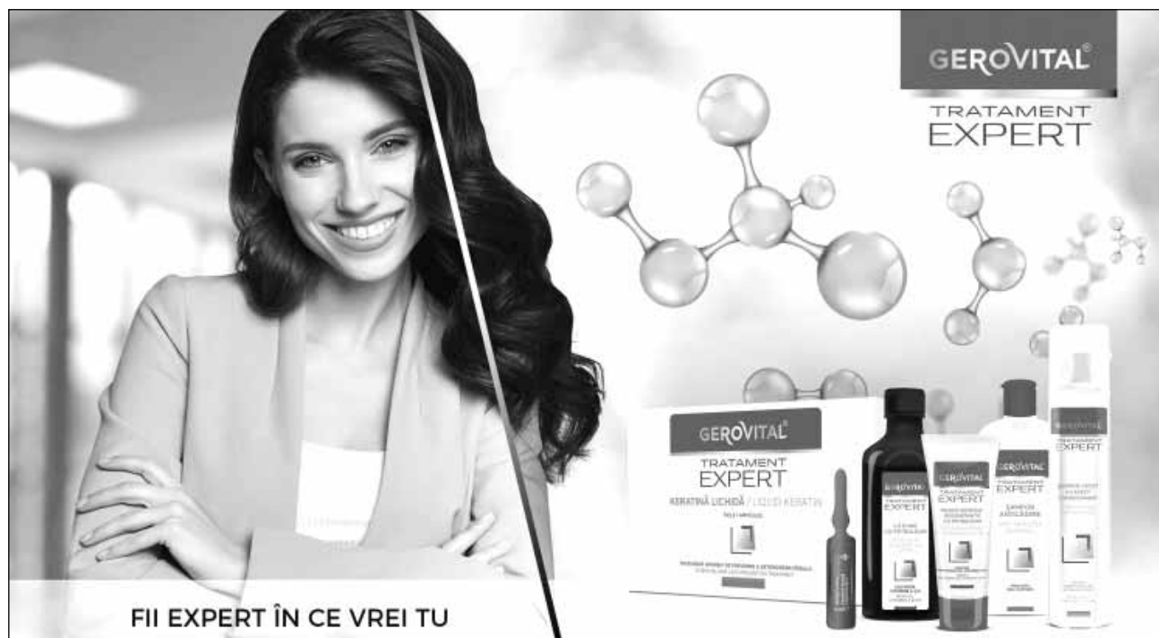
Tratamentele pentru păr Gerovital Tratament Expert au fost create pentru a preveni și rezolva eficient probleme specifice ale tuturor tipurilor de păr

„Am decis să inovăm gama Gerovital Tratament Expert pentru că am simțit în piață o reală nevoie de produse care să soluționeze rapid și eficient problemele diverse ale părului, cauzate fie de obiceiurile periodice care pot stresa părul (vopsit, styling, utilizarea frecvență a aparatelor de coafat), fie de factorii externi la care ne expunem zilnic (agitație, stres, poluare, radiații UV etc). Eficiența noilor formulări și a noilor produse a fost demonstrată prin diverse măsurători instrumentale, din cadrul testelor realizate atât în țară, cât și peste hotare, asigurându-ne că