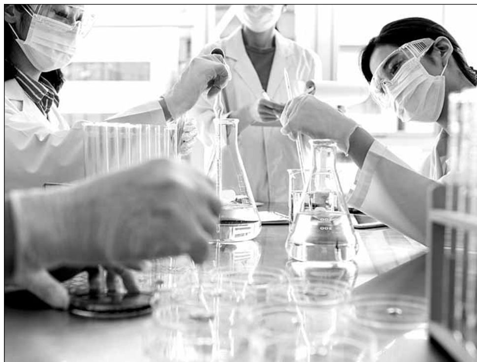
82% dintre oamenii de știință consideră că efectele vor fi „negative” sau „foarte negative” asupra domeniului cercetării din Uniunea Europeană

Progresul științific „necesită mobilitatea persoanelor și a ideilor dincolo de frontiere, pentru a permite schimbul rapid de expertiză și de tehnologie”, subli-