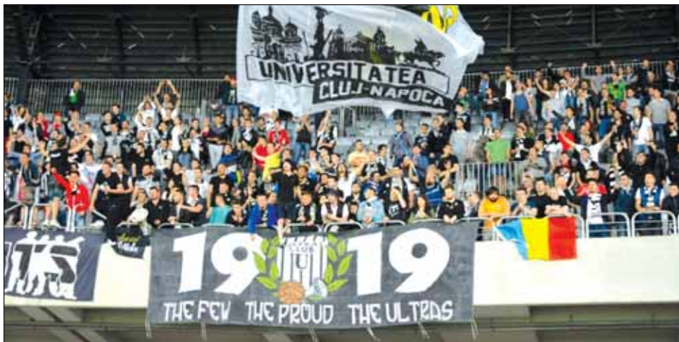
Universitatea Cluj se află pe locul 5 în clasamentul Ligii 2 de fotbal