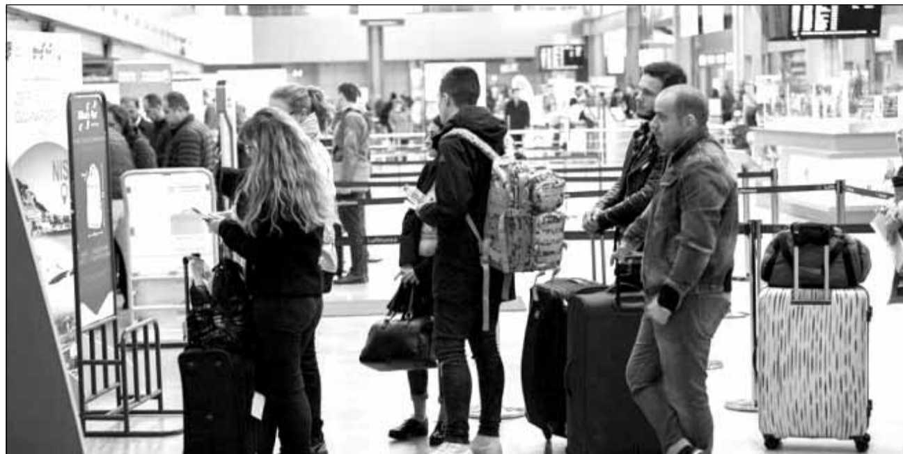
Neoficial, peste 4 milioane de români locuiesc în afara granițelor țării

Cel mai frecventat aeroport – destinație din România este București. De asemenea, pentru a călători la Cluj-Napoca, prețul mediu al biletului de avion este de 113 euro. Peste 30% dintre călători vin