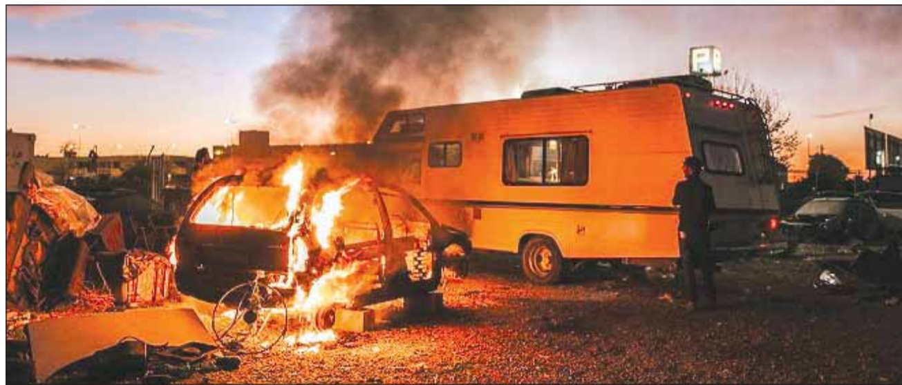
Parking este cel de-al patrulea lungmetraj din cariera de regizor a cineastului Tudor Giurgiu

Cel de-al patrulea lungmetraj semnat de Tudor Giurgiu spune povestea lui Adrian, un poet din Sângeorz-Băi care emigrează ilegal în Spania anulul 2002. Ajuns în Cordoba, se angajează paznic de noapte într-un parc auto, iar existența lui pendulează între imposibila poveste de dragoste cu o cântăreață spaniolă și