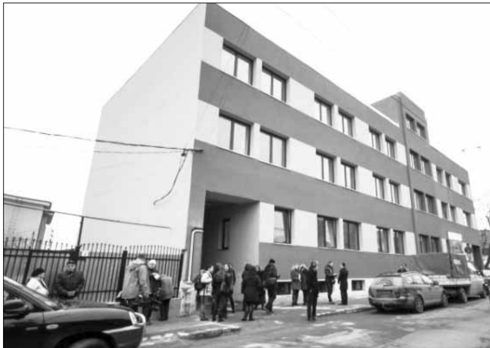
Emil Boc a anunțat că anul acesta vor fi finalizate locuințele sociale de pe strada Ghimeșului și vor începe altele

„Nimeni nu trebuie să fie lăsat în urmă, toți cei care au două mâini și pot să muncească trebuie să aibă cadrul ca ei să-și poată câștiga cele necesare traiului, să poată trăi alături de familiile lor. Nu accept ca cei care pot munci să stea cu mâna întinsă! Este inacceptabil ca cei care sunt sănătoși, au două mâini și pot munci să stea și să aștepte cu mâna întinsă de la stat, nu este normal! Însă, pentru cei care nu pot munci, din diverse cauze, dizabilități, accidente temporare, probleme de sănătate, acolo trebuie să ne arătăm solidaritatea. Trebuie să-i ajutăm să iasă din starea asta, dar stabilind regulile foar-