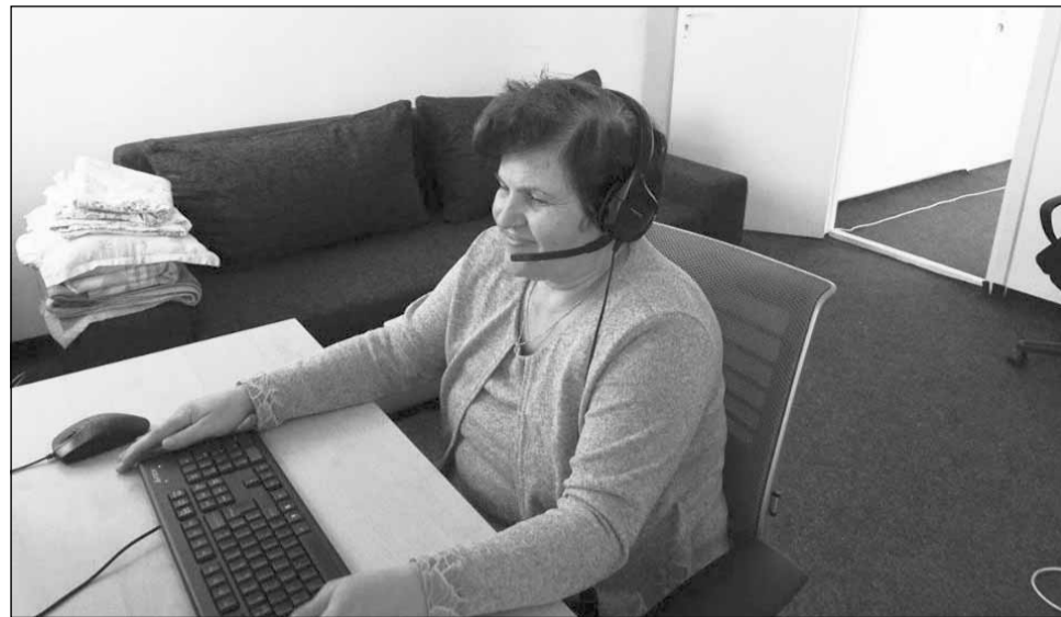
Proiectul PEDITEL 1791 se va desfășura în perioada 2 mai - 31 iulie 2019 cu ajutorul primăriei din Cluj-Napoca

Peditel 1791 este un call center pediatric care oferă sfa-