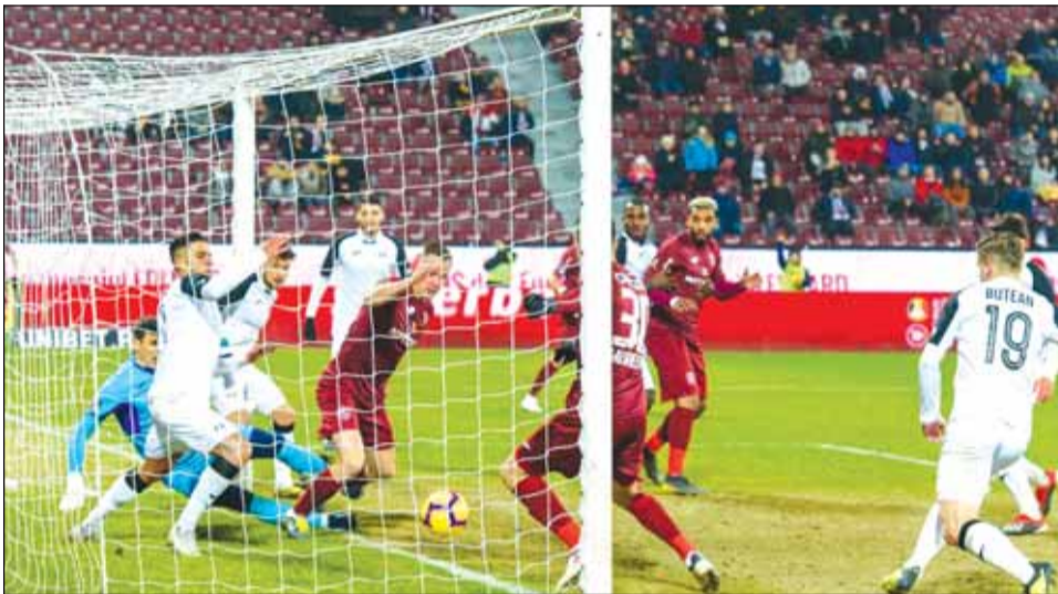
Jucătorii CFR-ului sunt obligați să marcheze de cel puțin trei ori pentru a avea o șansă la calificare

Misiunea celor de la CFR Cluj este una aproape imposibilă, în condițiile în care campioana en-titre a marcat ultima dată trei goluri în deplasare într-un meci disputat la începutul lunii decembrie. „Feroviarii” au învins la momentul respectiv pe Dinamo, 3-0, într-un duel din Liga 1. Astra Giurgiu și-a compromis șansele pentru ocuparea unui loc care duce în cupele europene în campio-