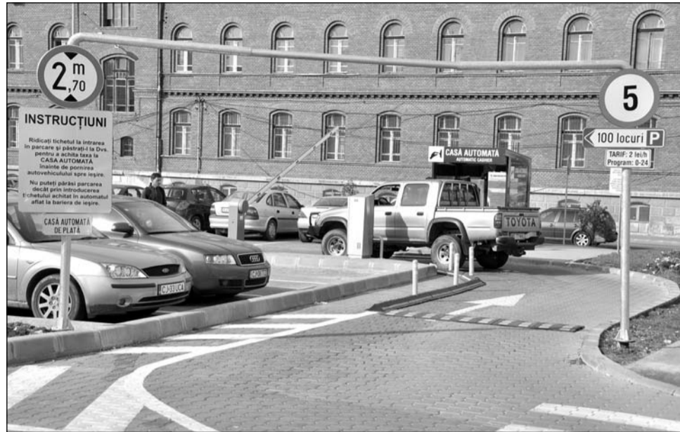
Parcarea cu barieră din Piața Cipariu a fost înființată în urmă cu aproximativ cinci ani, cu caracter temporar

„A fost protocolul încheiat între Primărie și Biserica Greco-Catolică pentru a realiza un parking subteran. Am muncit aproape 2 ani de zile. Am făcut studiu de fezabilitate care să ne asigure că se poate realiza lucrarea, că nu este pusă în pericol catedrala, că există soluții tehnice, că nu ne împiedică existența acelei magistrale de apă care e amplasată la un colț al catedralei. După ce aceste lu-