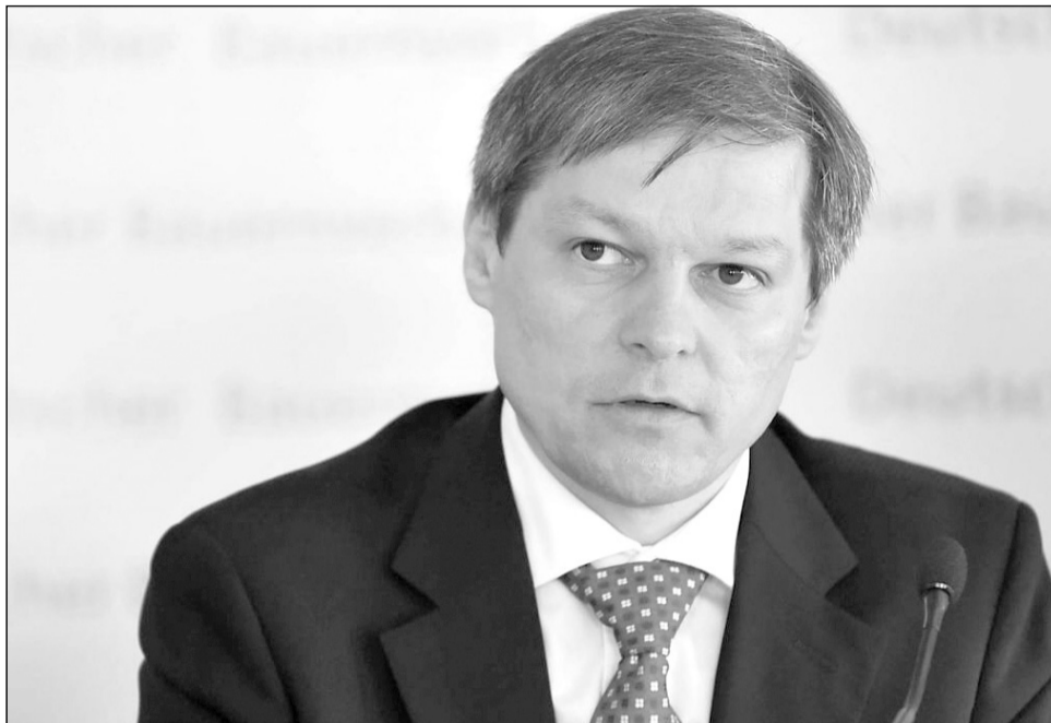
Cioloș a anunțat la Cluj că va depune dosarul pentru înființarea unui partid

„Îmi doresc ca a face politică să nu devină o profesie de bază, ci un intermezzo în