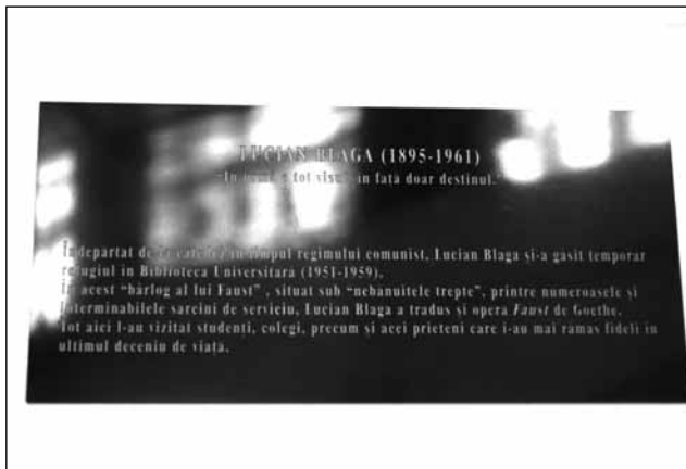
Inscripția de pe ușă „Bârlogului”