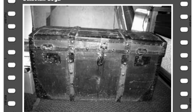
Cufărul în care Lucian Blaga își ținea manuscrisele