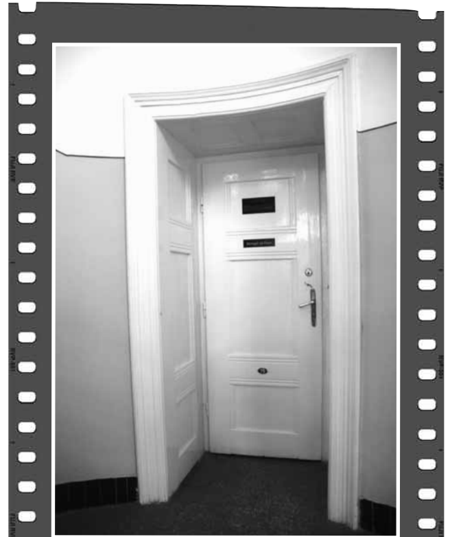
Ușa de intrare în „Bârlog”

Drumurile lui Lucian Blaga între sălile bibliotecii și „Bârlogul lui Faust”, pașii pe scara de stejar și poate câte o privire pe geam sunt reconstituite acum de cei doi locatari ai cămăruței sale. Manuscrisele poetului din Colecțiile Speciale sunt atinse de cercetători, iar opera sa prinde viață sub ochii cititorilor. Lucian Blaga rămâne o prezență vie în Biblioteca Centrală Universitară.