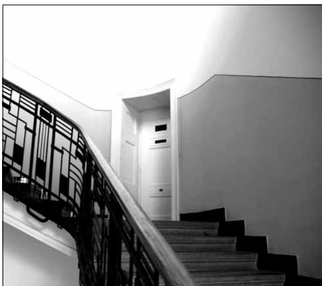
Scările care duc spre încăperea de sub „nebănuitele trepte”