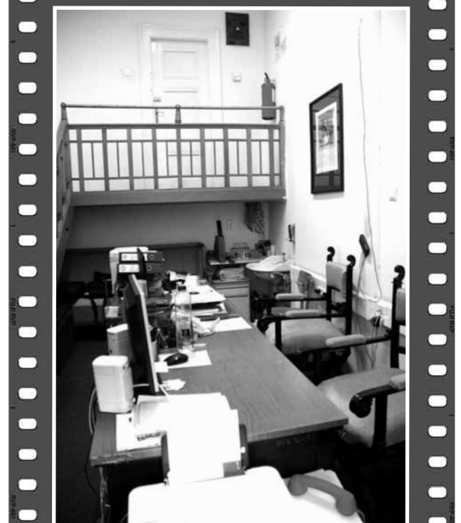
În fundal, canapeaua pe care dormea Lucian Blaga