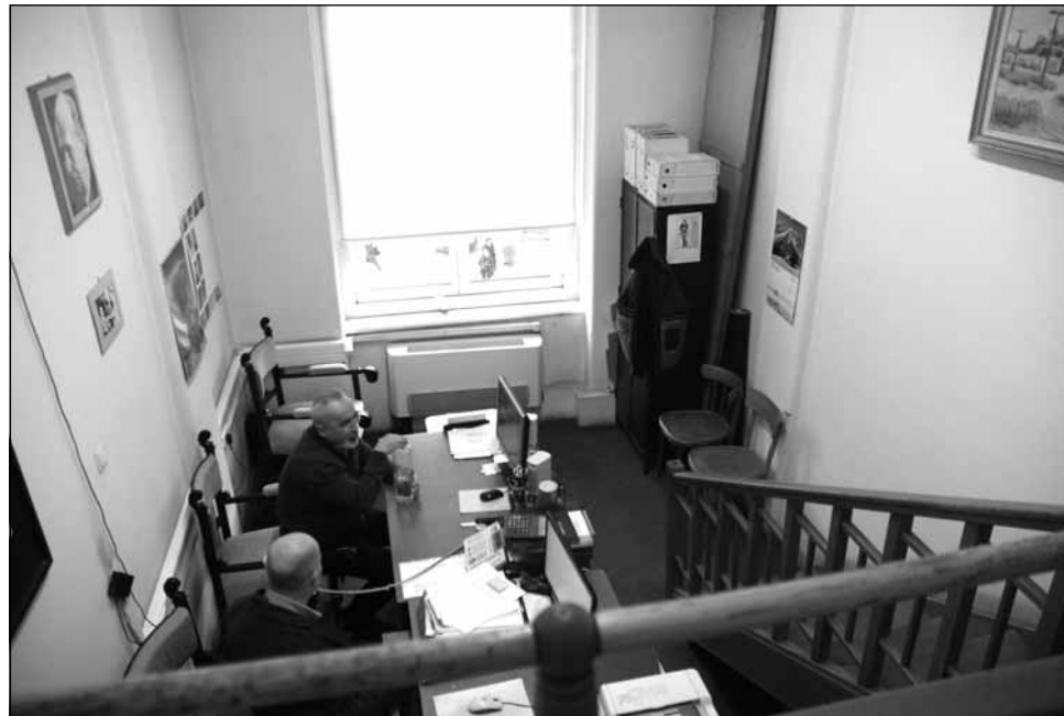
„Bârlogul lui Faust”, văzut de la intrare