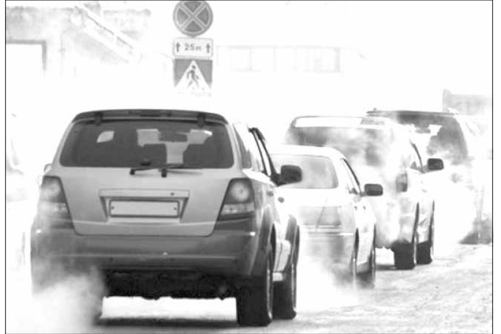
Interzicerea circulației mașinilor diesel mai vechi ar putea avea implicații pentru viitorul industriei auto

Introducerea cu efect imediat a unor interdicții de circulație cu privire la drumurile sau secțiuni de drum importante ar fi legitimă și ar putea afecta toate modelele, exceptând cele care îndeplinesc standardele de emisii Euro-6, se arată în motivația tribunalului. Pentru zonele me-