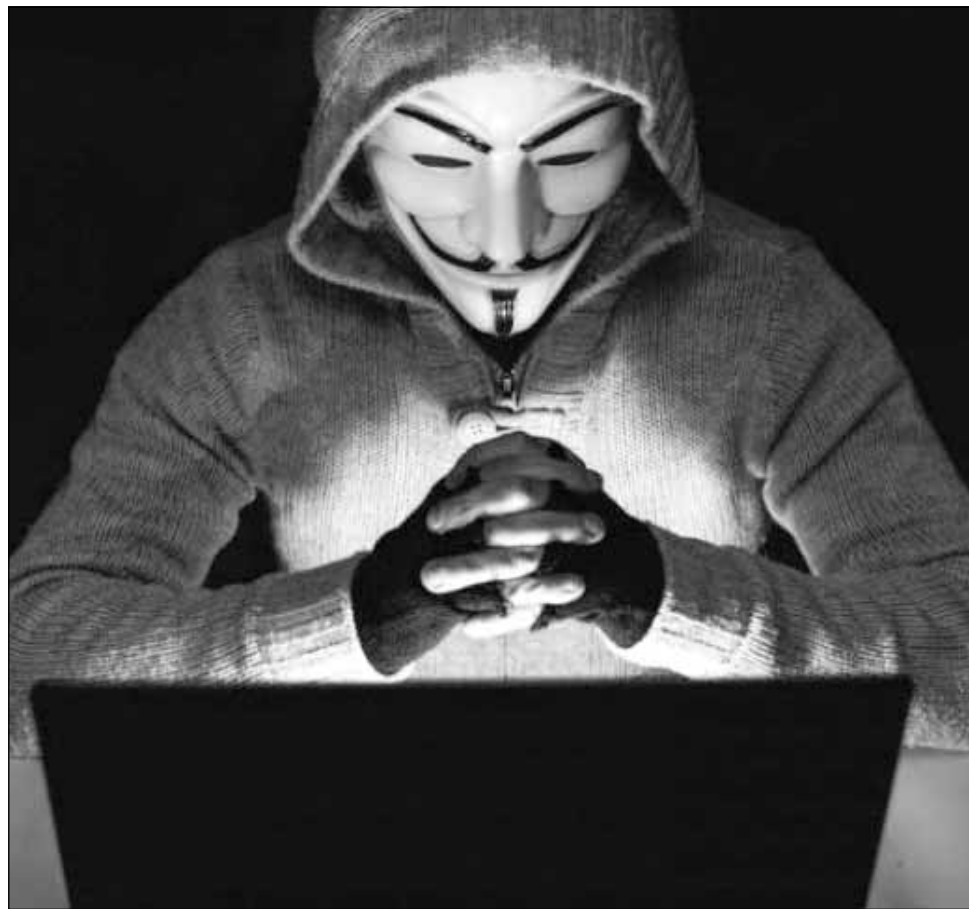
TeenSafe a pus date necriptate referitoare la utilizatorii săi pe câteva servere Amazon

Asta înseamnă că accesul la numele de utilizator și parola aferente contului tău nu