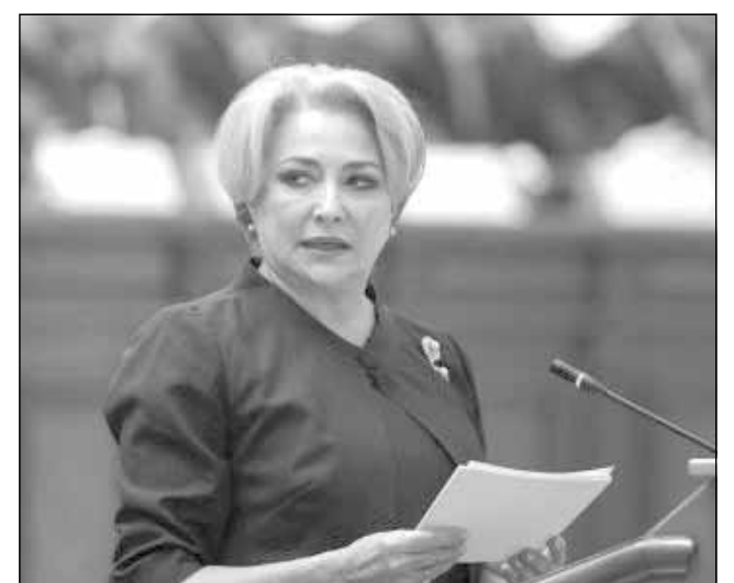
Premierul Viorica Dăncilă spune că Pilonul II de pensie nu se va desființa

rantie, o siguranță a vieții că la momentul în care ajungi la vârsta în care nu mai poți fi dinamic, activ, să ai resursa financiară asigurată și nu este normal să te atingi de el, ca stat. În toată lumea când ești pe creștere economică îți iei măsuri pentru vremea rea. Când am avut vremuri bune în 2006-2007, nu ne-am pregătit pentru vremuri mai rele, am păpat toți banii, inclusiv din vânzarea BCR-ului, vreo 3.2 miliarde de euro, și ne-am trezit în 2008 complet nepregătiți. Acum, în vremuri bune, ar trebui să investim mult mai mult în ceea ce ne face competitivi și rezistenți, să ai mai mulți bani în investiții, nu să băgăm banii în consum. În vremuri grele, trebuie să ne pregătim și să avem