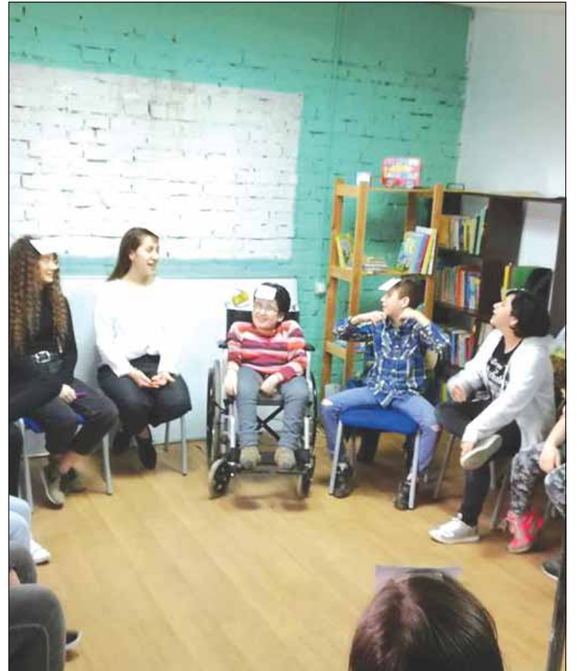
Copiii își fac temele, se joacă și intră în contact cu cultura

Abandonul școlar este un fenomen des întâlnit, mai