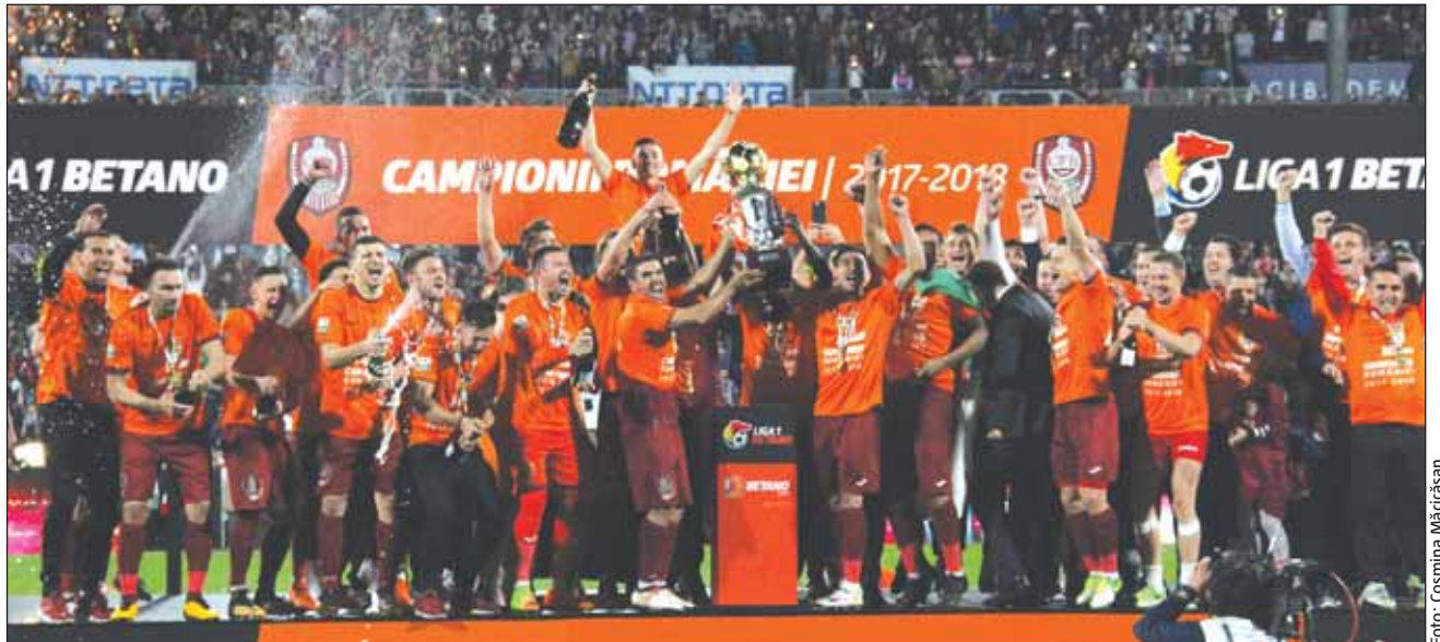
CFR Cluj a mai cucerit titlu în 2008, 2010 și 2012

În celălalt pol de interes al etapei, FCSB a învins-o pe As-