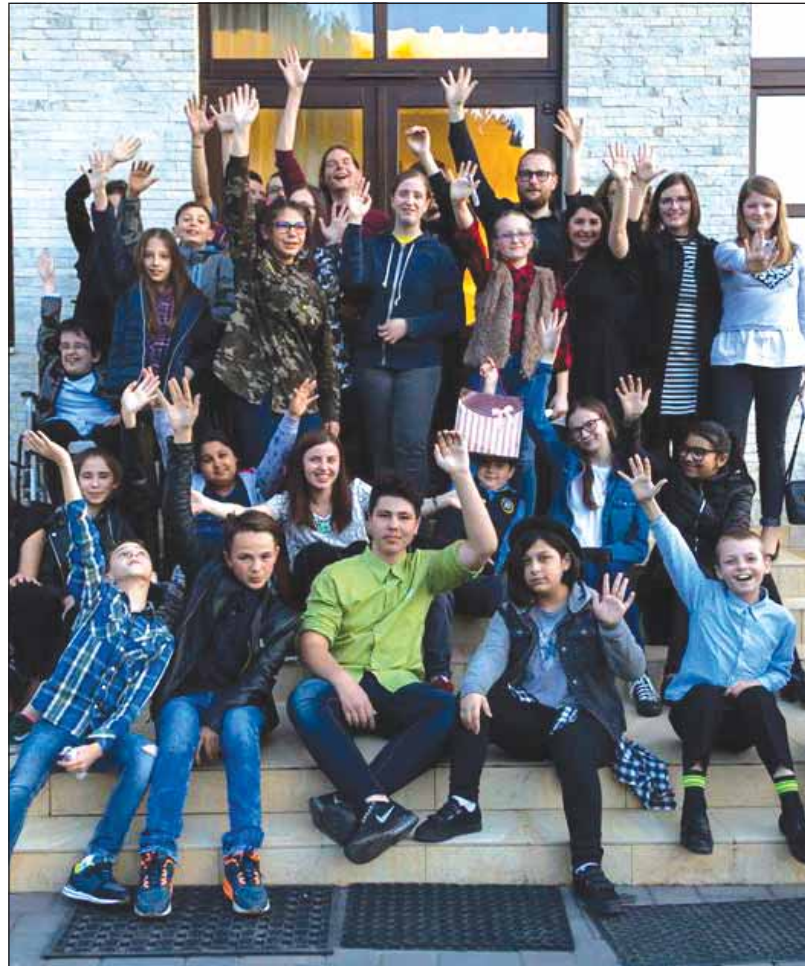
La centrul de zi „Something New” merg 20 de suflete

În clădire, totul este mic. Scaunele, măsuțele, o tablă care te îndeamnă, cu cretă colorată, să zâmbești. Peste tot sunt jocuri, jucării, creioane, cărți. Toate așteaptă cele 20 de suflete care au vârste între 6 și 15 ani să vină să le folosească. Sunt 20 de copii a căror părinți nu le pot oferi acces la meditații, la o excursie, la o piesă de teatru. Din acest motiv, din 2013, copiii care provin din familii defavorizate vin aici, pen-