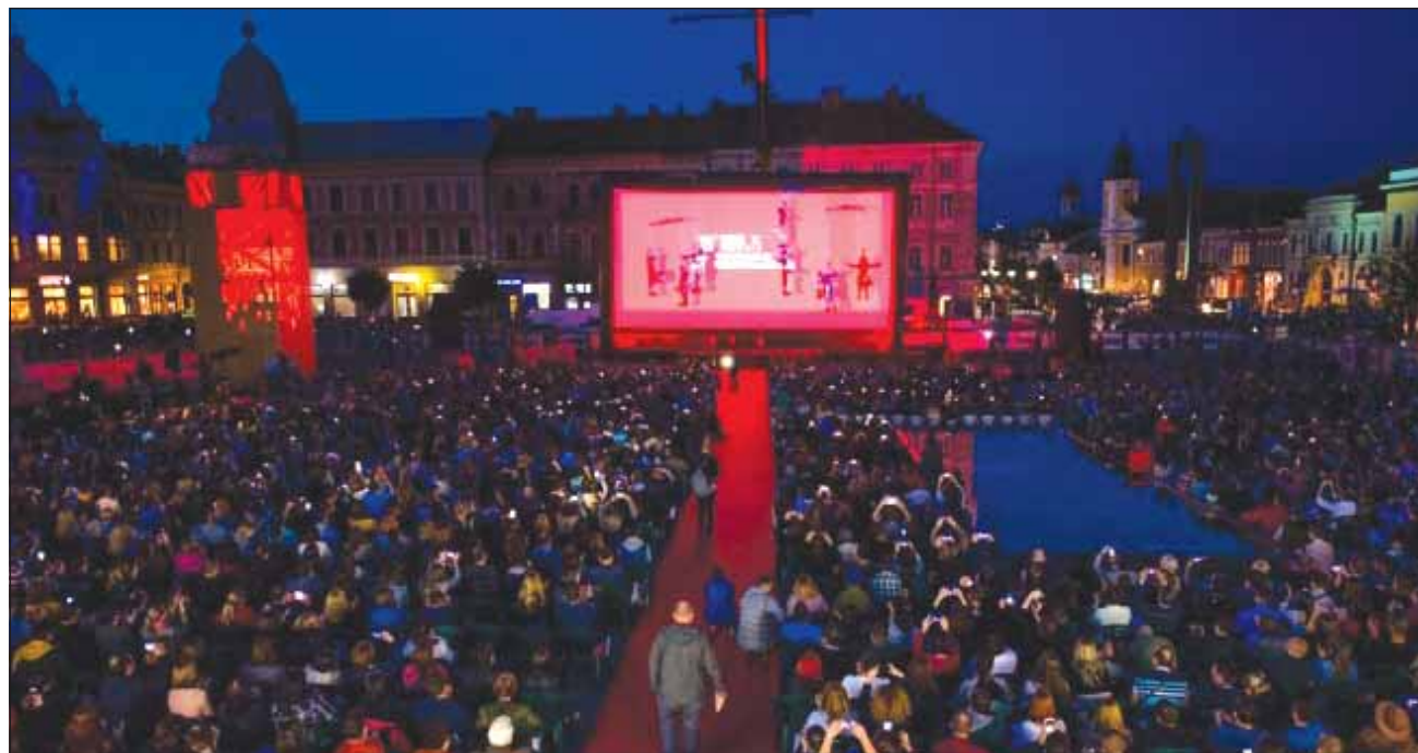
Lucrările unora dintre cei mai apreciați artiști autohtoni vor putea fi admirate în cadrul expozițiilor

Cu peste 200 de concerte în doar primii 6 ani de activitate, timișorenii de la Jazzy-BIT au bifat deja câteva dintre cele mai mari festivaluri de jazz din lume și s-au făcut auziți în 9 țări, pe 2 continente. Trio-ul loud jazz premiat în competiții de renume va seduce publicul cu o combinație energică de jazz și rock, presărată pe alocuri cu blues, latin și funk, miercuri seară, pe 30 mai, de la ora 21:00.