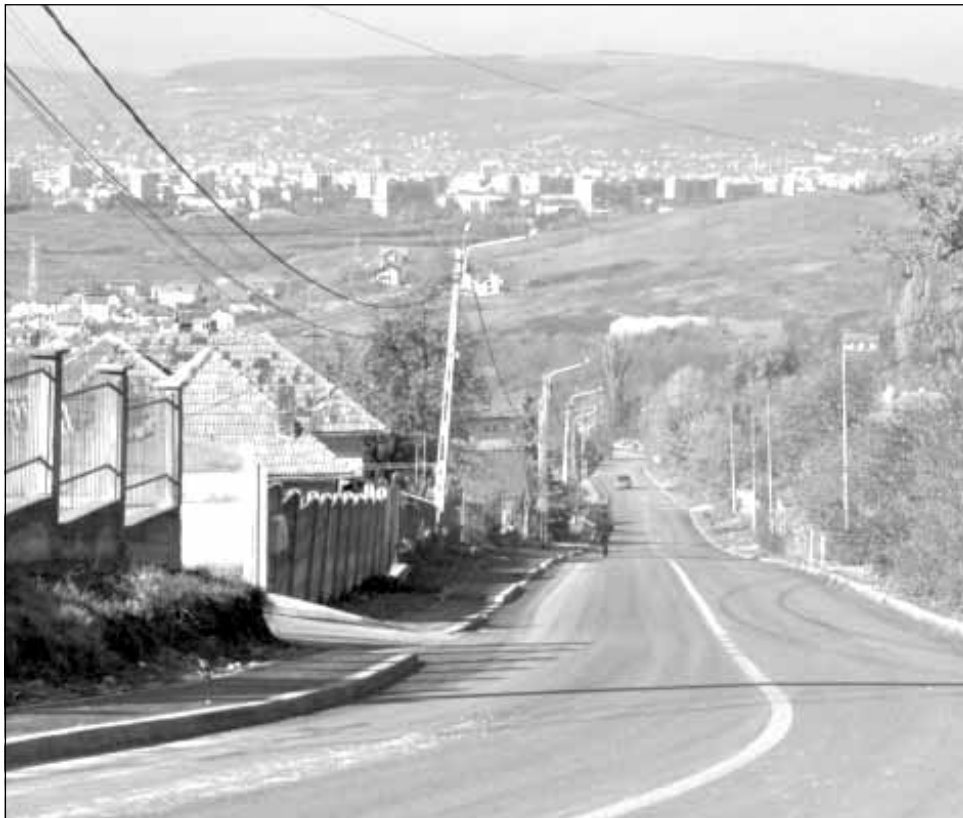
În Borhanci se așteaptă construirea unui sens giratoriu și extinderea străzii Brâncuși pentru a se da undă verde construcțiilor

Anul trecut, municipalitatea a organizat o consultare