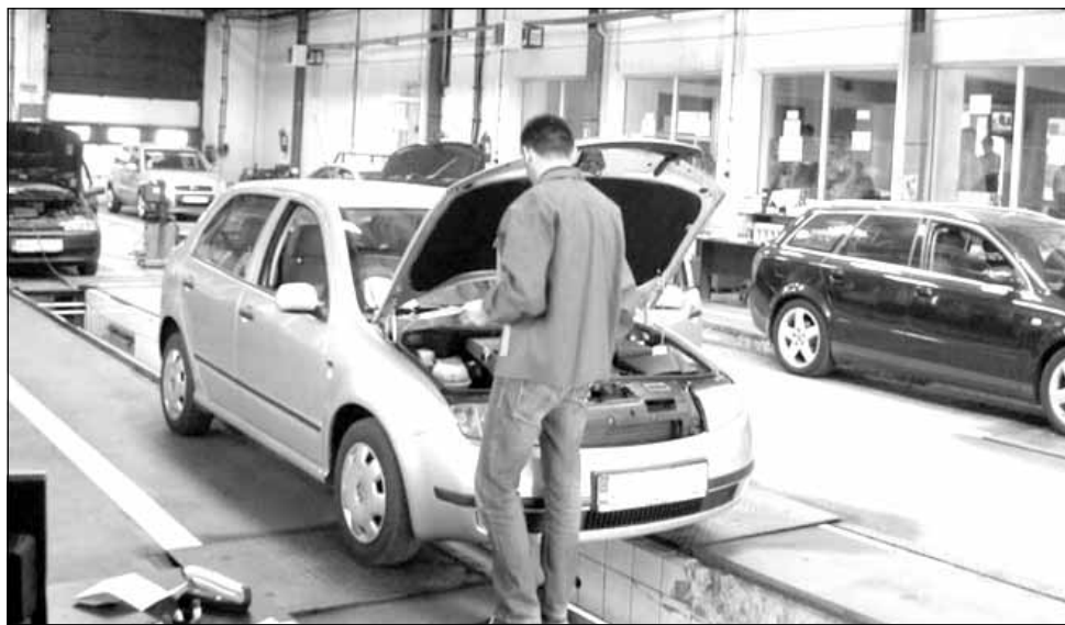
Stația ITP trebuie să asigure, prin intermediul sistemului video, înregistrarea activității efectuate pe linia de ITP,

Potrivit instituției, procesul de verificare a conformității instalării sistemului în stațiile ITP va continua și după 20 mai, până când toate cerințele legale vor fi îndeplinite similar și uniform