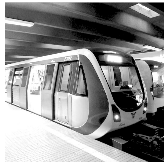
Metroul ar urma să aibă 15 stații pe o lungime de aproximativ 16 km

Pe lângă faptul că prețul oferit de Metroul SA, de respectiv 29,38 milioane de lei, a fost mai mic decât cel al asocierii declarate câștigătoare, reprezentanții companiei bucureștene acuză și depunerea artificială a ofertei lor. Mai mult, aceștia spun că Primăria Cluj-Napoca avea obligația să elimine din licitație asocieria declarată câștigătoare,