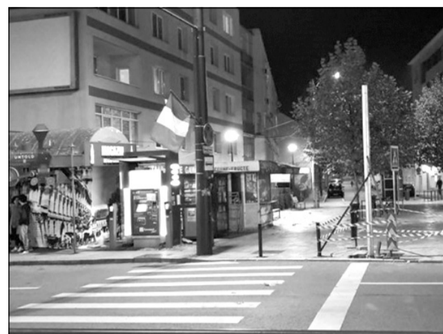
În fiecare zi în fața trecerii de pietoni din Piața Gării întreg traficul ce vine dinspre strada Horea se blochează

recție”, a dezvăluit viceprimarul Tarcea. În schimb, există și clujeni care se bucură de noul semafor ce va dirija traficul din zonă. „Era și cazul, toți traversau haotic!”, „Foarte bine. Dacă prindeai puhoiul de dimineață, până la ambulanță era coada de mașini”, „Era cazul.... Numai așa mai civilizăm oile să treacă strada”, „Era și cazul. Se făcea coloană cum tot trecea câte un pieton. Foarte bine!” sau „Beton. Multe permise s-au săltat la acea trecere”, se arată în comentariile clujenilor.