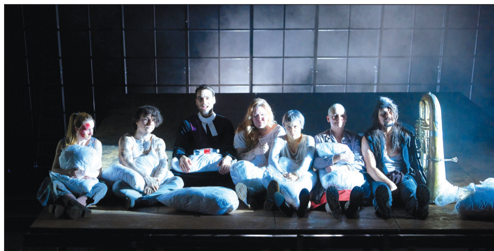
Premiera piesei „Mutter Courage și copiii ei” va avea loc mâine și va deschide Festivalul Uniunii Teatrelor din Europa