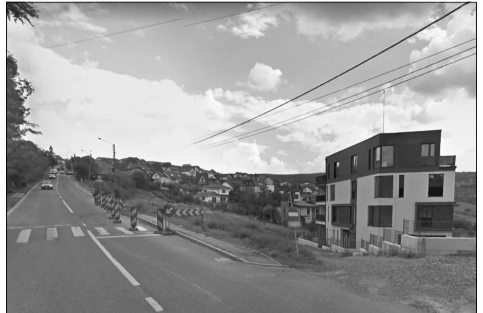
Strada Borhanciului a suferit degradări majore prin alunecarea de teren produsă în zona trotuarului (care a antrenat și o parte din carosabil) în zona de intersecție cu strada Voievodul Menumorut

„În prezent, strada Borhanciului a suferit degradări majore prin alunecarea de teren produsă în zona trotuarului (care a antrenat și o parte din carosabil) în zona de intersecție cu strada Voievodul Menumorut. Situația actuală a străzii este una nesatisfăcătoare în această zonă de alunecare, din punct de vedere al condițiilor de trafic. Zona de carosabil este asfaltată, cu trotuar bine conturat pe latura numerelor cu soț, care la intersecția cu strada Voievodul Menumorut a suferit degradări în urma alunecărilor de teren, antrenând și o parte din carosabil. Sistemul rutier actual nu asigură o circulație fluentă, în condiții optime, iar accesul pe porțiunea respectivă se desfășoară cu dificultate. Lucrarea are ca scop refacerea tronsonului de drum la starea inițială. Zona de carosabil și trotuar necesită refacere pe o porțiune de 78 metri liniari și consolidare cu piloți forțați pe două rânduri pe o lungime de 25 metri liniari. Se va crea pe domeniul public un trotuar pe partea numerelor fără soț pentru a asigura o alveolă pentru autobuze. Solu-