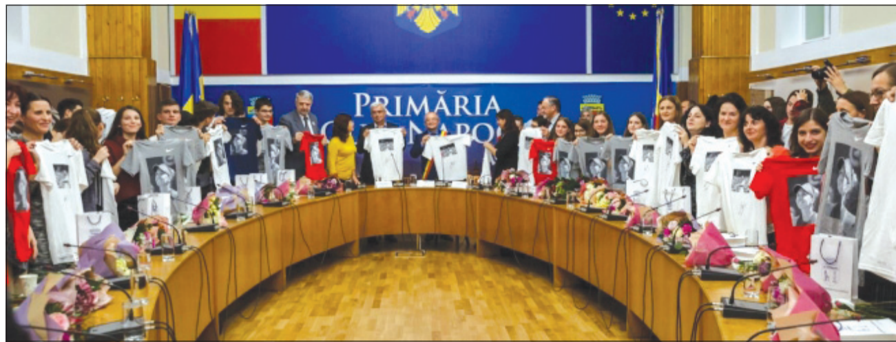
101 elevi și profesori clujeni au fost premiați joi pentru rezultatele deosebite obținute în acest an școlar

„Felicit în primul rând tinerii care au obținut performanțe la examenele de Evaluare Națională și Bacalaureat și la olimpiade, dar și corpul didactic care a avut grijă și i-a îndrumat și, nu în ultimul rând, conducerea școlilor și a Inspectoratului Școlar pentru ceea ce au făcut. Vreau să știți că din perspectiva strategiei orașului nostru, componenta educației este una fundamentală. 20% din ce plătesc clujenii ca impozite și taxe se întorc în educație și