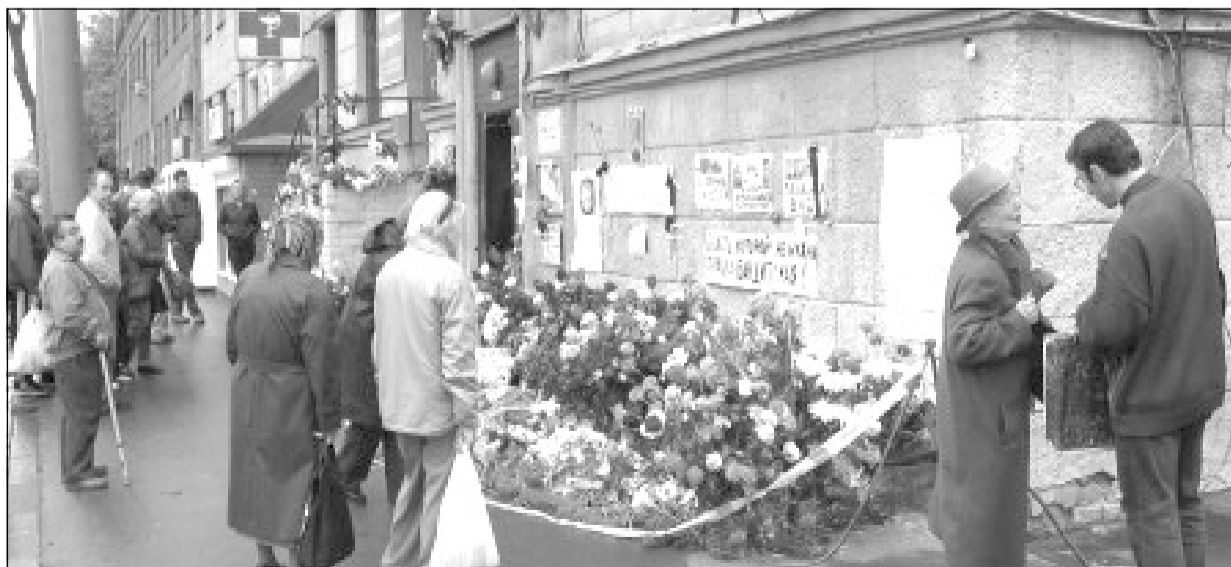
Anna Politkovskaya a fost asasinată în holul imobilului în care locuia, în 7 octombrie 2006. Era unul dintre cei mai proeminenți opoziționi ai regimului lui Vladimir Putin și milita pentru drepturile omului.