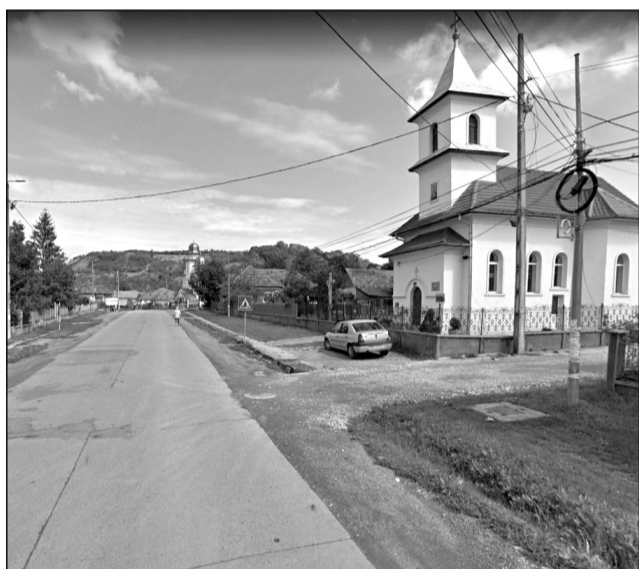
La mai puțin de 15 km de Cluj, în Chinteni, încă există drumuri neasfaltate