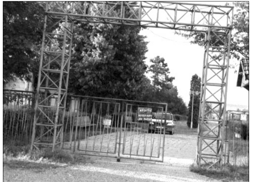
Al doilea parc ca mărime din Cluj-Napoca a intrat în proprietatea Primăriei Cluj-Napoca în iulie 2017

„Propunerea de amenajare a Parcului Feroviarilor va oferi un nivel ridicat de bio diversitate, mobilierul urban existent se va înlocui cu mobilier nou pentru repaus și recreere (mobilier pentru odihnă pe aleile principale, mobilier pentru odihnă la lo-