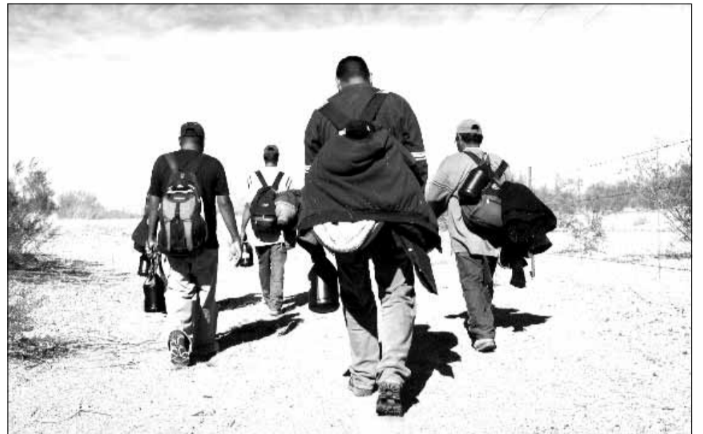
DONALD TRUMP | președintele SUA

Potrivit aceluiași raport, sute de indivizi „prezentând un risc pentru securitate” au fost blocați înainte de a sosi în SUA, în timp ce încercau să intre legal sau ilegal în țară.