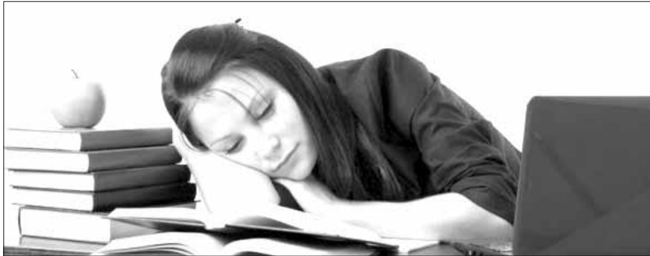
Milioane de oameni suferă de oboseală cognitivă

În fiecare an, în Franța, se înregistrează 5.000 de noi ca-