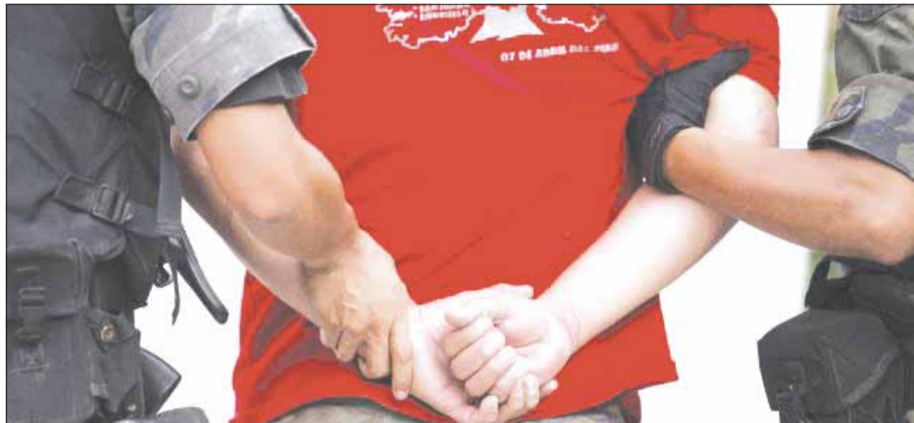
Potrivit Institutului Național de Statistici cele mai multe crime se comit în estul și sudul țării

Cea mai mare rată a criminalității înregistrată în Cluj în