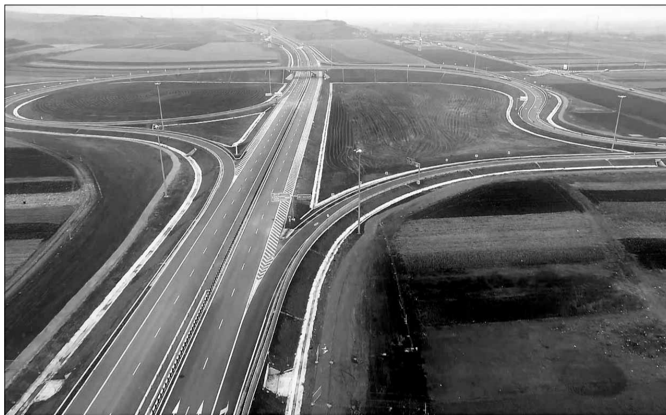
Lotul 3 din Autostrada Sebeș-Turda este gata încă de anul trecut, dar fără a fi deschis circulației rutiere

În urma inspecției, CNAIR a identificat numeroase zone cu deficiențe de planeitate și rugozitate, iar pentru aceste