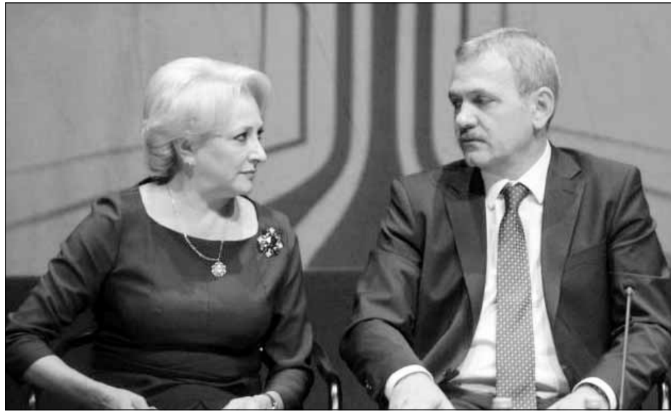
Viorica Dăncilă este prima femeie prim-ministru din România

Partidele din opoziție, PNL și USR au cerut alegeri anti-