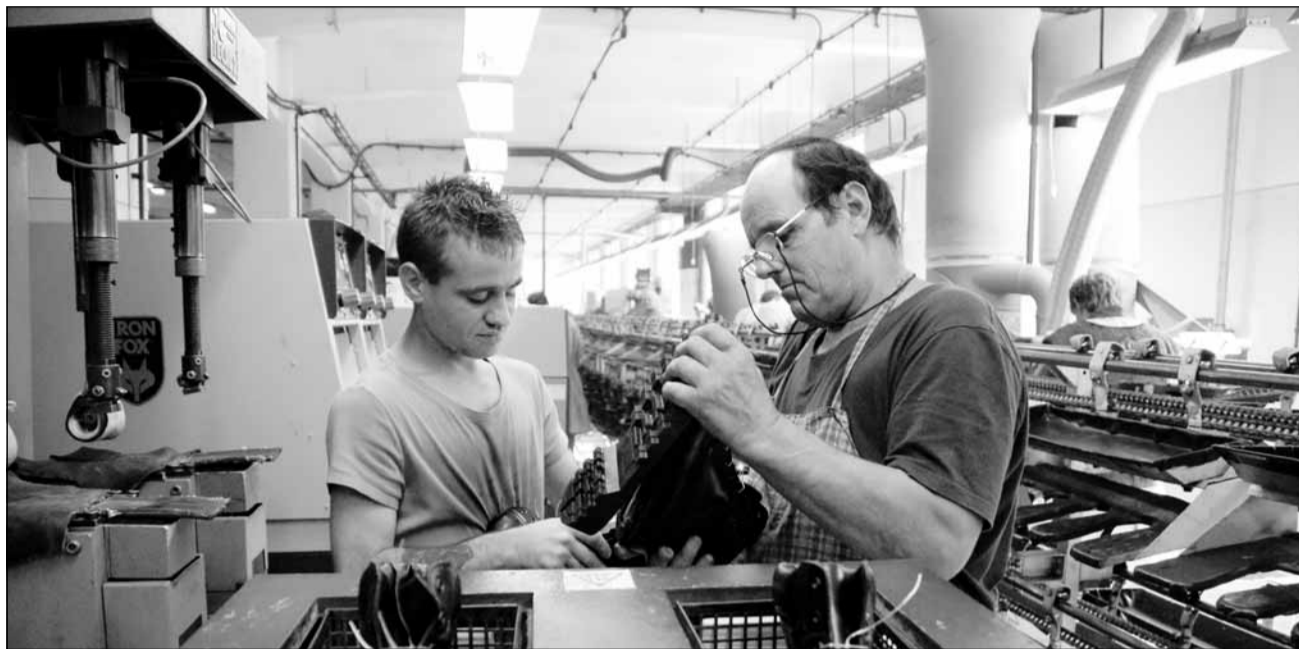
Producătorul de încălțăminte Clujana SA are 378 de angajați, societatea fiind deținută de Consiliul Județean Cluj