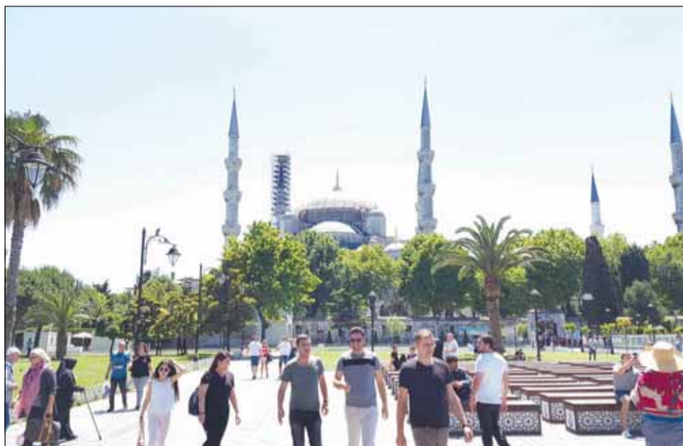
În Istanbul putem număra astăzi în jur de 3000 de moschei

Hotelul a păstrat inclusiv liftul original s-a păstrat și es-