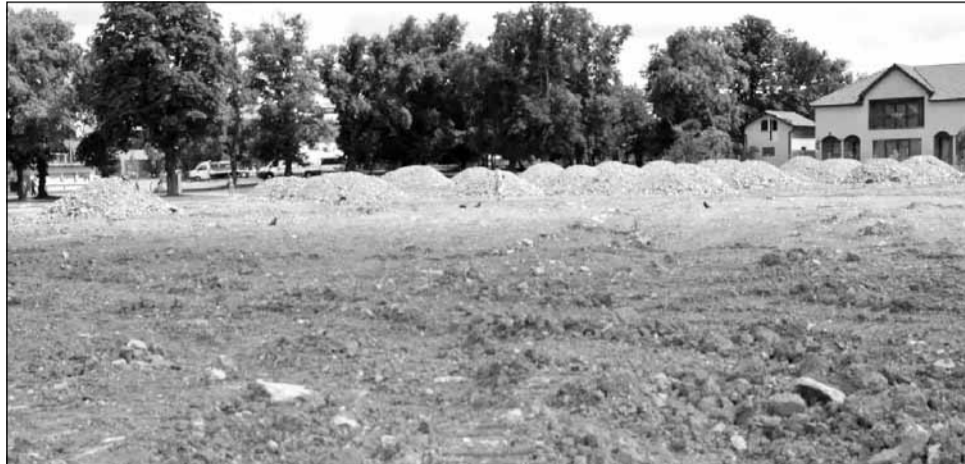
Problema lipsei spațiilor verzi și de recreere în Florești este una îndelung discutată de ani de zile

„Pe strada Someșului este părculeț de joacă pentru copii. Adică snt leagăne, tobogane, băncuțe... dar nu este umbră deloc sau un pic de spațiu ver-