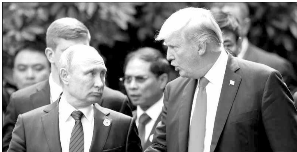
Donald Trump crede că relațiile Washingtonului cu Moscova nu au fost niciodată atât de tensionate

Actualul lider de la Casa Albă l-a acuzat pe predecesorul său, Barack Obama, că nu ar fi acționat în legătură cu informațiile privind ingerințele ruse întrucât credea că democra-