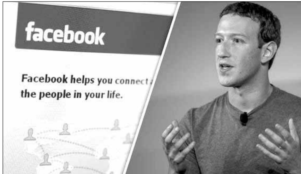
Compania lui Zuckerberg se absolvă de orice vină

Un nou raport al Business Insider confirmă ușurința deosebită cu care poți să găsești grupuri pe Facebook ce propagă conținut video piratat. Respecti-