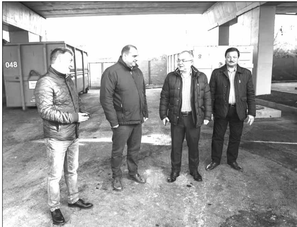
Primarul Emil Boc a inaugurat două noi puncte de colectare a deșeurilor voluminoase

„Aceste centre, pe lângă punctele gospodărești obișnuite din cartier, permit cetățenilor să aducă gratuit toate deșeurile voluminoase, canapele, paturi, dulapuri, etc. De asemenea, dacă omul își renovează casa, va aduce deșeurile din construcții, care vor fi preluate gratuit. De asemenea, frigider, televizoare vechi, deșeuri electrice. Totodată, se asigură și colectarea selectivă clasică de hârtie, carton, plastic și metal. Dacă ai acasă o canapea, mobilier, ai două soluții. Fie suni la firma de specialitate și vin cu un container, plătești o sumă modică, fie