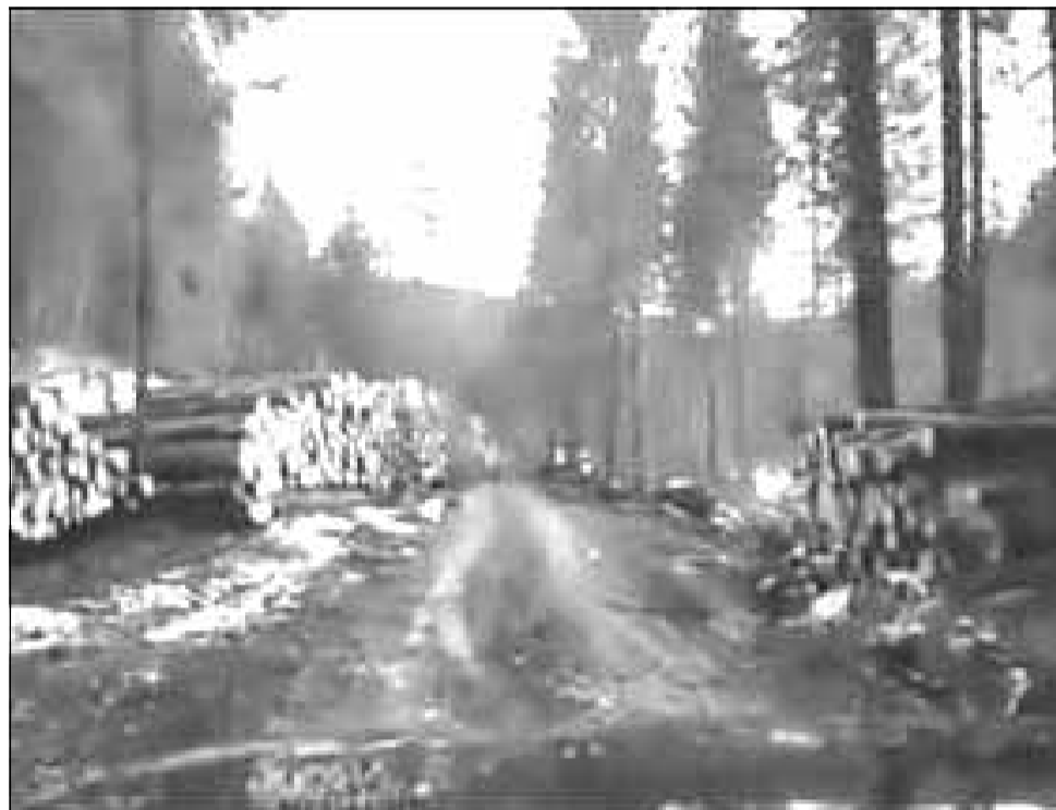
Sute de arbori au fost doborâți la pământ în Munții Apuseni.

„Nu este zi lăsată de la Dumnezeu în care să nu primesc mesaje, fie că e Cluj, că e Maramureș, fie că e Alba, fie că e Harghita sau Covasna, județele de munte cu suprafețe mari de pădure, prin care cetățenii îmi semnalează și mie astfel de cazuri, pe care ei pleacă de la premisa că sunt tăieri ilegale. Eu, urmând ca apoi, ceea ce în mod normal nu este treaba de ministru, trebuie să informez gârziile forestiere. Am vorbit cu colegii de la Garda Forestiera și cei din minister să-mi prezinte pentru luni dimineață, exact care este stadiul acolo și dacă a fost o tăiere legală sau ilegală. Cu siguranță, acolo dacă au fost comise ilegalități, vor fi supuși legii”, spune Costel Alexe, ministrul mediului, citat de digi24.ro.