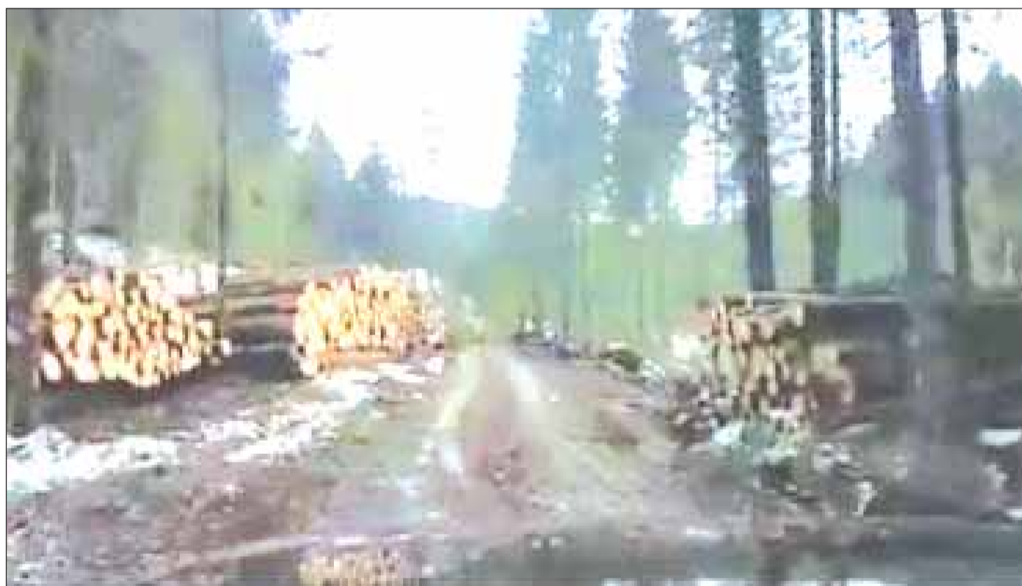
Imagini de coșmar în Valea Drăganului: sute de bușteni tăiați zac pe marginea drumului. Garda Forestieră Cluj tace! Pagina 9