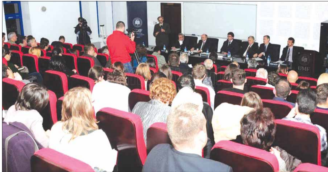
În urmă cu o săptămână, aproape 9.000 de studenți au susținut examenul de rezidențiat, dintre care 1280 de candidați au fost de la UMF

„Sunt și cadru didactic și am inițiat un dialog cu rectorii. Suntem cu toții de acord că este mult loc de mai bine. Propunerea noastră este ca în perioada care va urma, nu pot să vă spun dacă va fi de