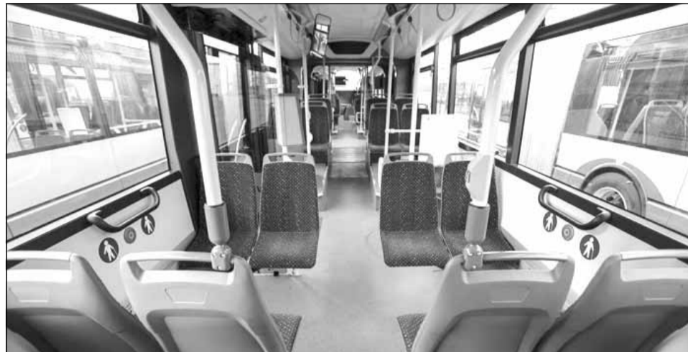
Pentru extinderea transportului în comun, este nevoie de noi autobuze, lucru care necesită timp și bani

Acesta a vorbit și despre faptul că municipiul Cluj-Napoca se află într-un top european, din punct de vedere al plăților electronice făcute de cei care circulă cu autobuzul.