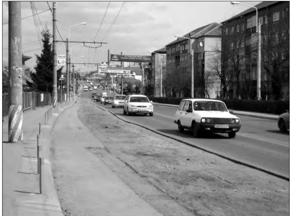
Mediașul va avea în acest an cel mai mare buget de investiții

Un alt capitol pentru care s-au alocat fonduri importante îl reprezintă investițiile în lucrările de infrastructură rutieră și cea de apă canal. Pe lângă fondurile din bugetul local vor fi folosiți și banii pe care municipalitatea îi va împrumuta de la Banca Europeană pentru Reconstrucție și Dezvoltare. „Anul acesta vom continua lucrările de investiții începute, și vom demara altele noi pentru ca infrastructura rutieră și cea de apă canal să atingă standarde moderne. Cu fonduri atât de la bugetul local, cât și de la Banca Europeană pentru Reconstrucție și Dezvoltare, vom