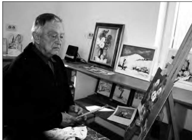
Artistul a donat de curând câteva lucrări muzeului din Mediaș