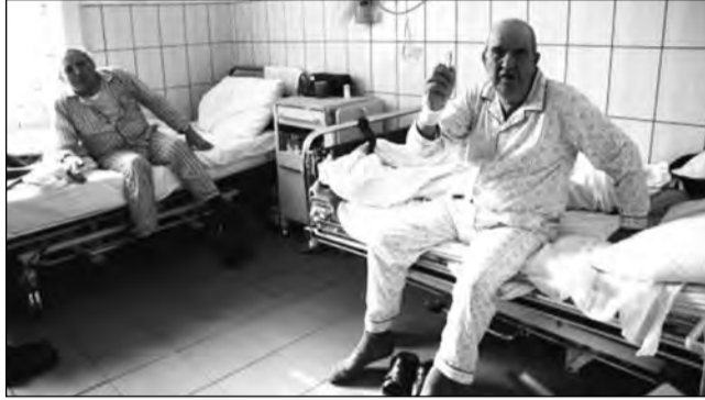
Spitalul din Agnita va rămâne în forma actuală, potrivit propunerii DSP

Din evaluarea DSP, în ce privește soluția Ministerului Sănă-