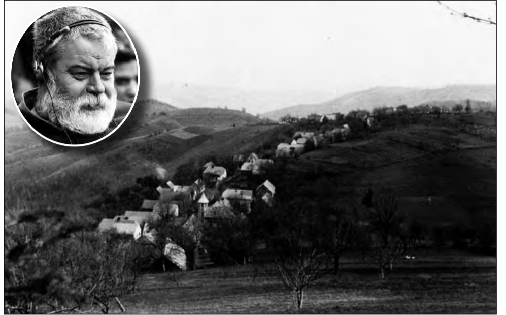
Regizorul Radu Gabrea vrea să filmeze la Mediaș o nouă producție de anvergură

Lindenfeld există în realitate și este un sat părăsit situat în estul Banatului, la sud-vest de municipiul Caransebeș. Localitatea a fost constituită în anul 1827 de coloniștii sosiți din Boemia, pe versantul opus al Masivului Semenic, la poalele vârfului Nemanul Mare (1.122 m), iar căile de acces sunt foarte dificile. Fiind atât de izolați, locuitorii Lindenfeldului au fost scutiți de recrutare în armata austro-ungară în timpul primului război mondial. În anul 1924, numărul lor era de 230. În cel de-al doilea război mondial au fost însă destui mobilizați pe front, iar în 1945 o mare parte dintre ei