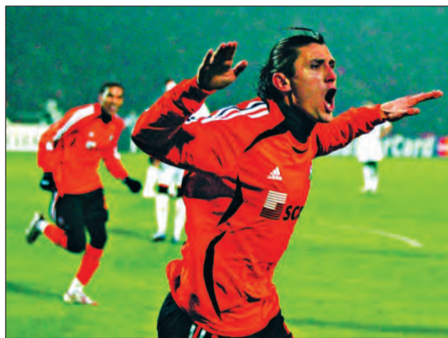
Titularul naționalei este ademenit de mai multe cluburi din liga I