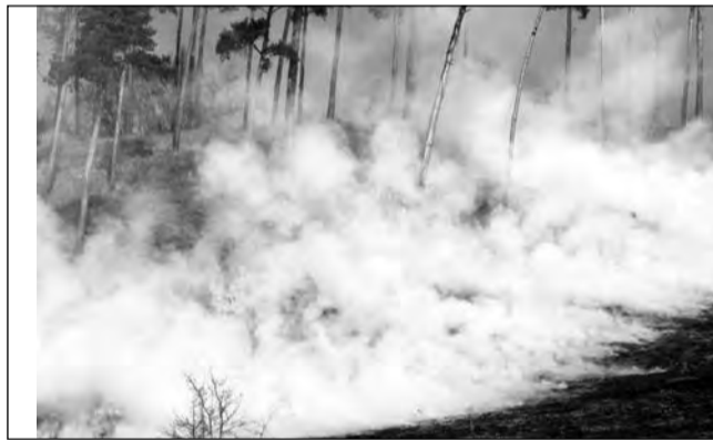
Flăcările necontrolate au dus la un incendiu de proporții în zona Binder Bubi

în alte construcții. Pentru a oferi mediașenilor posibilitatea de a aduce deșeuri la stație, drumul de acces va fi reamenajat. Pe lângă deșeuri din construcții aceștia pot aduce și deșeuri periculoase, saci cu PET-uri sau textile.