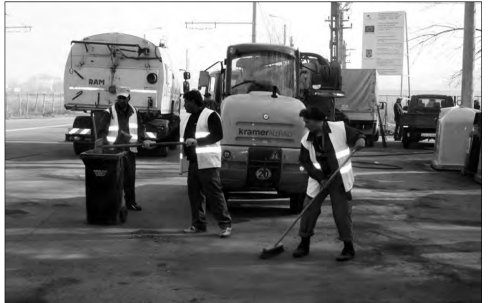
Municipalitatea a dat tonul campaniei de primăvară printr-o serie de lucrări de igienizare

Campania „Curățenia de primăvară” se va desfășura anul acesta în perioada 18 aprilie - 27 mai. Atunci vor avea loc acțiuni mai ample de curățare a domeniului public și a spațiilor verzi, de implicare a elevilor și cetățenilor voluntari în ecologizarea anumitor zone din municipiu. „Așa cum s-a stabi-