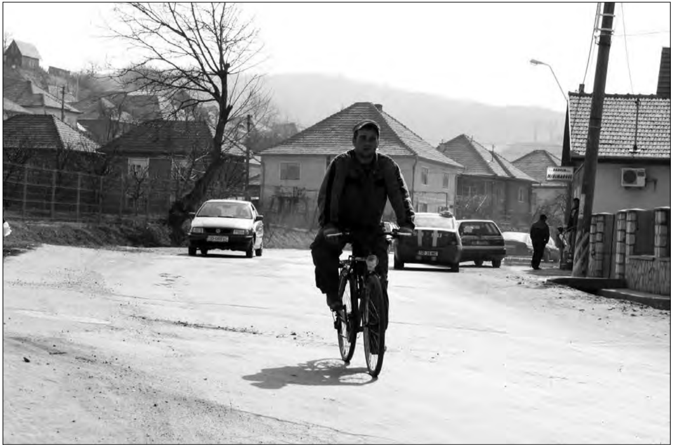
Pasionații ciclismului de agrement vor avea din acest an un tronson construit special pentru ei

În municipiul Sibiu există deja piste pentru bicicliști. Mai mult, luna aceasta se vor amenaja în