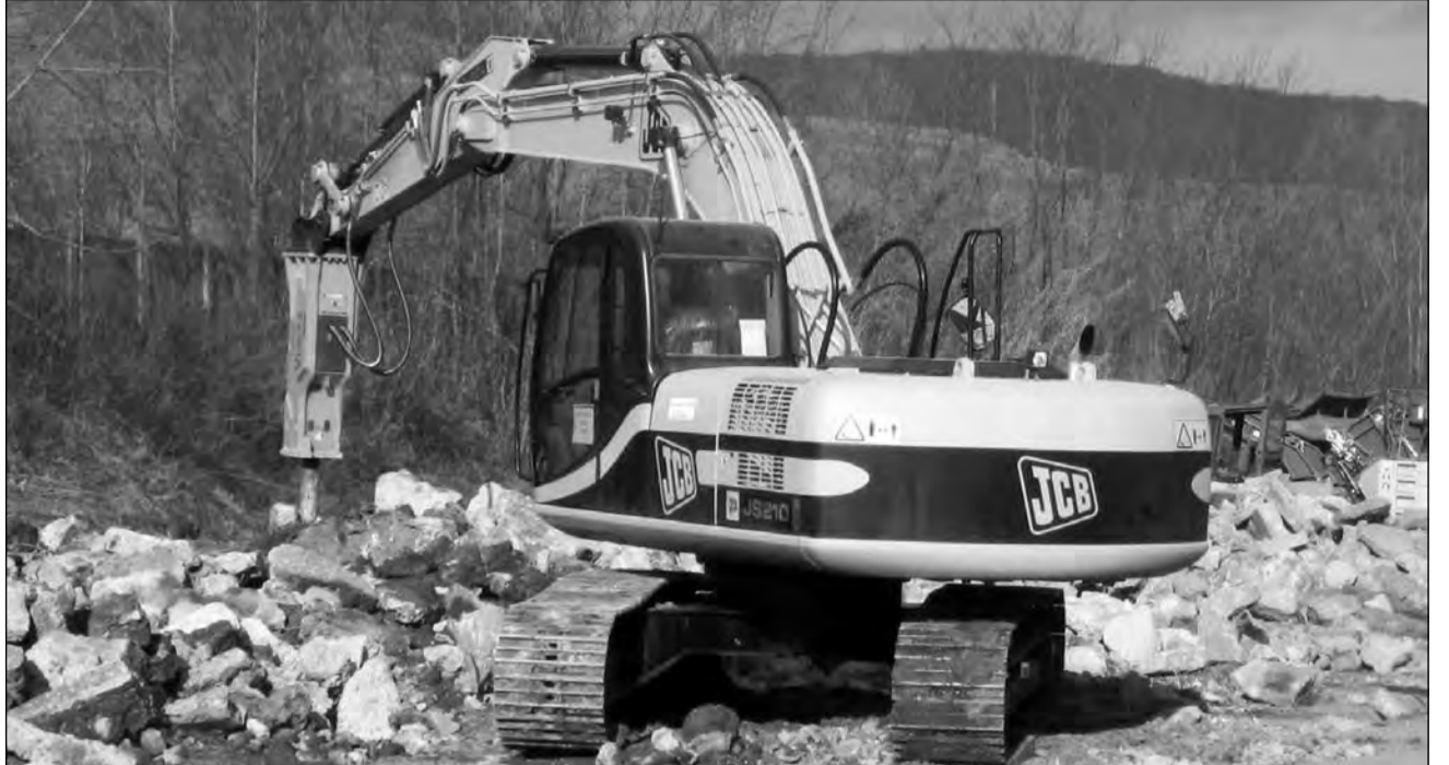
Stația de concasare a deșeurilor este foarte aproape de a fi dată în folosință

Municipiul Mediaș se află în plin proces de realizare al managementului integrat al deșeurilor menajere. Prin construcția celor două stații, practic se completează ceea ce s-a făcut până în momentul de față. „Este o activitate model, un exemplu de bună practică în România. Acest lucru este recunoscut și de forurile superioare până la Ministerul Mediului. Practic, Primăria Stavanger ne va ajuta să realizăm un model de bună practică la nivelul autorităților locale atunci când dau autorizațiile