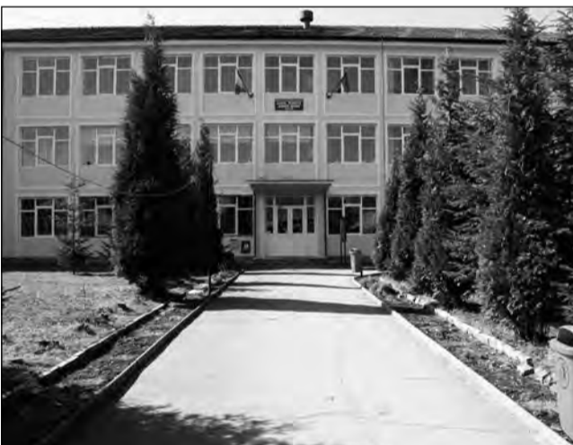
Liceul Axente Sever va avea din această toamnă o clasă cu profil sportiv