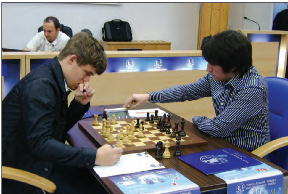
La Mediaș au venit, în acest an, cinci din primii 13 jucători ai lumii