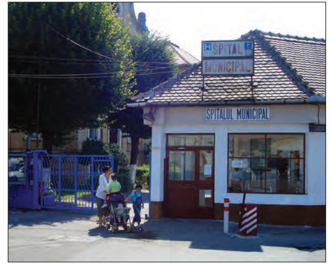
Spitalul Municipal se angajează să intre într-un plan de conformare pentru a primi totuși categoria a III-a