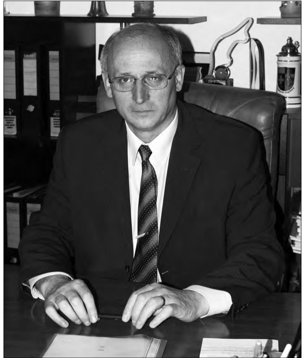
Bottesch e de părere că Mediașul poate atrage în continuare investitori, fiindcă mai are destulă forță de muncă disponibilă

Ca și patriotism local, mai rămâne valabilă acea rivalitate tradițională între nord