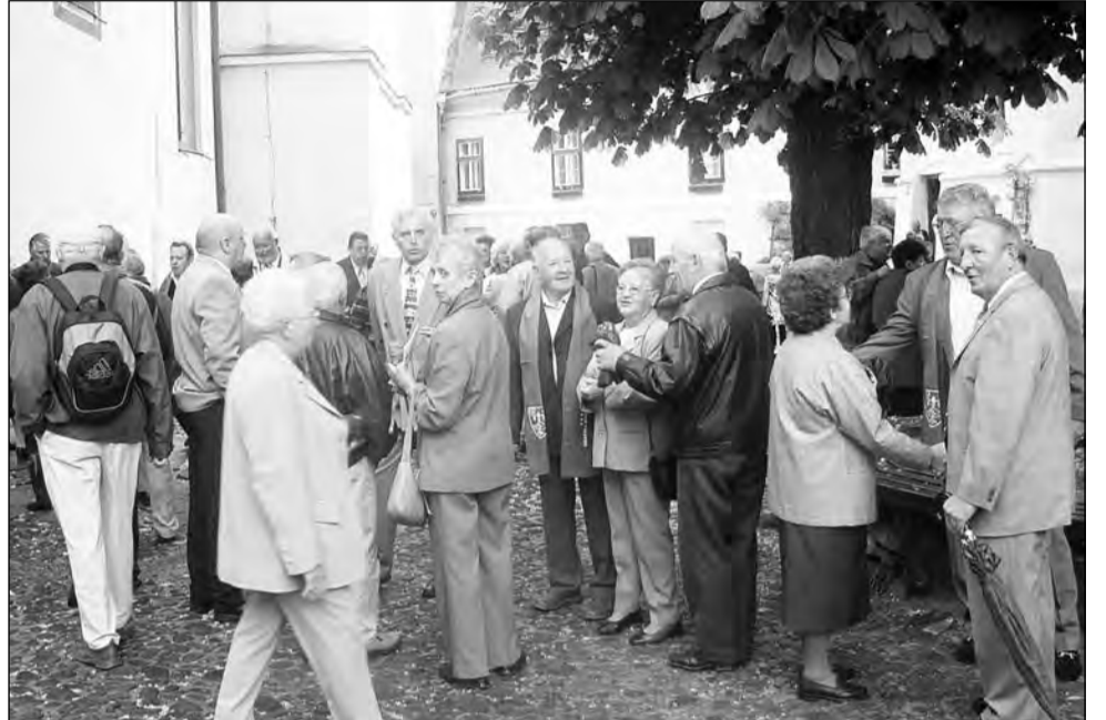
Sute de foști locuitori ai Mediașului revin cu plăcere în orașul lor de suflet

Ziua de duminică va fi una dedicată în bună măsură celor dispăruți. Astfel, de la ora 10, sașii vor participa la Biserica Evanghelică la o slujbă religioasă, iar la ora 12 se va desfășura în Cimitirul Evanghelic o slujbă comemorativă și depuneri de coroane. Ziua se va termina totuși în ton de bună dispoziție în zona de agrement Greweln, acolo unde invitații