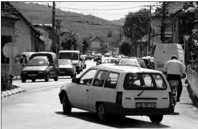
Mașinile din Mediaș emit o cantitate relativ mică de noxe

Deși există voci critice la adresa proiectului, care susțin că datele nu sunt actualizate, hărțile online încearcă să ofere