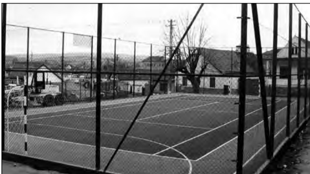
Terenul de sport a devenit principala atracție pentru tinerii din comună

Gândită în primul rând ca o facilitate pentru cei aproape 5.000 de locuitori ai comunei, nu o modalitate de a aduce profit la bugetul local, baza sportivă îi are ca primi beneficiari pe școlari. „În timpul cursurilor, copiii beneficiază de gratuitate, ca să poată efectua ora de sport pe noul teren. După program, pot veni și alți doritori care vor să joace, dar ei vor trebui să plătească”, explică primarul. Până când Consiliul Local va stabili o taxă de