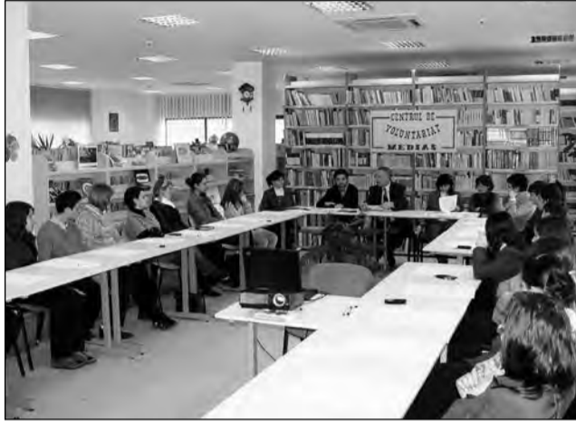
Primele zile după inaugurare au adus deja un număr mare de medieșeni interesați să se înscrie ca voluntari

Deocamdată, puține centre de voluntariat românești oferă aceste servicii. „Cred că așa ar fi normal să fie, însă din centrele care sunt acum în România foarte puține fac acest lucru. Adică sunt atât de axate, atât de specifice, încât doresc să facă lucrul acesta, dar nu toate reușesc să facă mat-