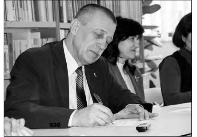
Primarul a promis să își dedice o parte din timpul său liber acțiunilor de voluntariat