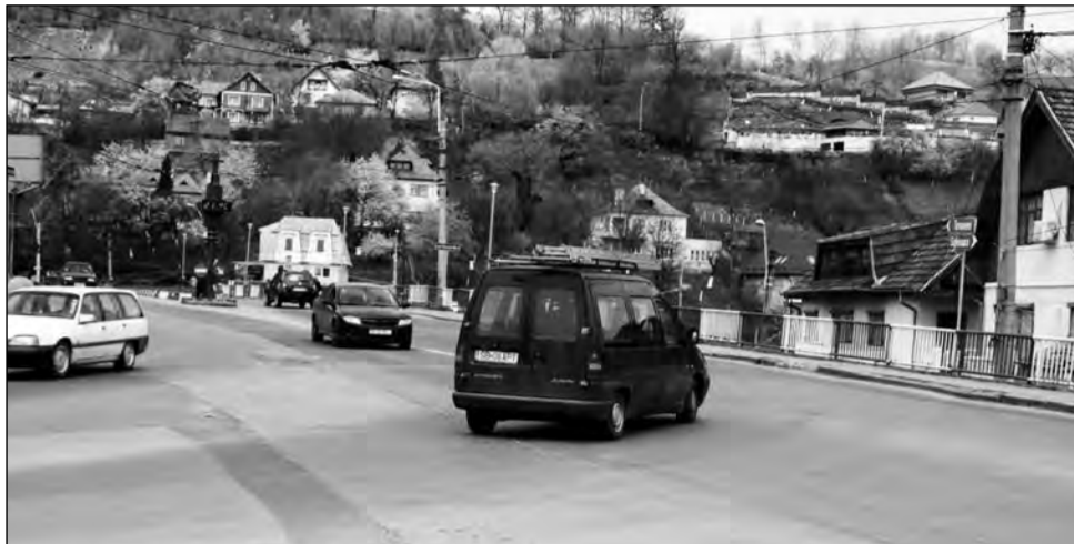
Proiectul va fi supus aprobării Consiliului Local în ședința de săptămâna viitoare

„Prin această lucrare, sperăm să rezolvăm problemele de circulație apărute în zona respectivă. Sigur, dacă nu sunt contestații, în circa două luni, două luni și jumătate am putea începe lucrările”.