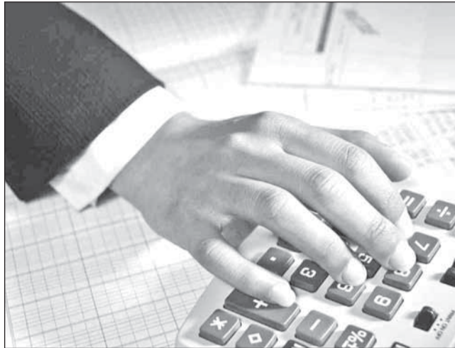
Nivelul taxelor locale a rămas nemodificat din 2009

Proiectul de hotărâre care legitimează valoarea taxelor și impozitelor locale pe anul viitor va fi adus în atenția consilierilor locali în ședința ordinată de la sfârșitul acestei luni. Edilul-șef a mai explicat că, în opinia sa, menținerea nivelului actual al dărilor nu va afecta bunul mers al municipiului. „Propunerea noastră către Consiliul Local este ca nivelul impozitelor să rămână cel din 2011 și pentru anul 2012. Eu am speranța că toți colegii noștri din Consiliul Local vor înțelege ne-