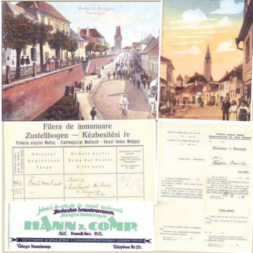
Inițiativa lui Knall lămurește un aspect mai puțin cunoscut din viața Mediașului de altădată