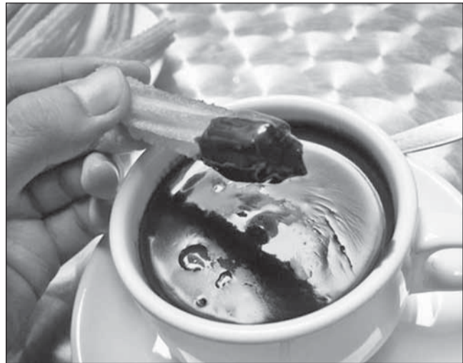
„Chocolate con churros” - specialitate spaniolă

Mod de preparare: Se pun piersici în sirop într-un pahar, se acoperă cu un strat de brânză sau iaurt și apoi cu un strat de cereale, amestecate cu nuci și stafide.