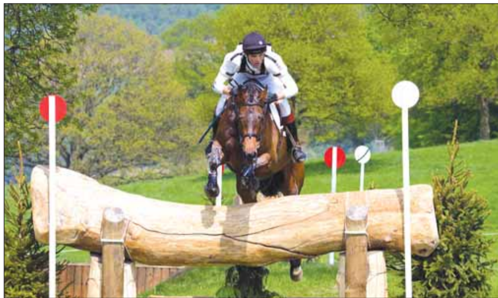
La competiția din Prod, comuna Hoghilag, și-au confirmat prezența nu mai puțin de 60 de concurenți