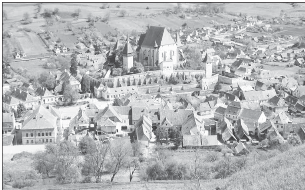
Răgazul dat de executorii judecătorești comunei Biertan se poate încheia în orice moment