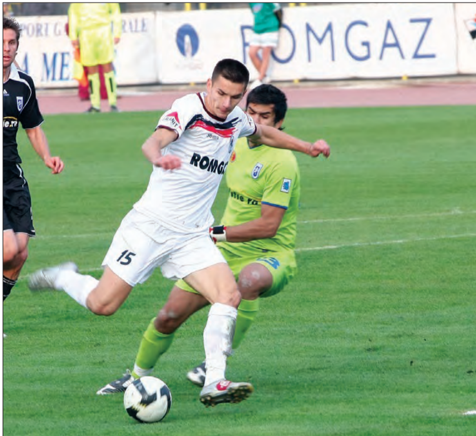
Medieșenii vor victoria, ceea ce le-ar aduce primele puncte din 2011

voită să joace pe teren neutru meciurile considerate „acasă” până la finalizarea „Cluj Arena” din Cluj-Napoca. Noul stadion va fi terminat la începutul lunii septembrie, conform anunțului făcut de Consiliul Județean Cluj, proprietarul obiectivului. „Ne mutăm din