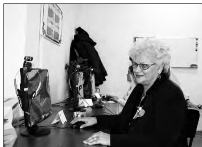
Biblionet-ul a fost inaugurat de curând și la Mediaș

de adulți apti de muncă din familiile beneficiare de prestații sociale, 2,2 milioane persoane nu muncesc și nici nu fac parte din sistemul educațional sau de pregătire profesională.