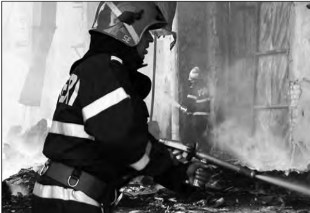
Tinerii elevi din Copșa vor învăța toate tainele meseriei de pompier

Organizatorii au pornit acest demers din considerentul că meseria de pompier și mai ales cea de pompier voluntar nu este apreciată în comunitate așa cum ar trebui iar cauza principală o reprezintă lipsa de educație socială a cetățenilor. Cum educația adulților este în general mai dificilă, mai scumpă și cu mai puține șanse de reușită, autoritățile locale din Copșa Mică împreună cu reprezentanții ISU "Cpt. Dumitru Croitoru" Sibiu încearcă, prin acest proiect adresat copiilor aflați în pragul adolescenței, să trezească în aceștia respectul pentru meseria de "pompiet" și urmăresc în principal dezvoltarea la elevi a ca-