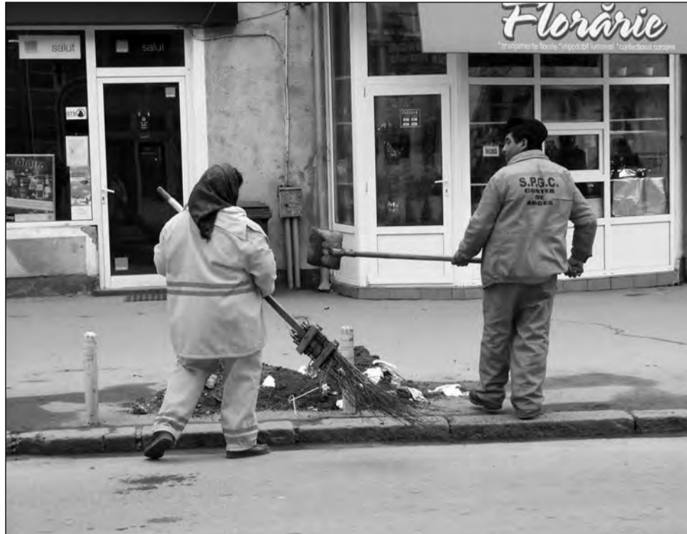
În urma propunerilor Executivului, numărul asistaților sociali ar urma să scadă semnificativ în perioada următoare

Se estimează ca, astfel, cheltuielile bugetare pentru venitul minim garantat vor fi reduse la 651 milioane lei, în 2011, la 632 milioane lei, în 2012, iar numărul mediu lunar de familii asistate va scădea de la