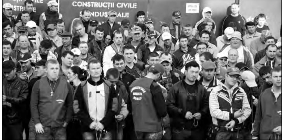
Câteva sute de sindicaliști sunt așteptați astăzi la Mediaș pentru a protesta în special împotriva noului Cod al Muncii