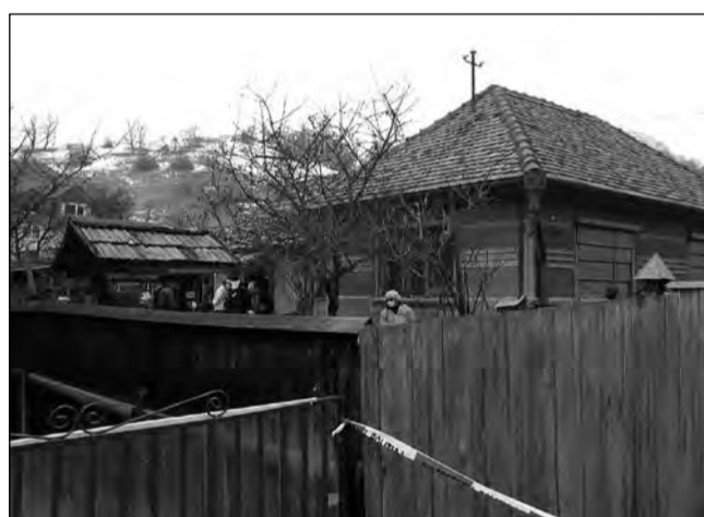
Mediaș a fost zguduit de crima de pe strada Hula Veche

de semnături pentru declanșarea grevei de avertisment și a grevei generale. În județul Sibiu, Cartel Alfa are aproximativ 17.000 de membri, atât din sectorul public, cât și din cel privat, BNS are aproximativ 12.000 de membri din mai multe societăți de stat și private, printre care Poșta Română, Electrica și Transgaz, iar CNSLR Frăția are aproximativ 10.000 de membri, cei mai mulți fiind din domeniul sanitar.