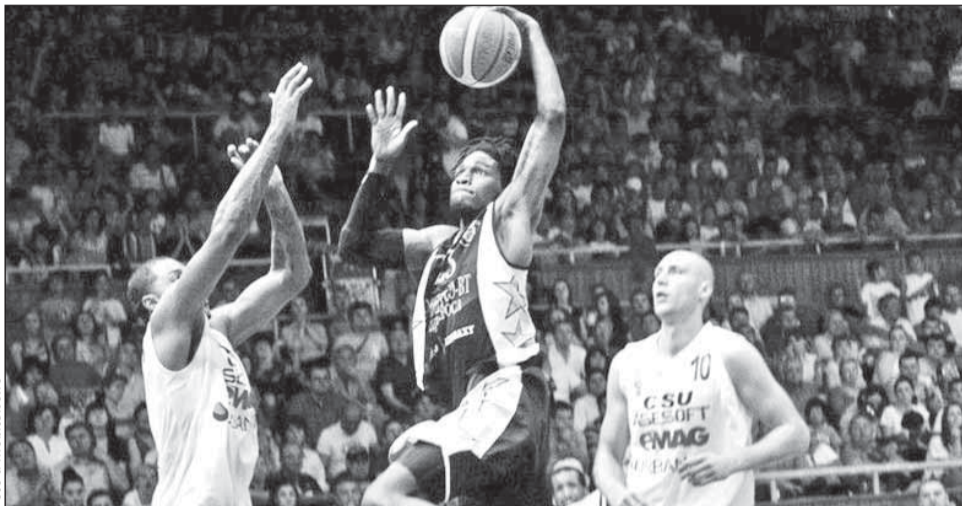
Dykes în acțiune.

Conducerea clubului „U” Mobitelco BT face apel la suporteri, care sunt invitați să vină marți la Sala Sporturilor „Horia Demian”, pentru a susține echipa în meciul care poa-