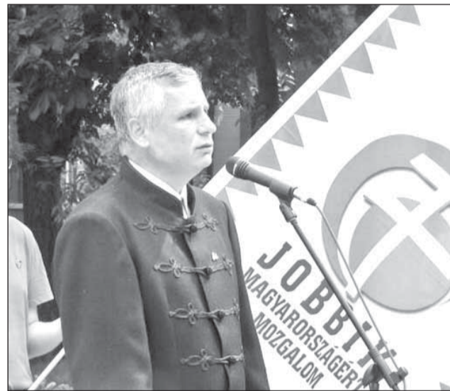
Vicepreședintele Parlamentului Ungariei, Zoltan Balczó, a subliniat că data de 4 iunie (semnarea Tratatului de la Trianon, în 1920 – n.r.) a fost declarată zi de doliu național de către Guvernul FIDES, fiind, în același timp, desemnată și ziua reunirii maghiarilor de pretutindeni.

Liberalii și social democrații de la Cluj consideră că statul român trebuie să își apere interesele de fiecare dată, pentru că „nu suntem o stână fără câini”.