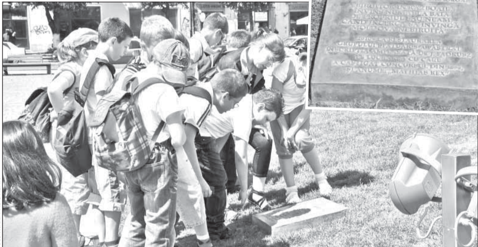
Plăcuța amplasată pe iarbă, în fața statuii lui Matei Corvin, conține și un citat din Nicolae Iorga, despre regele român al Ungariei, dar și informații istorice relevante despre grupul statuar

Deși consilierii județeni ai PSD s-au arătat de-a dreptul indignați de gestul colegilor