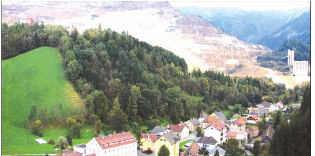
Ghidul turistic „Călătorie în Țara Aurului – o destinație de legendă în Apuseni” își propune să atragă cât mai mulți vizitatori în una dintre cele mai vechi așezări miniere din România

În condițiile în care, de peste două mii de ani, destinul Roșiei Montane este strâns legat de extragerea metalelor prețioase, reducerea și chiar stoparea acestei activități în ultimii ani au condamnat zona la o frânare a dezvoltării sale. Totodată, absența infrastructurii necesare pentru practicarea turismului, precum și amânarea demarării unor pro-