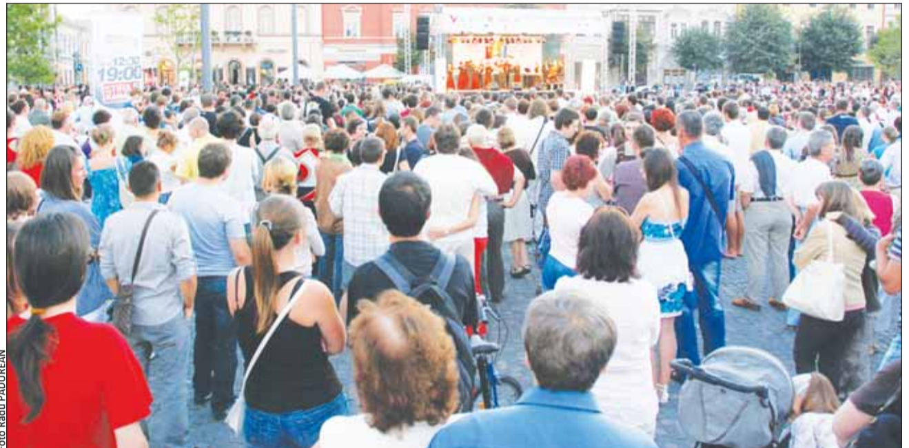
Vineri seară în Piața Unirii va avea loc un concert vocal-sinfonic susținut de Orchestra Simfonică și Corul Filarmonicii de Stat „Transilvania”