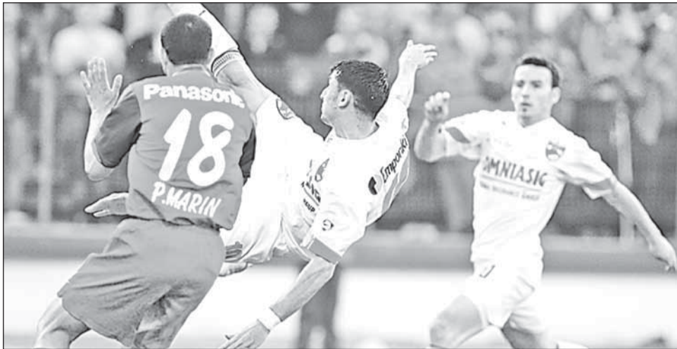
Dinamo și Steaua se bat pentru Cupa României.

Dinamoviștii au un ascendent moral în fața „eternilor rivali”, deoarece i-au învins în ambele partide din campionat, în sezonul recent încheiat (2-1 în Ștefan cel Mare și 1-0 în Ghencea). Steliștii în schimb au început să fie mult mai eficienți și mai pragmatici de când Cosmin Olăroiu a revenit la echipă. Dinamo a câștigat ultima Cupă în 2005, în timp ce Steaua doar în 1999. Jucătorii ambelor echipe își doresc o victorie în fața marilor rivali. „Nu știu dacă va fi un meci pe viață și pe moarte, dar ne dorim să câștigăm. Toți își doresc să rămână Olăroiu la echipă, eu cred că dacă vom câștiga Cupa îl vom convinge. Toată lumea se gândește numai la tro-