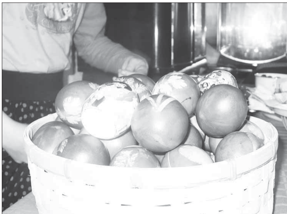
O treime din români spun că banii de care dispun pentru Paștele din acest an nu vor fi suficienți și vor fi nevoiți să renunțe la multe produse

Președintele IRES, sociologul Vasile Dăncu, a explicat că, deși practicile și compor-