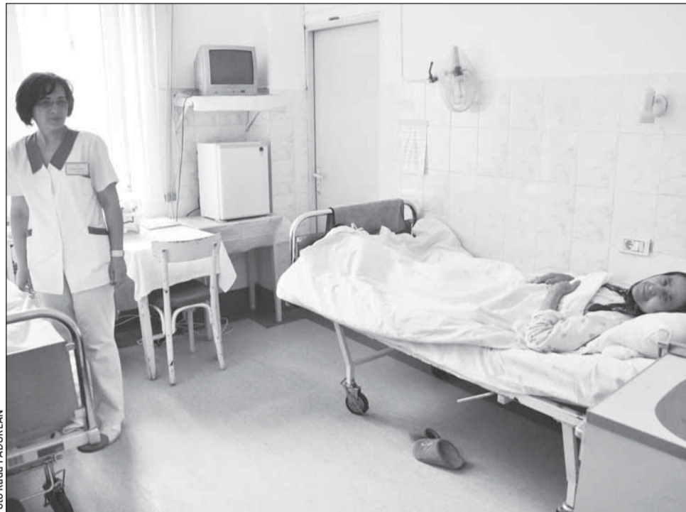
Peste o lună sau două s-ar putea cunoaște mai exact gradul de competență a fiecărui spital, în funcție de categoria la care a fost încadrat

După ce spitalele au trimis solicitările, DSP-urile au la dispoziție cinci zile pentru a analiza cererile și a încadra spitalele într-una dintre cele cinci categorii existente, în funcție de nivelul de competență. Apoi, ele vor trimite Ministerului Sănătății, pentru aprobare, noua clasificare.