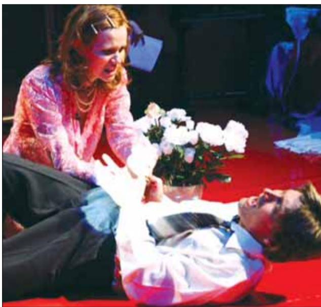
Spectacolul „Strigăte și șoapte” a obținut trei premii UNITER

Aceasta este a șaptea oară când un spectacol al Teatrului Maghiar de Stat Cluj este distins cu premiul UNITER pentru cel mai bun spectacol al anului. Spectacolul „Trei surori”, de A.P. Cehov,