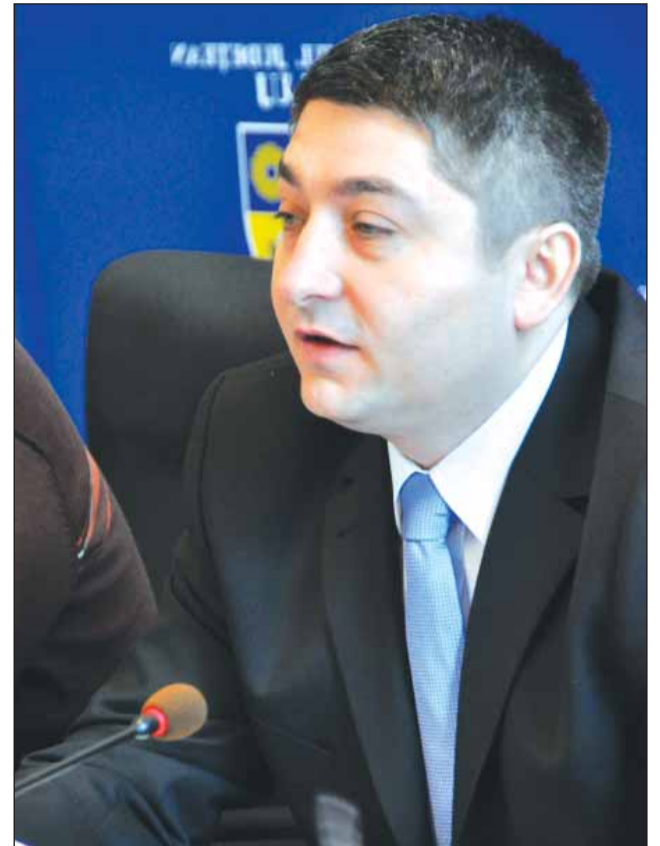
celor patru foști președinți ai Consiliului Județean urma- ză să aibă loc în cadrul unor ceremonii publice.

Înmânarea diplomei de „Clujean de Onoare” și a plachetei realizate în acest sens