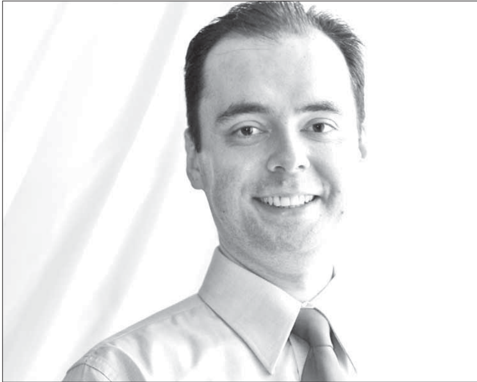
„În momentul de față vedem inflația la 5,2% la finele anului. Vedem o inflație relativ ridicată, puțin peste 8% până la finele lunii iunie, după care vedem o anumită reducere”, a declarat ieri Lucian Anghel, economistul șef al BCR

Industria auto, calculatoare și produse electronice și optice, echipamentele electrice, mașinile, utilajele și echipamentele, precum și industria metalurgică au fost prin-