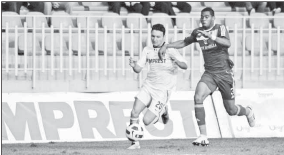
Clujenii și au luat revanșa în fața craiovenilor

Verba că ocaziile se răzbuună s-a confirmat în acest