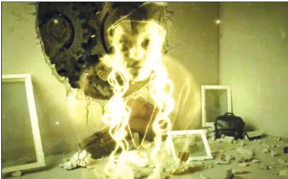
Filmul „Pânza” (R. Codin, S. Pop, 18’) a fost una din cele două producții care au câștigat anul trecut Competiția Locală TIFF

Toți cei interesați pot trimite până pe data de 15 mai filme pe orice temă, cu lungimea maximă de 30 de minute, într-unul din formatele: MPEG2, AVI sau MOV. Producțiile trebuie să fie realizate în perioada 7 iunie 2010 - 15 mai 2011 și să fie subtitrate sau dublate în limba română. Filmele, împreună cu formularul de înscriere completat, trebuie trimise la sediul festiva-