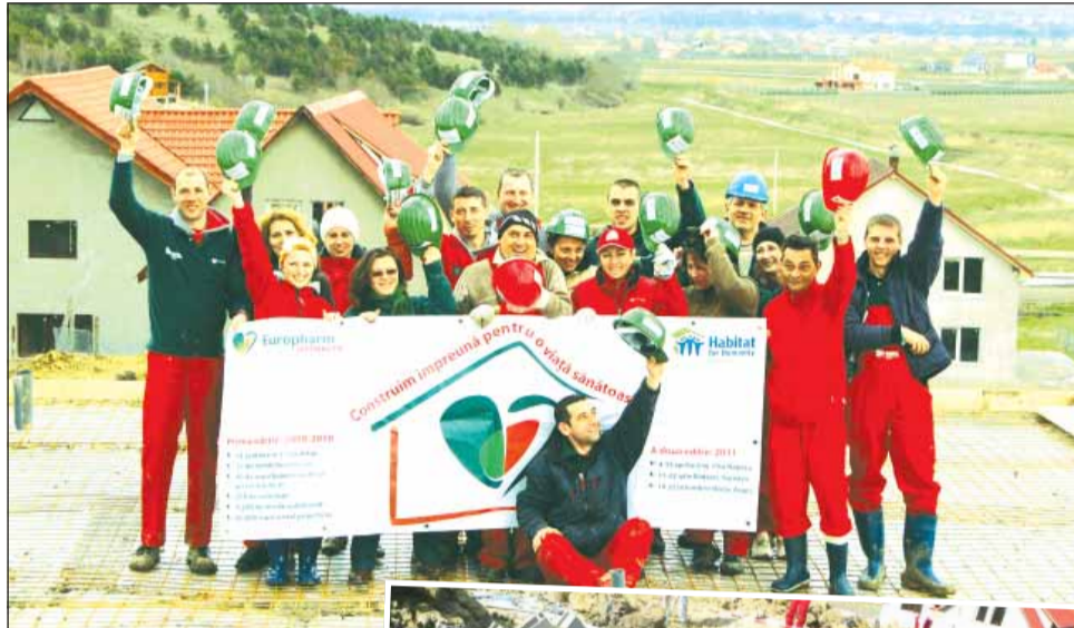
Zeci de angajați ai Europharm Distribuție au muncit timp de două săptămâni pe șantierul Habitat din Câmpenești

Potrivit reprezentanților asociației Habitat pentru Umani-