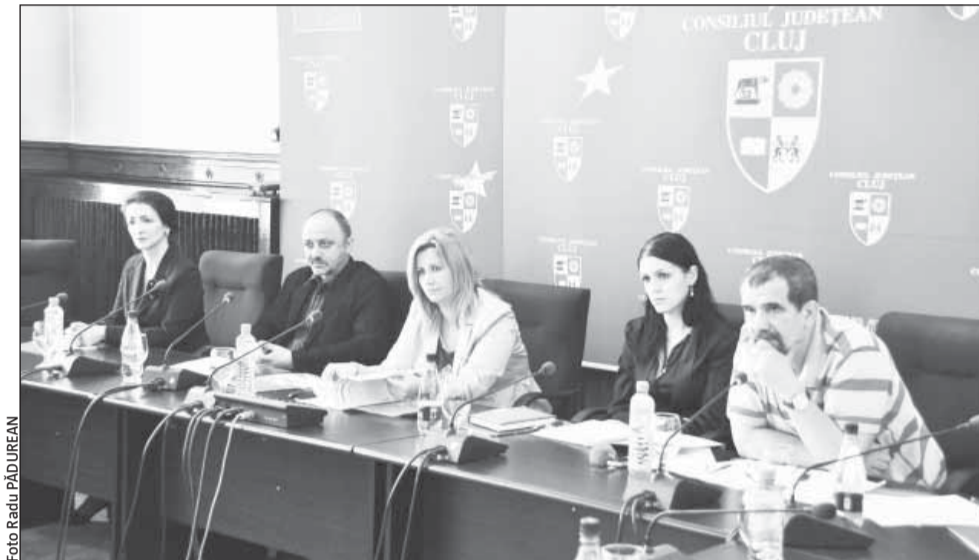
Consiliul Județean are în așteptare și alte proiecte care au în vedere investiții și modernizări în Cheile Turzii

Printre obiectivele care vor fi promovate prin intermediul