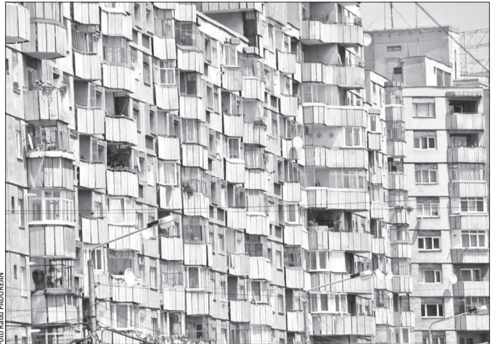
Prețul apartamentelor vechi din Cluj s-a ieftinit cu 1,6% în primul trimestru al anului 2011

Preponderent negativă a fost și evoluția prețului cerut