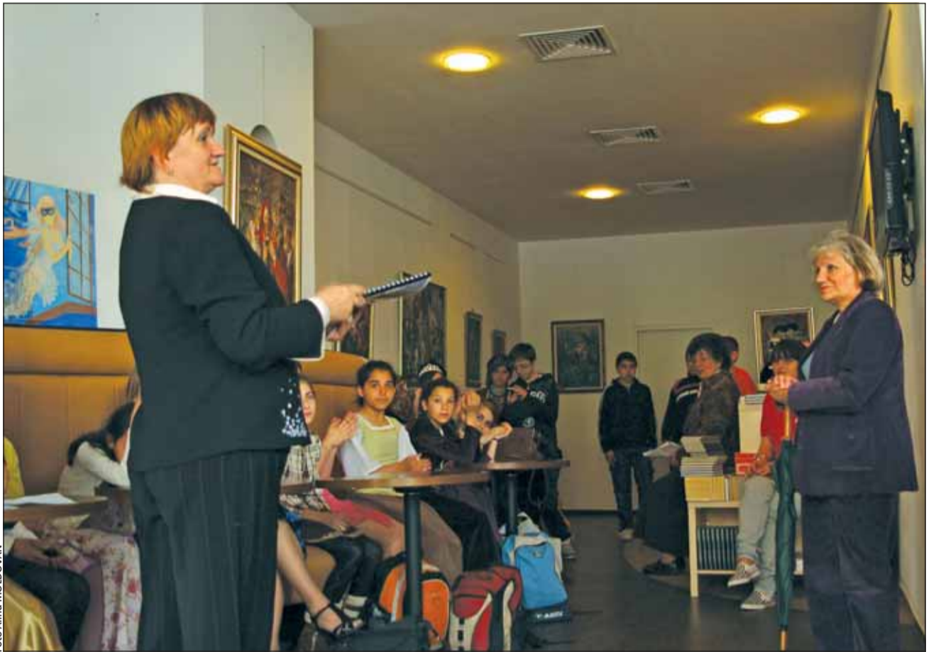
Elevii din clasele V și VI ale Liceului de Arte Plastice „Romulus Ladea” și-au prezentat ieri lucrările în cadrul unei expoziții la Bibliotecă Universității

Suita manifestărilor include joi o sesiune de comunicări cu tema „Semne și simboluri”, pentru care atât profesorii, cât și elevii au pregătit lucrări interesante. Vineri, la liceul de artă clujean va fi „Ziua porților deschise”, vizitatorii având prilejul să vadă toate atelierele de lucru ale școlii și să admire munca tinerilor creatori.