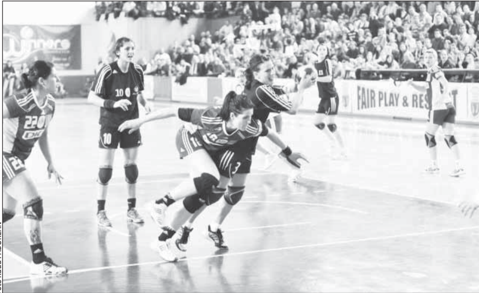
Vicecampioanele luptă pentru Cupa României.

În cazul în care se vor calificat în semifinale, clujenele vor juca împotriva câștigătoarei dintre CSM București și Dunărea Brăila, vineri 20 mai de la ora 18, cealaltă semifinală umrând să aibă loc în aceeași zi de la ora 20. Finala va avea loc sâmbătă, de la ora 13.15, bineînțeles între câștigătoarele celor două semifinale. Dacă va ajunge în ultimul act al competiției, „U” Jolidon ar putea da piept cu campioana Oltchim și va avea oca-