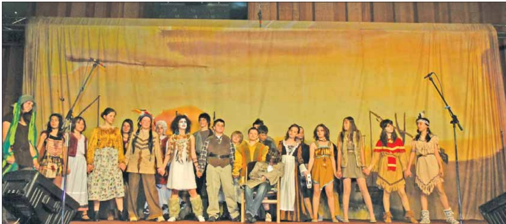
Piesa de teatru „Pocahontas-the Princess of Peace”, jucată de elevii Școlii Elf a primit 8 distincții în cadrul festivalului de teatru în limba engleză „Come with us to Dramaland”