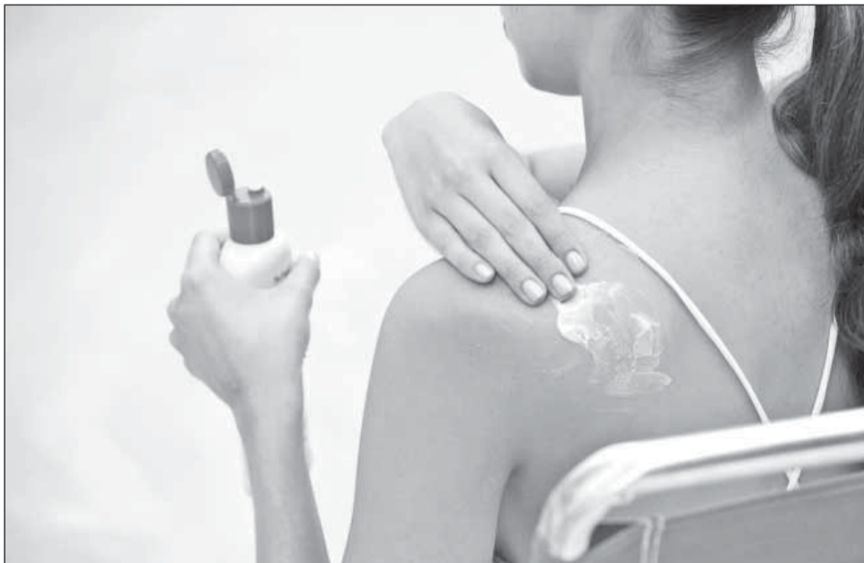
Folosirea cremelor pentru protecție solară previne apariția cancerului de piele

Astfel, specialiștii doresc să atragă atenția asupra acestei afecțiuni, la nivel european fiind marcată astăzi Ziua Europeană pentru depistarea cancerului de piele sau Euro Melanoma Day. „Societatea Română de Dermatologie (SRD) participă și anul acesta împreună cu medicii dermatologi din Europa la realizarea celei de a 6-a ediții naționale a Eu-