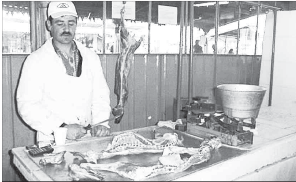
Anul acesta, Paștele va fi mai costisitor deoarece nu numai carnea de miel s-a scumpit, ci și alte produse precum vinul sau cozonacii

Deși cererea pentru carnea de miel a scăzut față de anii precedenți, în mare parte și din cauza puterii reduse de cumpărare a românilor, oferta crescătorilor autohtoni pentru Sărbătorile Pascale va fi de circa 3 milioane de miei și iezi în acest an, iar prețul cu circa 20% mai mare decât anul trecut. „Nu există o criză de ofertă, chiar dacă cererea depinde foarte mult de situația economică și de puterea de cumpărare a românilor. Nu îl pot obliga pe producătorul agricol să se sacrifice, pentru că nu merge bine economia în anumite sectoare. Nu cred că producătorul este vinovat de ceea ce înseamnă costul vieții în România, deoarece și el suportă niște costuri mari de producție”, a declarat pentru Ager-