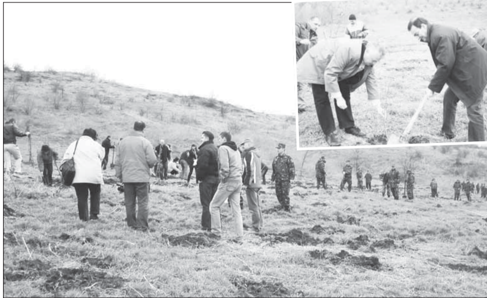
Anul acesta, politicienii nu s-au mai înghesuit să planteze puietii