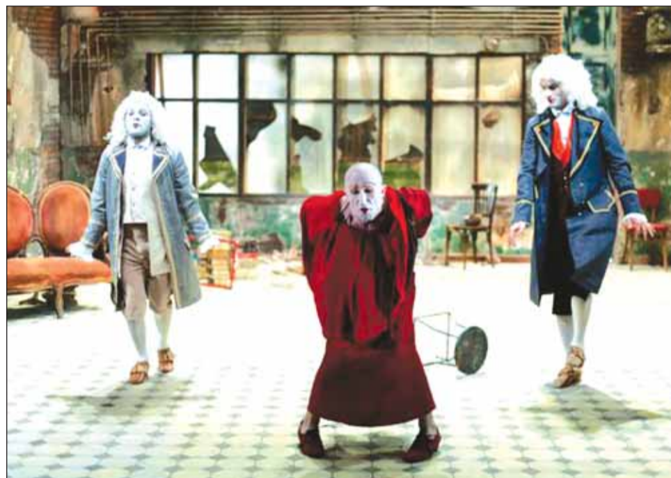
Scenă din spectacolul „Leonce și Lena”, intrat alături de piesa „Strigăte și șoapte” în cursa premiilor UNITER