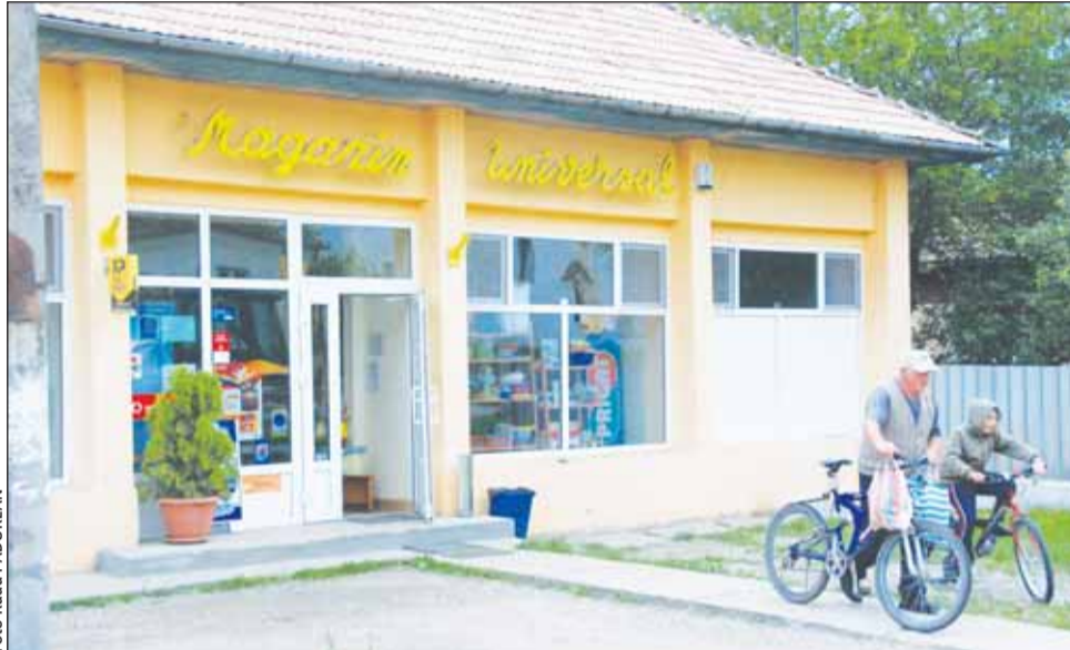
Noua rețea de magazine „Haiducul” ar putea înlătura în parte samsarii din agricultură, oferind sătenilor posibilitatea să își exploateze producția

Potrivit acestora, tinta RVD constă în dezvoltarea satelor și