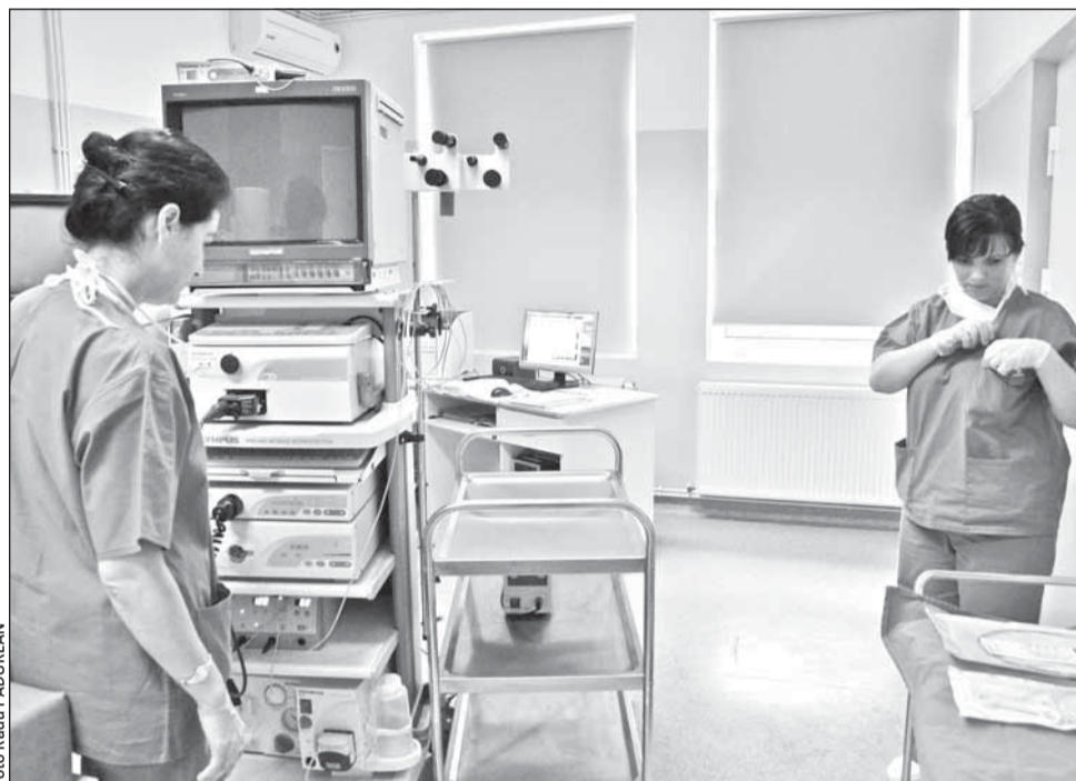
Printre planurile de viitor ale medicilor de la Institutul Regional de Gastroenterologie și Hepatologie se află și realizarea de transplanturi hepatice

Potrivit conducerii institutului, în viitor se va construi și un bloc operator nou, după cerințele UE, și o secție de Terapie Intensivă. De asemenea, în prezent se conturează și o secție de medicină internă cu mai multe departamente: alergologie, cardiologie, oncologie și medicină internă.