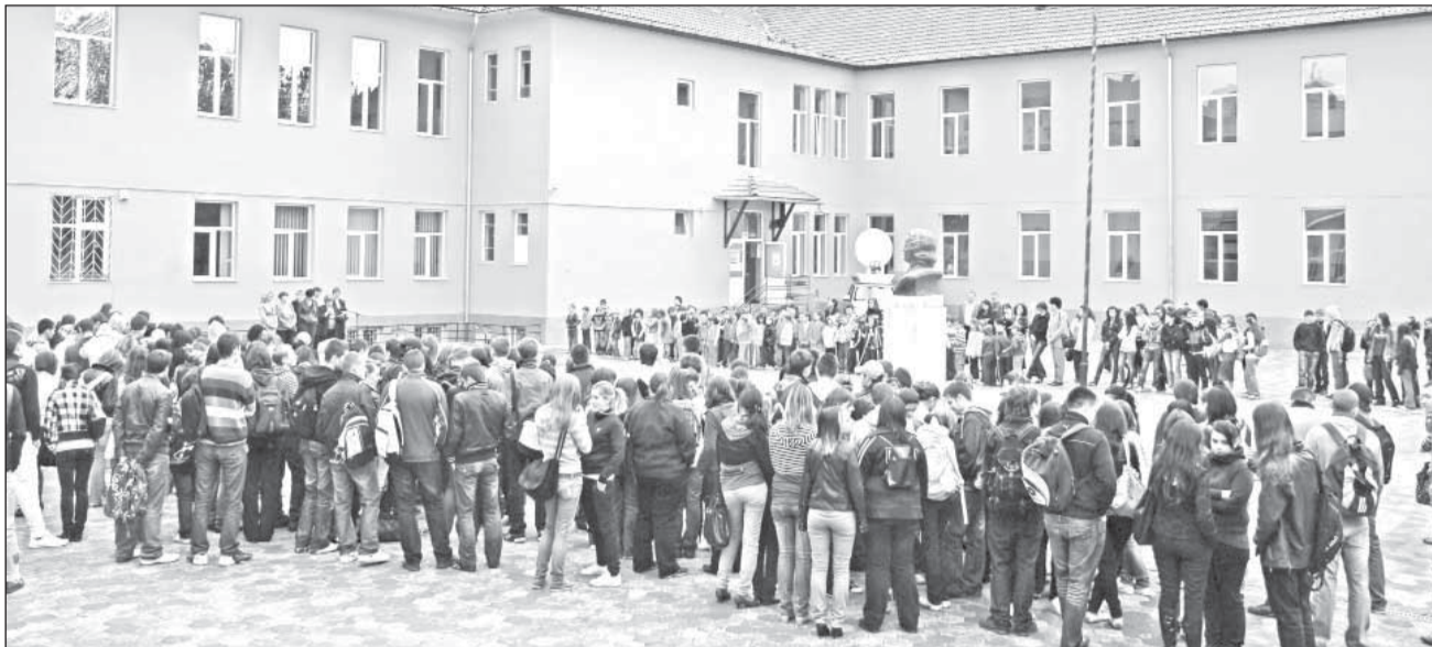
Elevii din clasa a IX-a sunt în special vizați de vânzătorii de plante etnobotanice