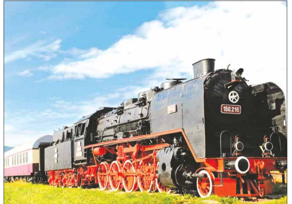
Trenul-hotel din Vișeu de Sus este unic în România

În aceeași gară în care se află primul tren-hotel din România se află și bine-cunoscuta Mocănița care transportă turiștii pe Valea Vaserului, ceea ce face ca cele două idei să fie mai mult decât complementare. „Ideea hotelului tren a pornit tocmai de la faptul că noi organizăm excursii cu trenul pe Valea Vaserului de câțiva ani și am văzut că există un anumit segment de clienți pasionați și care îndrăgesc foarte mult căile ferate. Atunci ne-am gândit că am avea un target foarte bine stabilit, iar ulterior am sperat ca și turiștii care vin aici doar pentru distracție să fie curioși să descopere această modalitate inedită de a se caza. În același timp, prin