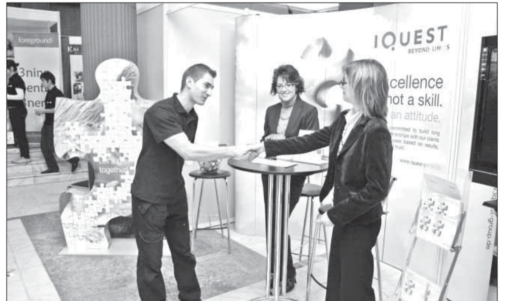
La ediția din mai a târgului de cariere de la Cluj participă în jur de 120 de companii

La Târgul de Cariere participă și companii de recrutare precum Adecco, eJobs, GI Group, Luger & Makler, Manpower și Professional.