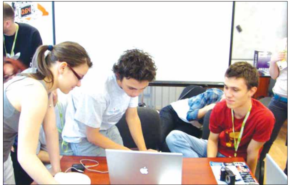
Tinerii care doresc să se înscrie la Atelierul de film „Let's Go Digital” o pot face până vineri, 20 mai