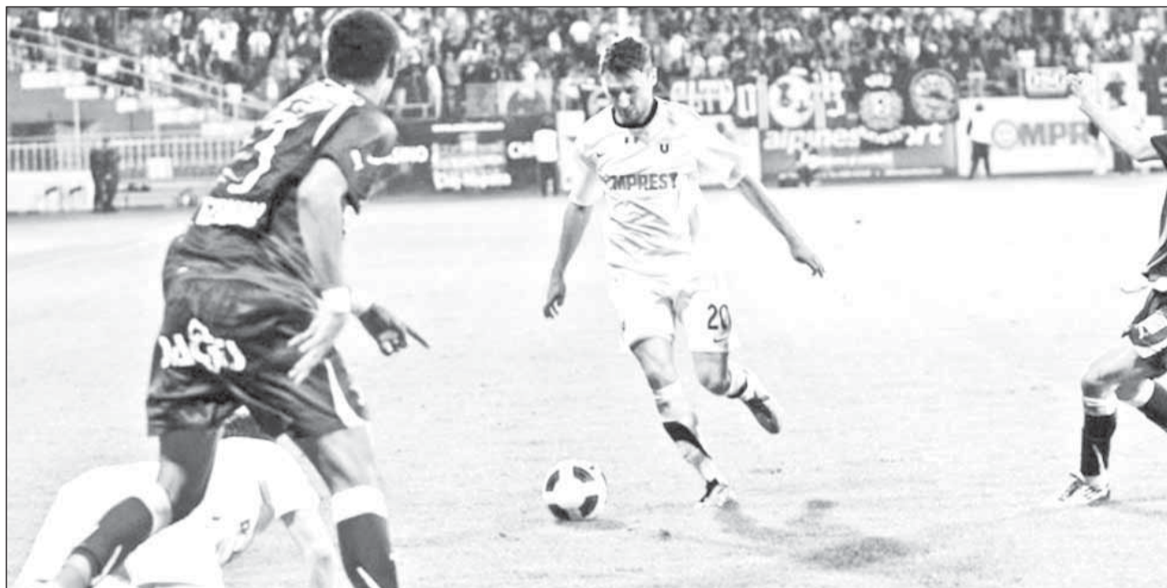
„U” Cluj a fost învinsă de Rapid