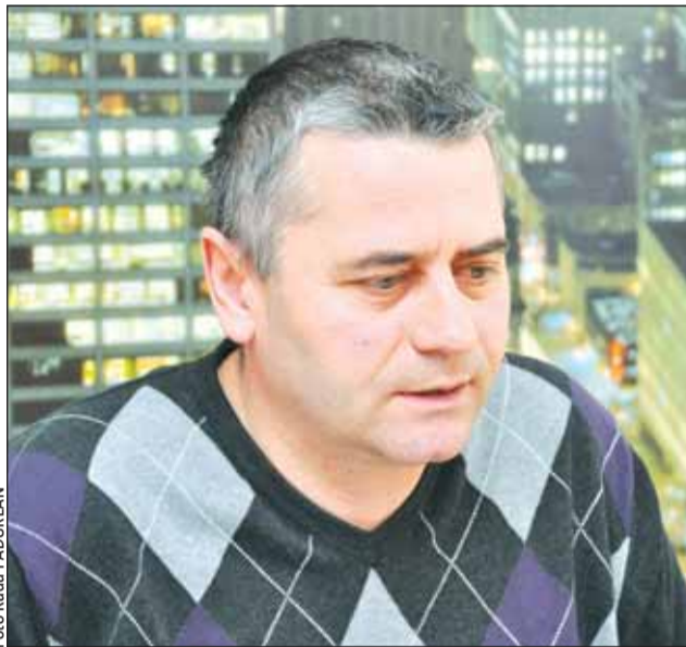
Mircea Giurgiu vrea demisia ministrului Sănătății, Cseke Attila

Deputatul clujean consideră că ministrul Sănătății, Cseke Attila ar trebui să își dea demisia din cauza problemelor actuale din sistemul sanitar și a dat ca exemplu închiderea spitalelor, plus cel mai recent caz prezentat chiar de ministrul Sănătății. Este vorba despre o pacientă cu sechele din cauza unui accident vascular, tratată la Centrul de Sănătate Băneasa din Constanța. Femeia nu a fost îngrijită corespunzător, nu i-au fost tratate es-