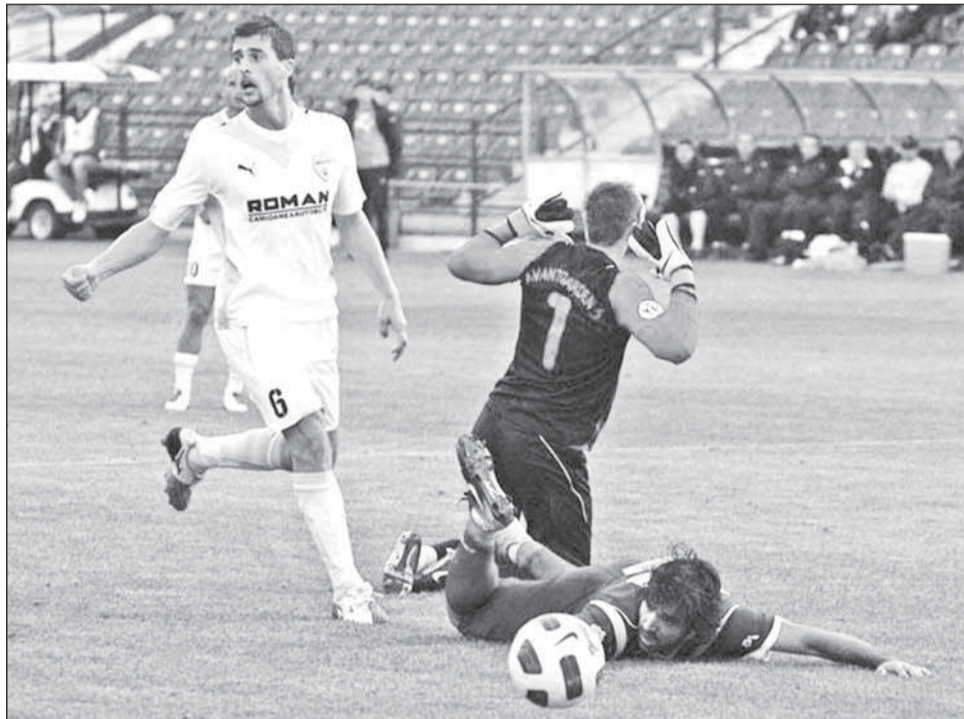
CFR s-a impus în meciul tur cu 4-0

În tur, CFR s-a impus clar, cu 4-0, însă de această dată campionilor le va fi mult mai greu, întrucât braşovenii au progresat mult, devenind o