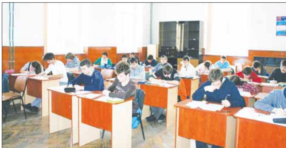
Ieri, la Liceul Teoretic „Avram Iancu” au avut loc mai multe concursuri cu premii

Ieri, în deschiderea evenimentului, la Liceul Teoretic „Avram Iancu” a avut loc o festivitate de premiere a ele-