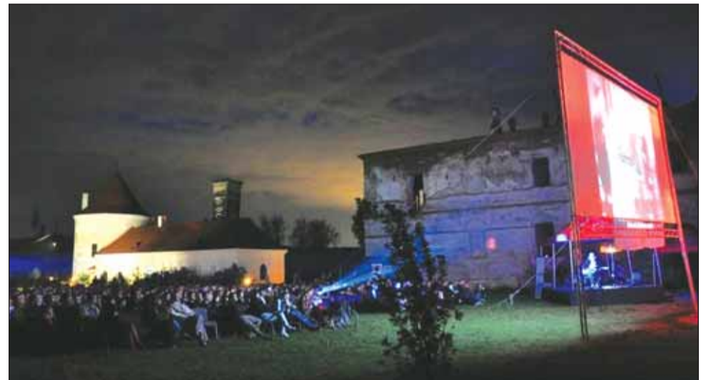
Proiecția filmului „ Odessa în flăcări ” va avea loc pe 7 iunie, la Castelul Bánffy

Produs la inițiativa lui Ion Cantacuzino, una dintre cele mai importante figuri ale istoriei filmului românesc din prima jumătate a secolului XX, superproducția „ Odessa în Flăcări ” a fost turnată după scenariul lui Nicolae Kiritescu. Filmul urmează tradiția primului lungmetraj autohton, „ Independența României ” (r. Grigore Brezeanu, 1912), care omagiază victoria trupelor române în Războiul de Independență din 1877. Celebra soprana Maria Cebotari, unul dintre marile sturari autohtone ale perioadei interbelice, joacă rolul unei cântărețe de operă din Basarabia, aflate cu fiul ei în Chișinău în momentul invaziei sovietice. Băiatul es-