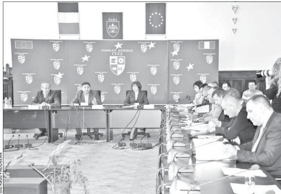
După mai multe certuri încă de la primele ore ale dimineții, Consiliul Județean a decis oficial că vrea spitalul din Mociu

Consilierii opoziției au considerat însă că demersurile președintelui CJ nu au fost suficiente, insistând pentru adoptarea unei hotărâri din care să