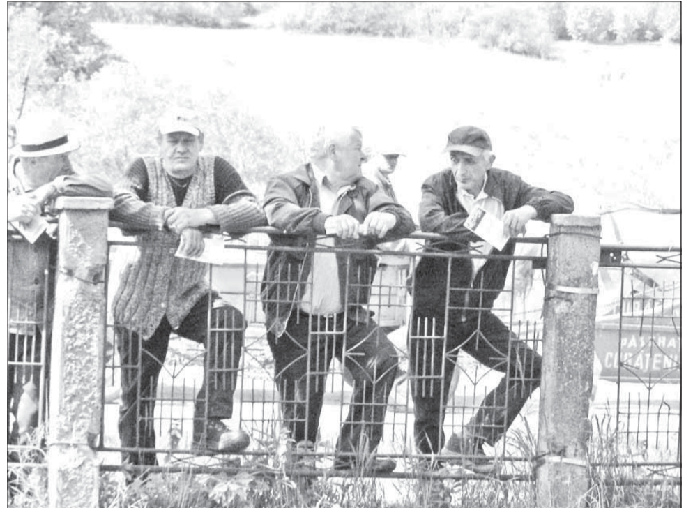
În contextul în care 46% din populația țării trăiește în mediul rural, transformarea a 67 de spitale în cămine de bătrâni încălcă dreptul acestora la sănătate, spun medicii

În opinia conducerii asociației pacienților și Colegiului Medicilor, desființarea unui spital nu se poate realiza decât dacă un alt tip de unitate medicală preia o serie de servicii medicale, cum ar fi de exemplu un ambulator de specialitate sau un centru multifuncțional. „Transformarea în cămine de bătrâni nu acoperă nevoia de servicii medicale. Nu trebuie să uităm că un procent de 46% din po-