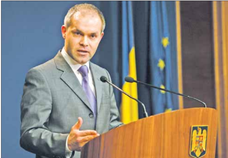
Ministrul Educației, Daniel Funeriu, caută aiurea țapi ispășitori, spune Mihail Hărdău, președintele Comisiei pentru învățământ din Senat

Motivând că „demisia se dă atunci când nu rezolvi probleme”, Funeriu a explicat că își dorește să continue reforma în Educație. „Nu îmi dau demisia. Împreună cu colegii mei avem o reformă de făcut și o vom duce până la capăt. Vă asigur acest lucru. Cu subiect și predicat. Restul sunt discuții. Îi respect pe toți deputații și senatorii, dar faptul