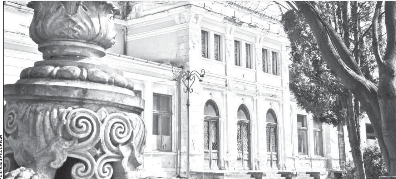
După finalizarea lucrărilor de modernizare, în clădirea Cazino se vor putea oficia căsătorii, dar și expoziții

„Luni (astăzi - n.r.) vom putea semna contractul cu ACI Cluj, firma desemnată câștigătoare la licitația pentru reabilitarea Parcului Central și a clădirii Cazino. Noi am adjucecat licitația la prețul cel mai mic. În timpul lucrărilor, parcul nu va fi închis total accesului publicului. Lucrările vor începe pe porțiuni”, a declarat primarul Sorin Apostu. Lucrările vor cuprinde aleile, iluminatul public, mobilierul