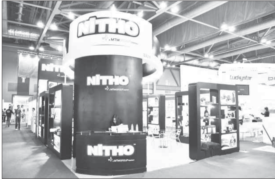
Targetul Nitho este populația tânără cu un nivel de trai în creștere, dispusă să investească în jocuri video

Decizia deschiderii unității din România a fost luată plecând de la premisa că Eu-