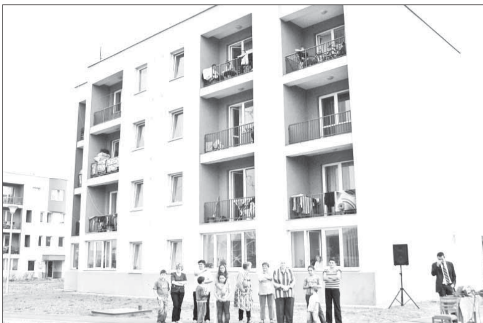
Chiriașii rău plătnici din cartierul oser sunt amenințați cu evacuarea dacă întârzie cu plata cheltuielilor de bloc mai mult de trei luni

Primarul a precizat că la ora actuală există în cartierul Oser șapte familii care refuză să-și achite cheltuielile. Potri-