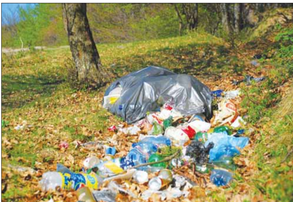
Două zone din Făget vor fi curățate vineri de gunoarie de voluntari, în cadrul evenimentului Săptămâna Națională a Voluntariatului

moment. Apoi, între orele 14-15, la Bastionul Croitorilor va avea loc un eveniment de promovare a Serviciului European de Voluntariat, ce va prezenta stagii de voluntariat în străinătate. Marti, între orele 15-16, pe traseul Piața Lucian Blaga -Piata Unirii – Piața Avram Iancu, va avea loc Parada Voluntarilor, al cărei scop este prezentarea valorilor voluntariatului-toleranța, solidaritatea și responsabilitatea. Miercuri, în cea de a treia zi a evenimentului, între orele 10-18, va avea loc o acțiune de voluntariat prin care se vor construi cuști pentru 90 de câini ai unui adăpost din Turda. Joi este ziua dedicată unui comportament responsabil față de mediu, prin reciclarea și reutilizarea materialelor. În acest scop va avea loc acțiunea Eco Cafe, ce se va desfășura în Parcul Central între orele 12-18, urmând ca de la ora 20, în Cafe Amsterdam, să aibă loc trei proiecții de filme pe tema voluntariatului