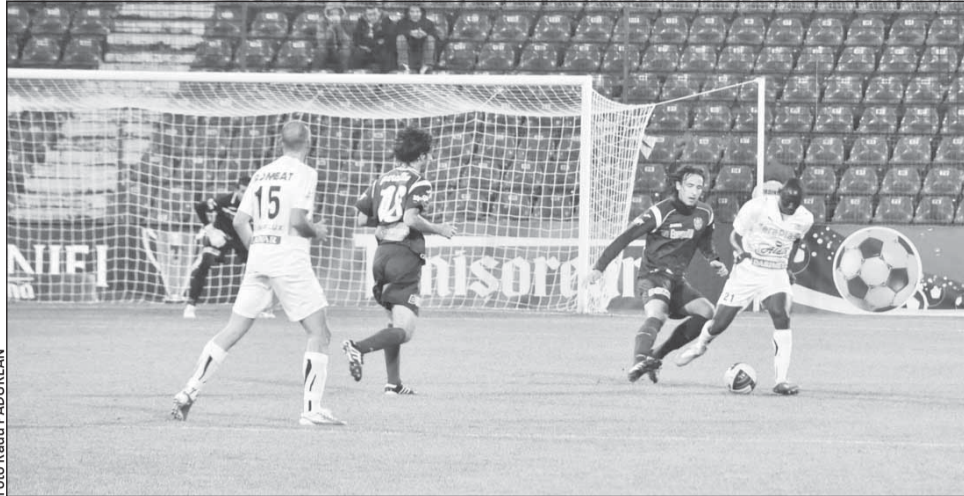
CFR va juca astăzi cu Gloria Bistrița în Gruia

„Am vrut să câștigăm, am început mai slab, dar apoi ne-am revenit. Știam că va fi greu cu Dinamo, o echipă bună, care are șanse să joace în Liga Europa. Mai sunt trei meciuri și sper să scoatem cât mai multe puncte. Din păcate a fost