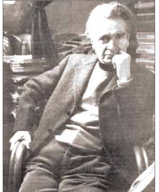
Manuscrisele lui Cioran ar putea ajunge în țară la persoane din mediul privat, deoarece instituțiile de profil nu au bugete pentru așa ceva

Mai multe manuscrise și documente personale ale filo-sofului român Emil Cioran au fost scoase ieri la vânzare, la Paris, de casa Binoche și Giquello. Printre cele 82 de lo-turi scoase la licitație se nu-mără caiete manuscrise – „Tra-gicul cotidian”, „Adolescenta”, „Jansenismul”, „Pamflet și pam-fletar”, „Considerațiuni asu-pra problemei cunoștinței la Kant”, „Banalitate și transfi-gurare”, „Cartea amăgiriilor”, „Lacrimi și sfinți”, „Schimba-rea la față a României” și nu-meroase cărți poștale și scri-