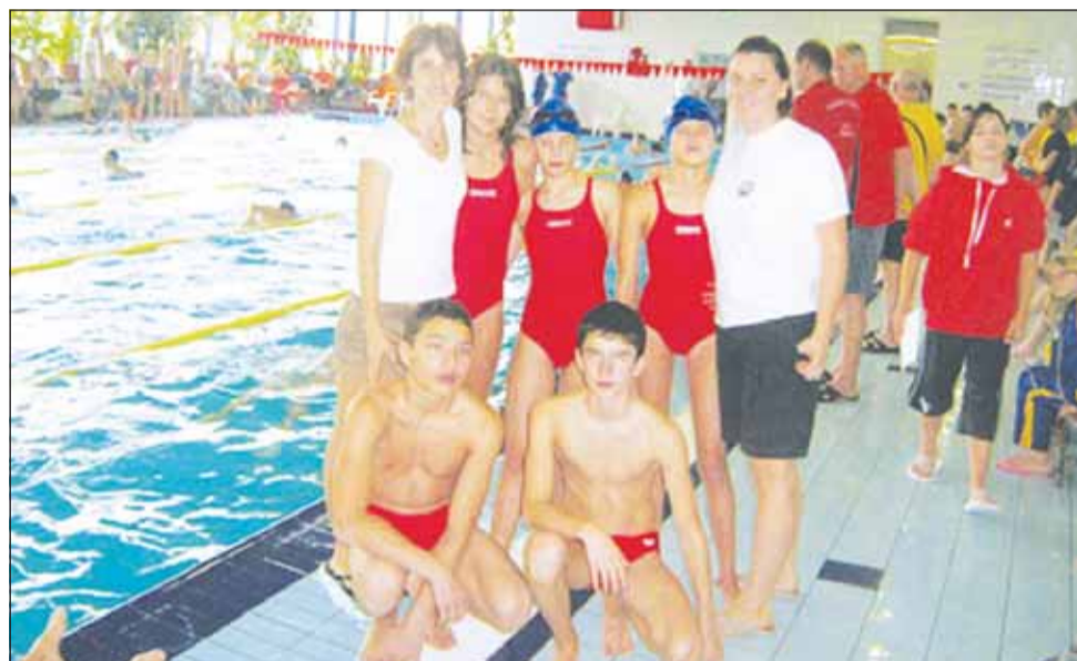
România e reprezentată la campionatele mondiale de înot pentru deficienți de vedere de o echipă din Cluj

Campionatele Mondiale de Înot IBSA (International Blind Sports Association) reprezintă cea mai importantă competiție a celor patru tineri de până acum. De altfel, aceasta este și prima participare a României la Campionatele Mondiale IBSA. La concursul care s-a desfășurat până as-