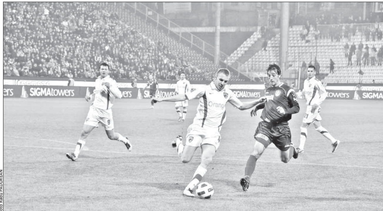
CFR a câștigat meciul tur cu 1-0.