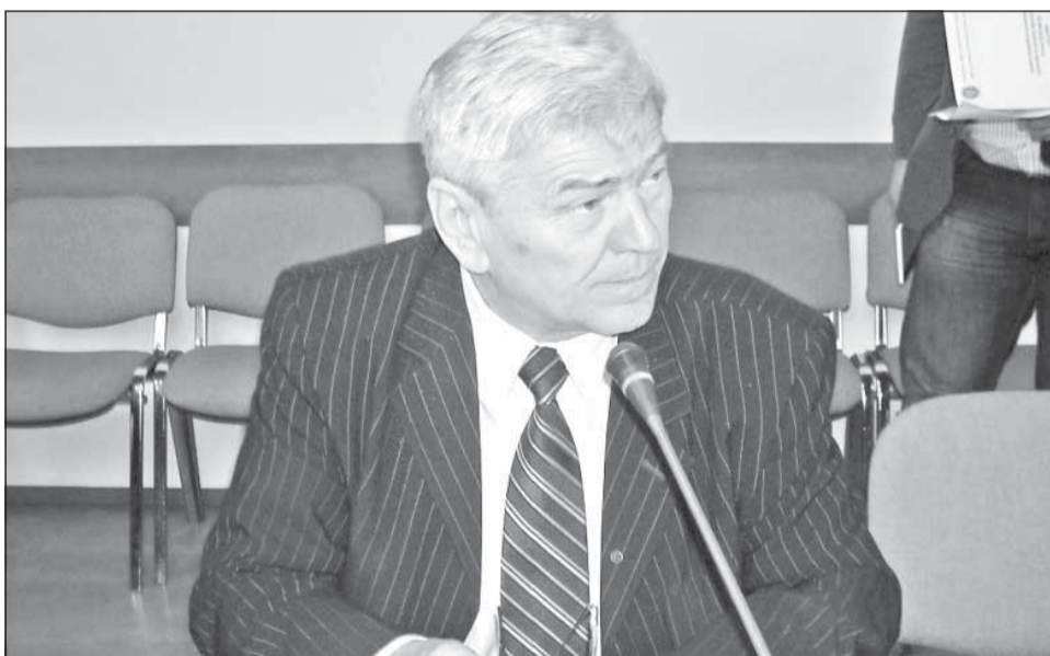
Ministrul Agriculturii, Valeriu Tabără, a vorbit despre colaborarea dintre ministerul de resort și universități

Participanții la conferință și-au exprimat punctul de ve-