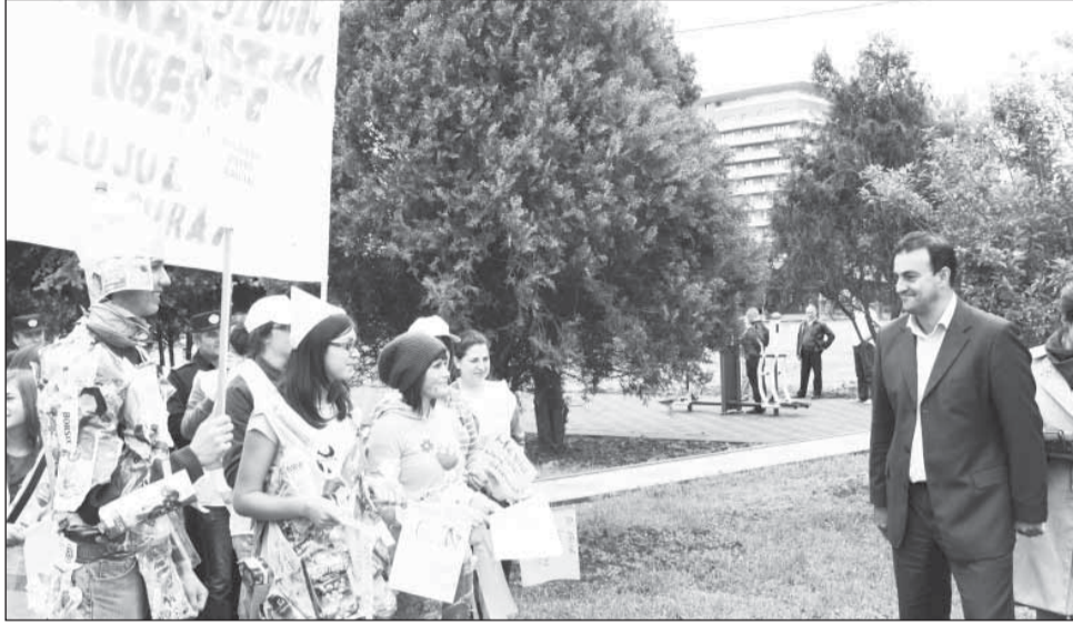
În cadrul competiției „Iubesc Clujul Curat” va avea loc și în acest an un concurs pe teme de voluntariat ecologic

Acțiunile ecologice de curățire a spațiilor verzi și a zonelor de agrement vor avea loc în perioada 05-15 mai, iar locații-