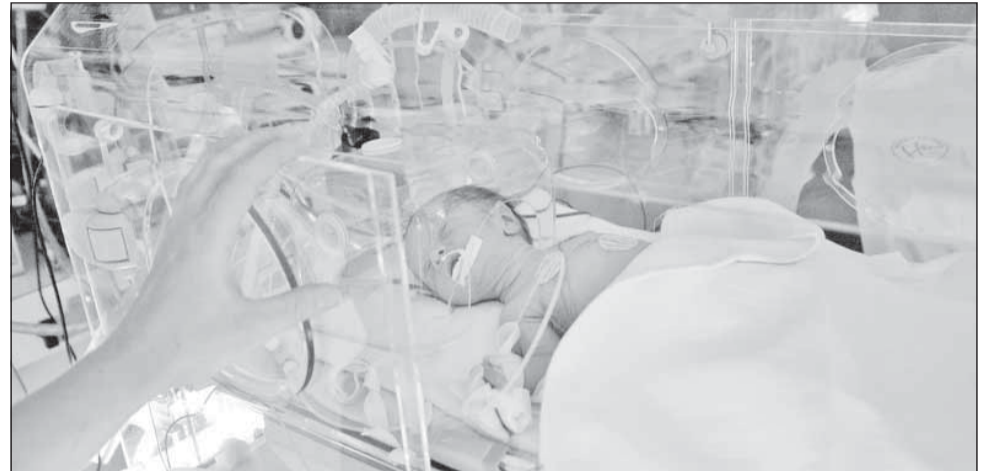
În Cluj, rata deceselor la copiii sub 1 an este la jumătate față de media națională

Conform statisticilor Direcției de Sănătate Publică Cluj, anul trecut au murit două femei din cauza complicațiilor la naștere, cifrele fiind aproximativ asemănătoare în ultimii 10 ani. La nivel mondial,