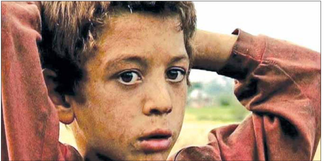
Filmul „Școala noastră” spune povestea a trei copii romi ce încearcă să treacă peste barierele impuse de diferența de etnie