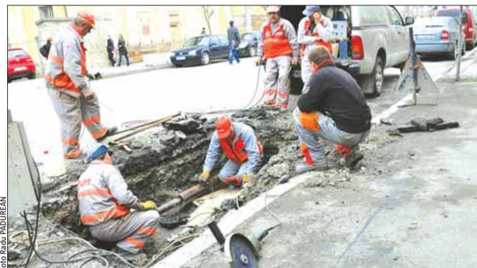
Pe strada Republicii, în anul 2010 s-au înregistrat 14 spargerii, iar în primele patru luni ale acestui an alte 19

Primăria încearcă să-i scoată pe clujeni din gropile E.On Gaz