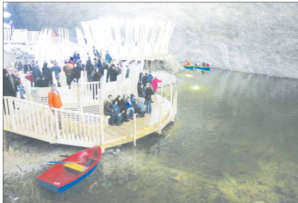
Zonele de agrement din interiorul Salinei Turda au fost luate cu asalt de 1 Mai și Paște

Lucrările de reabilitare a Salinei au început în urmă cu doi ani, au costat 6 milioane de euro și au fost finanțate în mare parte din fonduri europene. Mai exact 4,8 milioane de euro au fost banii europeni, iar restul – cofinanțare din partea Primăriei Turda și