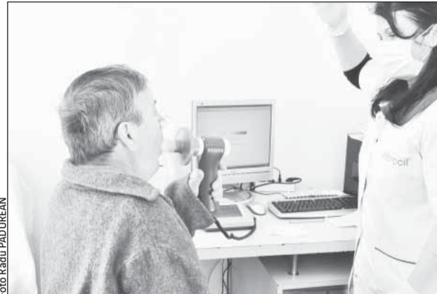
Spirometria este o metodă neinvazivă care ajută la diagnosticarea precoce a astmului bronșic și a altor afecțiuni pulmonare cronice

Studiile arată că, în Europa, o persoană moare din cauza astmului în fiecare oră. Deși pentru România nu există date precise, se estimează totuși că 1 milion de persoane sunt afectate de aceas-