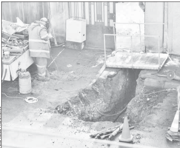
Pe strada Republicii, în anul 2010 s-au înregistrat 14 spargerii, iar în primele patru luni ale acestui an 19

ției existente în municipiul Cluj-Napoca. (...) În particular, vă rugăm să vă gândiți la înlocuirea completă a rețelei de pe strada Republicii, date fiind avariile repetate semnificate în această zonă. Unul dintre motivele pentru care acest mesaj este considerat de maximă urgență și gravitate de către noi este faptul că în această primăvară, în urma unui efort de gestionare a fondurilor publice locale în condițiile economice actuale, am demarat două noi mari programe de reabilitare și modernizare a drumurilor în Cluj-Napoca. Prin urmare, considerăm de datoria noastră să vă cerem sprijinul ca aceste investiții din bani publici să nu fie anulate de acțiuni ulterioare de intervenție în urgență ale echipelor E.On Energie România”, se arată în scrisoarea trimisă conducerii centrale a E.On AG.