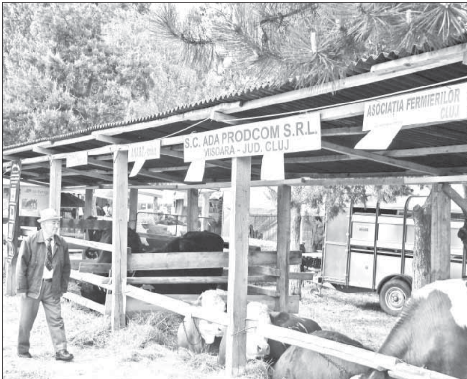
Peste 250 de participanți din zece țări vor fi prezenți la târgul „Agraria”

Prezentări de animale de rasă – precum renumitul Bivol românesc, ovinele Turcana, Tigaie, Suffolk, Hemshir,