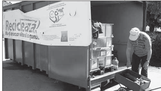
ECO-SAL a mai colectat deșeurile periculoase menajere și în luna mai

Din luna iunie a acestui an, Mediașul este singurul oraș din România care deține o stație de preluare și depozitare temporară a deșeurilor pericu-