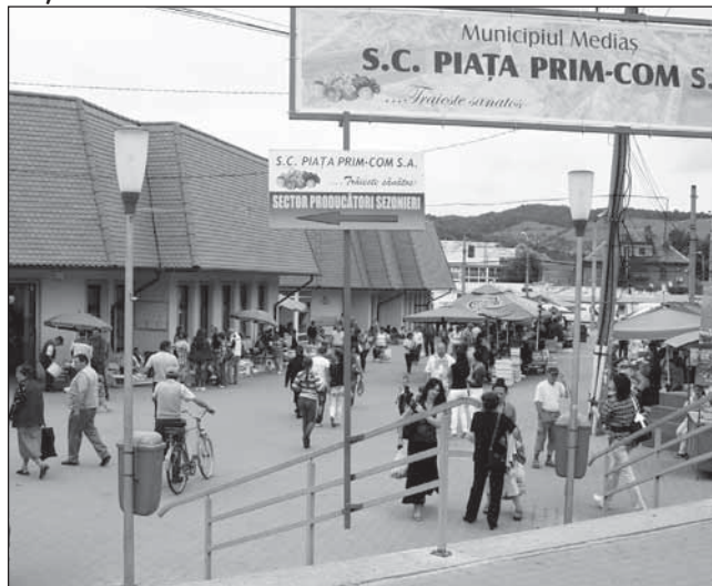
Pescăria din incinta pieței este o inițiativă unică în oraș

Piața agroalimentară a devenit neîncăpătoare pentru produsele de sezon. Este o realitate care a provocat, de curând, un scandal în toată regula în