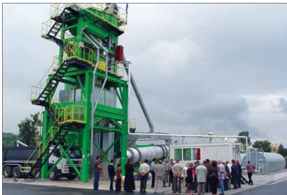
Stația de asfalt inaugurată marți a primit avizul de mediu pe 20 iulie

Cu un debit de producție de 80 de tone pe oră, stația de la Șeica este suficientă pentru toate lucrările pe care le are administratorul drumurilor județene. Așa că este și singura care va funcționa permanent.