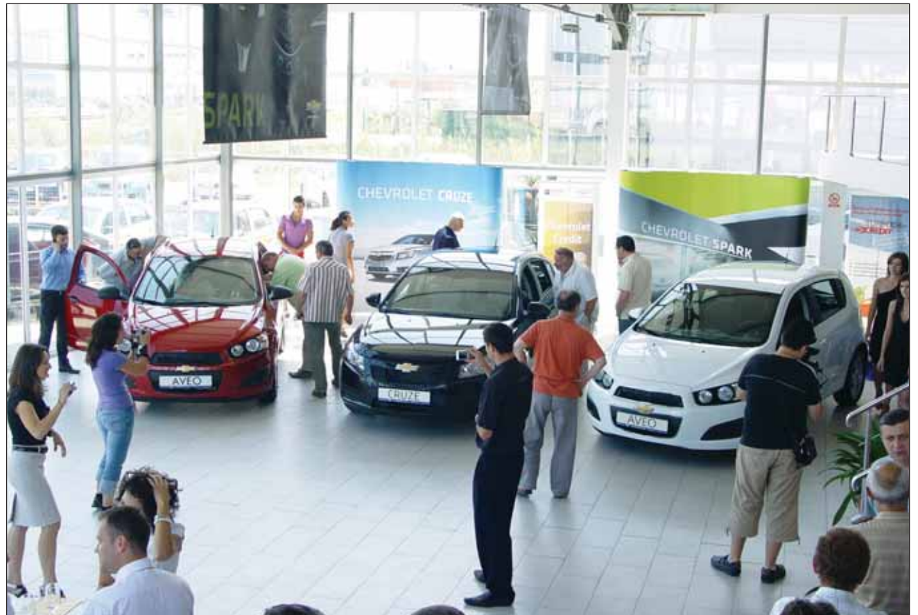
La centenar, Chevrolet își înnoiește toată gama auto

Cea mai recentă versiune a modelului Aveo reprezintă un autovehicul complet nou, cu un exterior și un habitacul re-proiectate în întregime, un șasiu și o structură a caroseriei dezvoltate recent, precum și o gamă actualizată de motoare cu consum redus de carburant și emisii scăzute de dioxid de carbon. Exteriorul sport caracterizează mai ales varianta Hatchback, cu linii fluide și agresive. Pe de altă parte, versiunea cu patru uși oferă o imagine mai matură și mai elegantă, adresându-se familiilor tinere. Prima transmisie automată cu 6 trepte de viteză folosită de Chevrolet într-un autovehicul de mici dimensiuni va fi disponibilă opțional pentru Aveo 1.4 și 1.6.