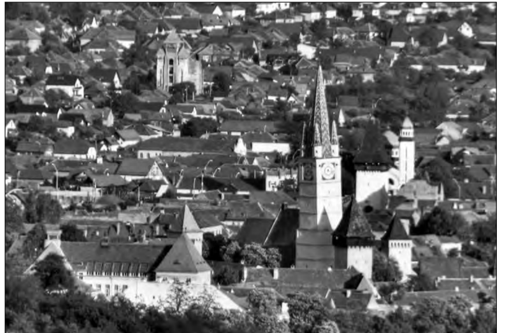
Rangul municipiului Mediaș nu va fi afectat de scăderea populației

mică în cazul municipalității. „Este posibil ca numărul consilierilor locali să scadă începând de la următoarele alegeri, în urma rezultatelor de la recensământ. De asemenea, este posibil să se ia o decizie și în privința funcționarilor, a angajaților din aparatul administrativ, adică până la un anumit număr de locuitori să ai un anumit număr de angajați. La noi nu vor fi probleme, în-