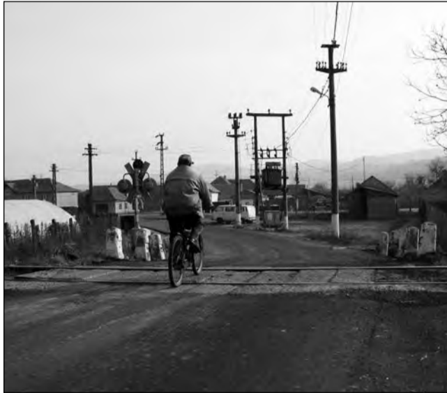
Pe strada proaspăt asfaltată locuiesc 30 de familii

Așa cum au promis în luna august a acestui an, edilii din Șeica Mare au reușit să dea în folosință o arteră asfaltată, de care se bucură 30 de familii. Strada care face legătura între stația de asfalt a societății Drumuri și Poduri S.A. și șoseaua principală - DN14 Sibiu-Sighișoara a fost modernizată gratuit, imediat ce s-au încheiat lucrările de bransamente la utilități pe cele câteva sute de metri. „Vorbim despre o premieră. Consiliul Județean, prin societatea subordonată de Drumuri și Poduri, și Consiliul Local Șeica Mare au convenit pentru această investiție, pe care gospodarii de aici o așteaptă de 50 de ani. De aproximativ două săptămâni, ei au scăpat de praf și nu mai au parte nici de atâta zgomot sau