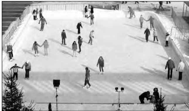
Mediașul va avea „ținută festivă” până pe 5 decembrie

Patinoarul artificial va fi amenajat pentru al treilea an consecutiv la Mediaș. În paralel, a început împodobirea orașului pentru sărbători.