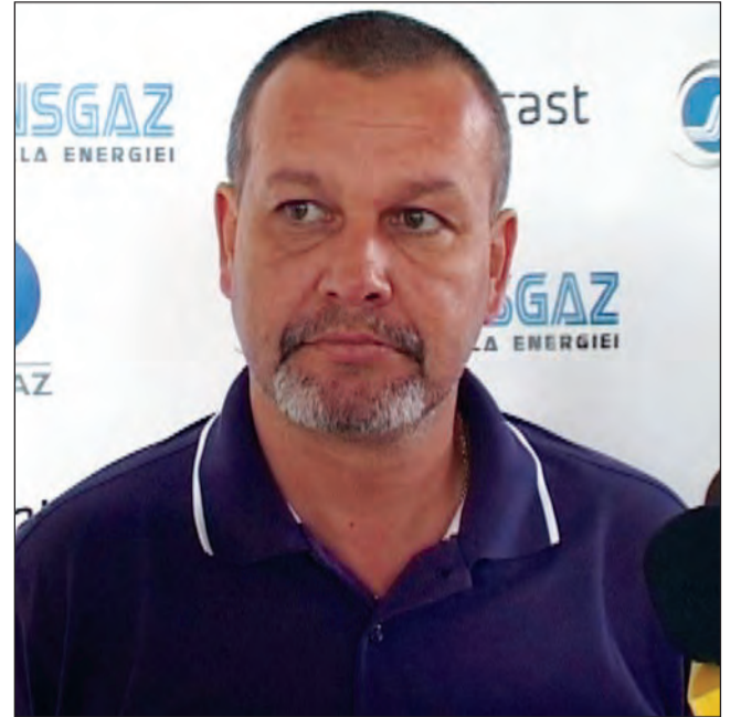
Măine, Teleabă își dorește ca elevii săi să demonstreze că sunt o forță

Este foarte important acest meci. Îmi doresc ca băieții să presteze cel mai bun joc, un joc de calitate, pe care l-am demonstrat în primele opt etape de campionat. Vom întâlni o echipă de top, cu jucători