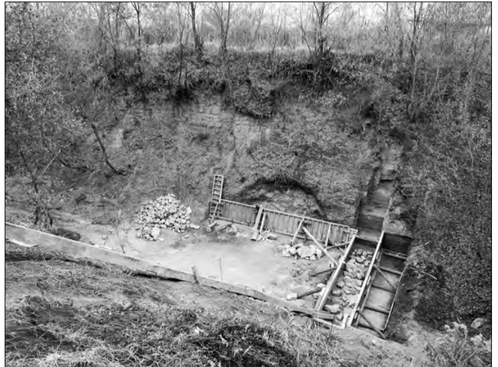
Lucrările de amenajare sunt în plină desfășurare, după care dosarul va fi trimis Guvernului

nurilor pentru construcție de locuințe, în zona târgului municipalitatea dorește în viitor construirea unui cartier rezidențial. Anul trecut a fost făcută chiar o cerere către Ministerul Dezvoltării, pentru asigurarea