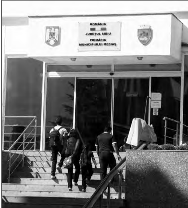
Mulți medieșeni se declară nemulțumiți de infrastructura orașului

Zeci de mesaje ajung și pe pagina de internet www.primariamedias.ro, unde o angajată le citește și transmite un răspuns telefonic sau prin e-mail, ori le redirecționează către biroul de specialitate, în cazul unor solicitări complexe. Soluția pare a fi pe placul medie-