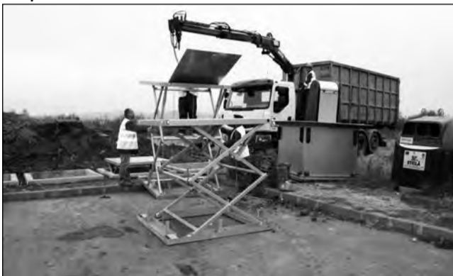
Deșeurile „îngropate” nu mai ajung prada câinilor vagabonzi

Săptămâna viitoare, vor fi amenajate alte două puncte de colectare subterană și pe stra-