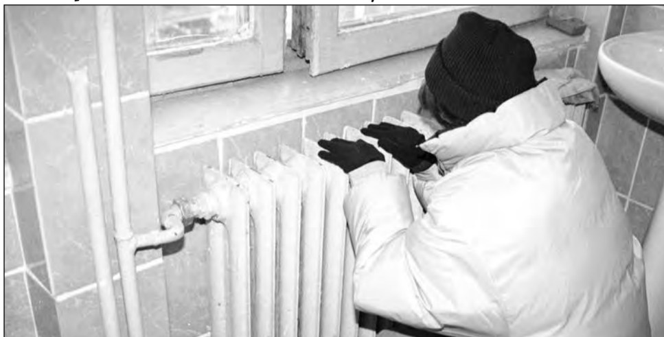
Plafonul venitului minim eligibil nu s-a schimbat din ianuarie 2008

Plafoanele de venit la ajutoarele pentru încălzire nu s-au modificat față de anul trecut. Astfel, din 1 ianuarie 2008, plafonul a crescut ca urmare a unei hotărâri a Guvernului României, de la suma de 500 lei la 615 lei. Valoarea maximă a venitului până la care se acordă ajutoare pentru încălzire este stabilită anual de guvern. „De aceste subvenții pot beneficia persoanele care folosesc încălzirea cu gaze naturale cu venituri cuprinse între 155 și 615 lei pe membru de familie, valoarea plafonului fiind cuprinsă între 19-262 lei. Pentru beneficiarii de ajutoare de încălzire cu lemne, cererile, informațiile și primirea actelor se realizează doar la sediul Direcției de Asisten-