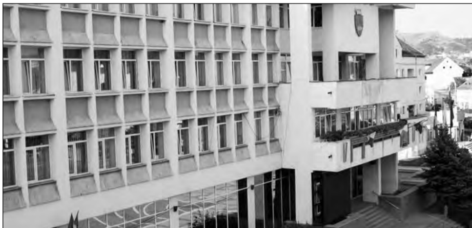
Reprezentanții BERD s-au aflat, ieri, la sediul Primăriei

În cursul zilei de ieri, o delegație din partea băncii s-a aflat în municipiul de pe Târnavă Mare. Reprezentanții BERD s-au întâlnit cu edilul-șef al Mediașului pentru a semna contractul de împrumut. Creditul pe care municipiul și l-a asumat este unul în valoare de șapte milioane de euro, echivalentul a circa 33 milioane de lei. Împrumutul este contractat pe o perioadă de 11 ani, cu o perioadă de grație de un an de