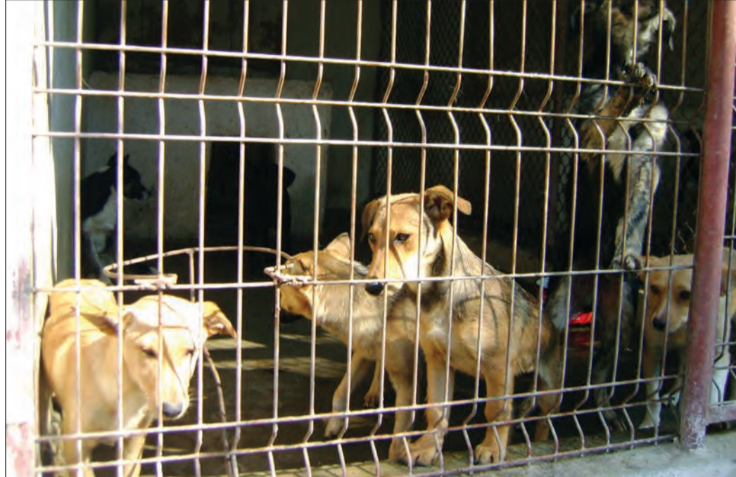
Mici și mari, buni și răi, „comunitarii” din adăpostul Mediașului se promovează acum și pe Facebook, în speranța că vreun

Rețeaua de socializare Facebook s-a dovedit a fi o bună modalitate de promovare a adăpostului de la Mediaș. Cu popularitatea mondială de care se bucură, e imposibil să nu atragă și membri din rândul iubitorilor de animale. De altfel, deși este online de puțină vreme, adăpostul medieșean a reușit deja să-i găsească stăpâni unui maidanez prin intermediul rețelei Facebook. Câțelii de la adăpost sunt promovați prin intermediul site-ului www.adoptiicaini.ro și potențialii „părinți” adoptivi pot să vadă în poze, atât pe site, cât