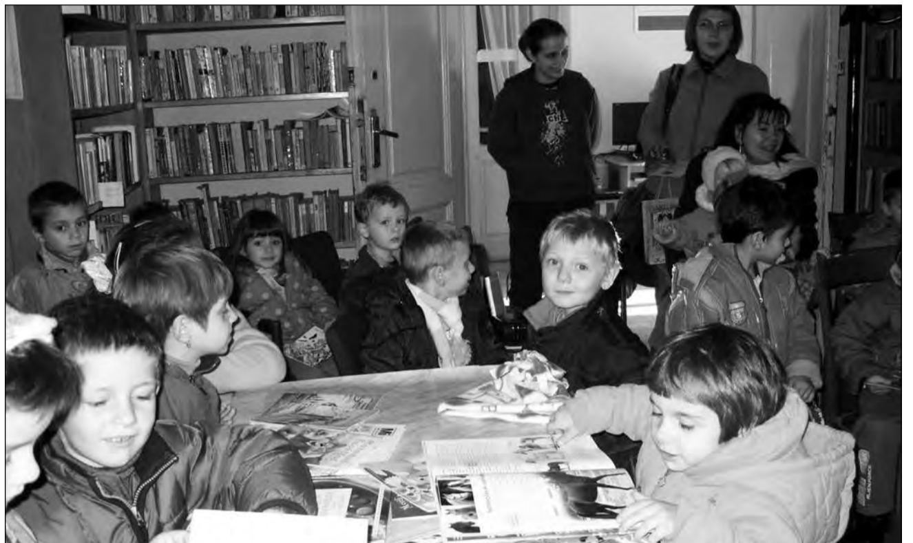
Cele mai multe evenimente din programul „Noptii bibliotecilor” le sunt dedicate copiilor

Campania „Biblioteca se implică în sănătatea adolescenților” va fi deschisă la miezul nopții. Adolescențele din Mediaș vor participa la prezentarea Proiectului „Învăț să previn cancerul de sân”, derulat