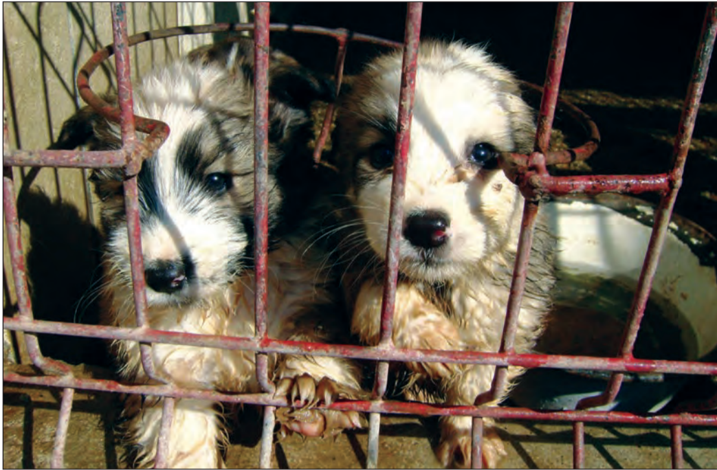
Un iubitor de animale va vrea să-i ia acasă

Prăștiat în toate zonele Mediașului, fără deosebire. Surprinzător, cei care se ocupă să-i adune de pe străzi nu-i lăsară Eleșteu, patrupelele „comunitare” găsesc casă, masă și îngrijire medicală. Totul, în speranța că se vor