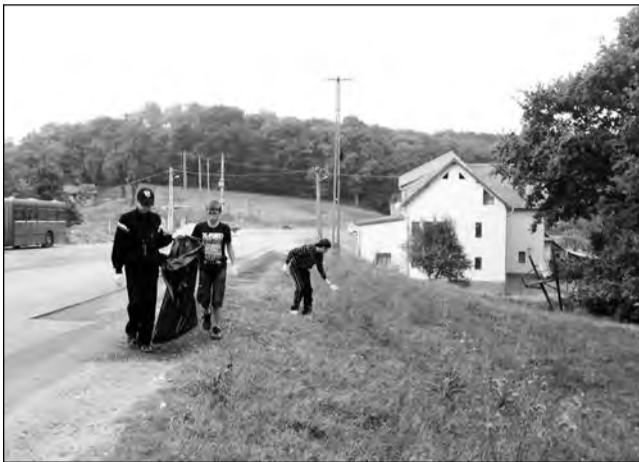
Apelul organizatorilor a „prins” mai ales în rândul tinerilor

Cu toate că, la început, organizatorii și-au propus să strângă un număr de voluntari egal cu cel de la prima ediție, până la finalul zilei așteptările lor au fost depășite. Sâmbăta trecută, 782 persoane au pus umărul la igienizarea zonelor cu probleme din municipiul Mediaș și localitățile aron-