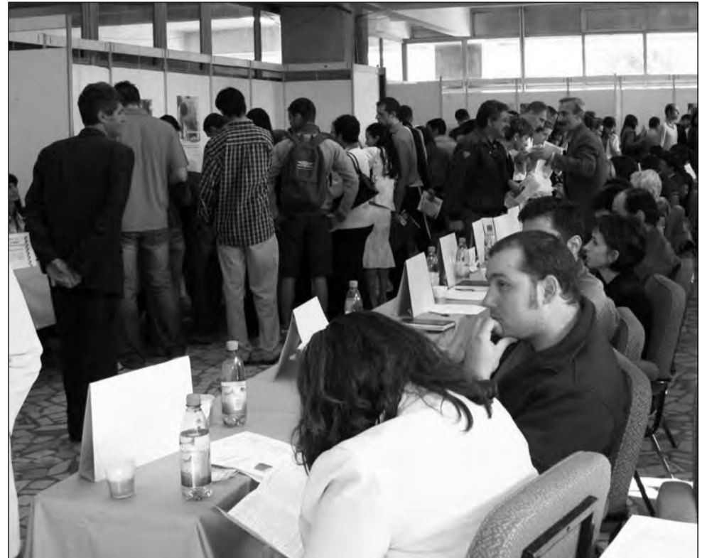
Bursa pentru absolvenți pune la bătaie peste 200 de locuri vacante

În total, sunt 112 specializări care nu depind de bacalaureat, conform unei liste realizate de Ministerul Educației, Cercetării, Tineretului și Sportului. Cu atestatul primit în urma studiilor postliceale se poate profesa, printre altele, ca: asistent medical, asistent farmacie, funcționar bancar, agent vamal, programator, cosmetician, asistent gestiune, bibliotecar, broker, agent fiscal, secretar, pedagog școlar și chiar top-model.