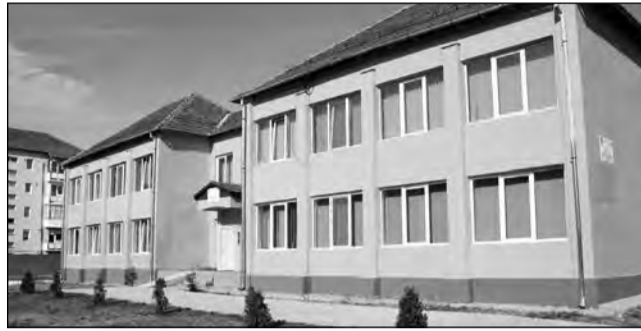
Creșa extinsă din Gura-Câmpului are 60 de locuri

Municipiul Mediaș va dispune, anul viitor, de încă o creșă. Aceasta va fi amenajată pe strada Vidraru, în cartierul Vitrometan, și va putea găzdui 50 de micuți. Proiectul finanțat de Ministerul Dezvoltării Regionale și Turismului se află actualmente în faza licitației. „Într-o lună se va decide câști-