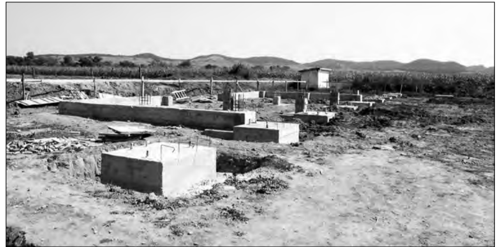
Sala de sport este una dintre cele mai valoroase investiții derulate la Dârlos în ultimii ani

Pentru Dârlos, sala de sport reprezintă o investiție foarte necesară. Aceasta va avea o capacitate de 153 locuri și va fi construită în apropierea școlii generale din localitate, astfel încât accesul elevilor să fie unul facil. „Este o investiție foarte bună, pentru că tineretul trebuie să se apropie și de