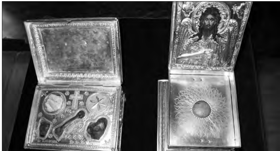
Raclele vor sta două zile la catedrala din Mediaș