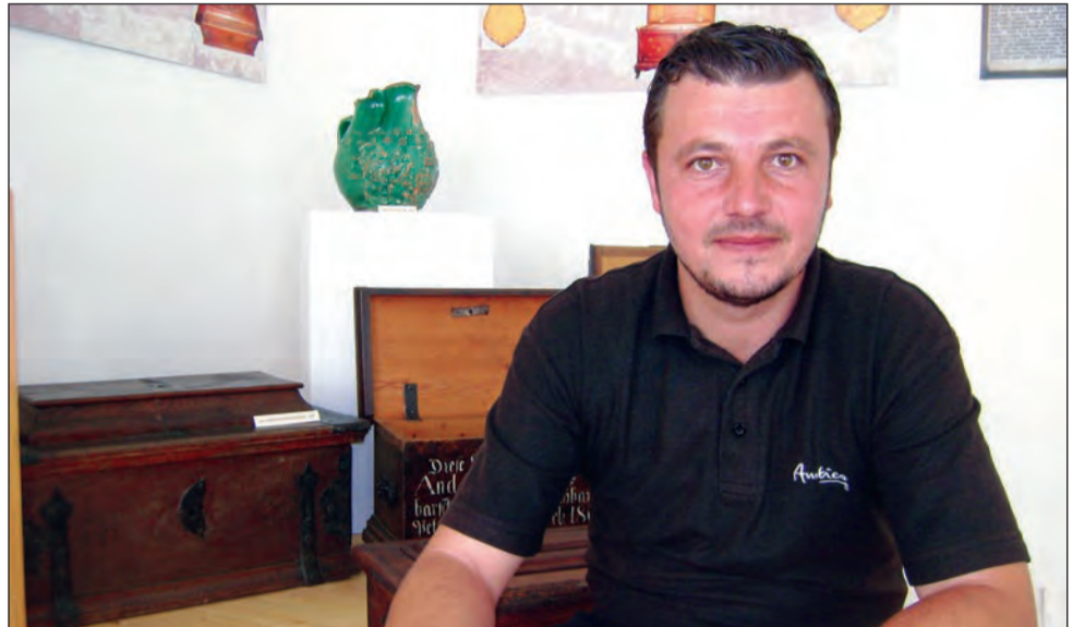
Selecția pentru cor l-a ajutat pe Moldovan să remarce mulți tineri talentați în Mediaș

Pot spune că am făcut treabă bună. Întotdeauna este loc