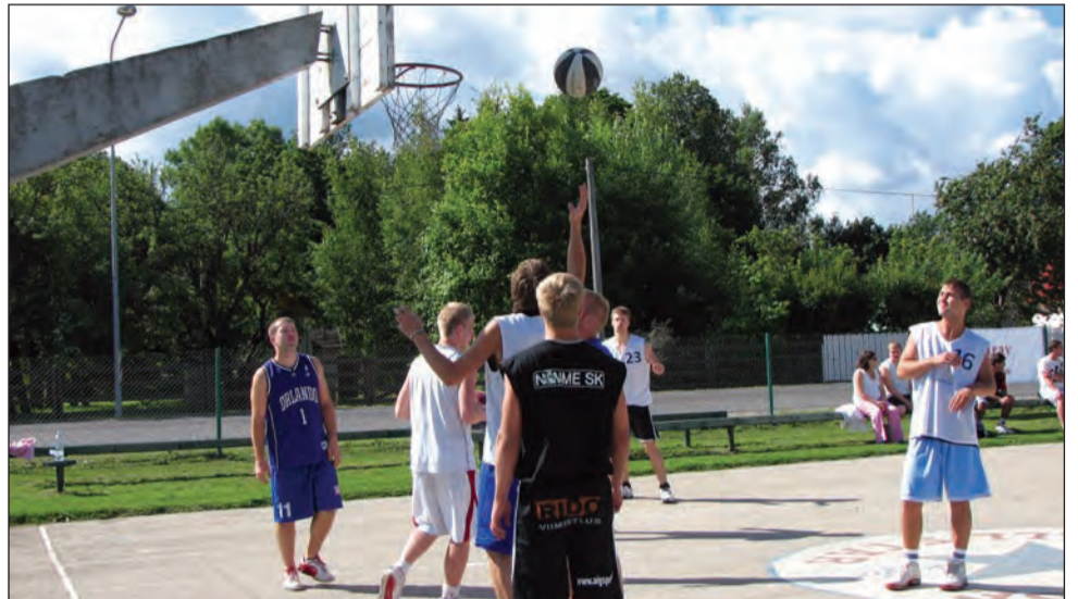
Înscrierile sunt așteptate online, la streetball-medias.ro/inscrieri.html

Mediaș și nu numai, fie ei jucători profesioniști sau amatori. Ea va fi structurată pe mai multe categorii de vârstă: sub 14 ani, sub 18 ani, Open (toate categoriile de vârstă), respectiv Old Boys (jucători cu vârsta peste 35 de ani). Totodată, vor avea loc concursuri de Slam Dunk, aruncări libere și aruncări de trei puncte.