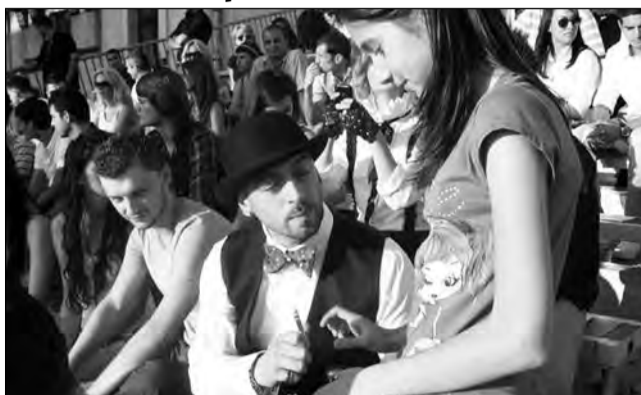
Fanii din Mediaș așteaptă întâlnirea cu CRBL

„Scopul acestui proiect este de a scoate tinerii din rutina zilnică, de a le oferi un mediu propice de socializare și de a promova noi talente din rândul acestora.”