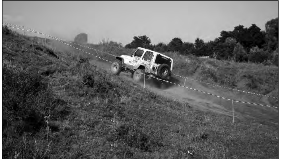
Asociația Free Spirits a invitat pasionați de off-road din toate colțurile țării