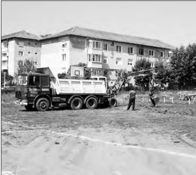
Lucrările la noua sală de sport durează zece luni

Mediașul va avea o nouă creșă în cartierul Vitrometan. Finanțarea este asigurată tot de Ministerul Dezvoltării, prin Programul Național de Dezvoltare a Infrastructurii. Noua creșă va fi construită pe strada Vidraru și va avea două grupe, respectiv o capacitate de 50 de copii. „Această investiție