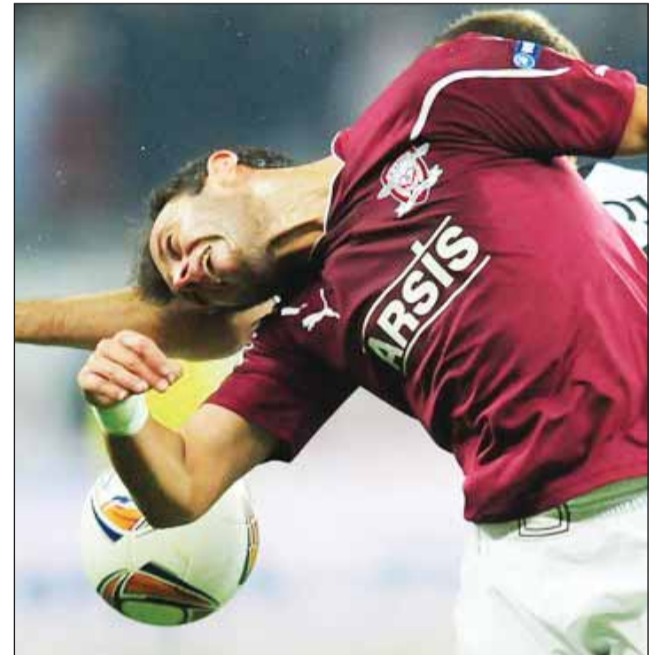
Rapidiștii vor să strângă puncte pentru a-și îmbogăți coeficientul

De departe cel mai interesant meci al serii de miercuri din Europa League este cel dintre Celtic Glasgow și Atletico Madrid. „Verzii” din Scoția au intrat de ceva timp în umbra rivalilor de la Rangers și vor încerca să iasă în evidență prin prestația din cupele europene. Ibericii au câștigat trofeul în 2010 și ar dori să intre din nou în posesia lui,