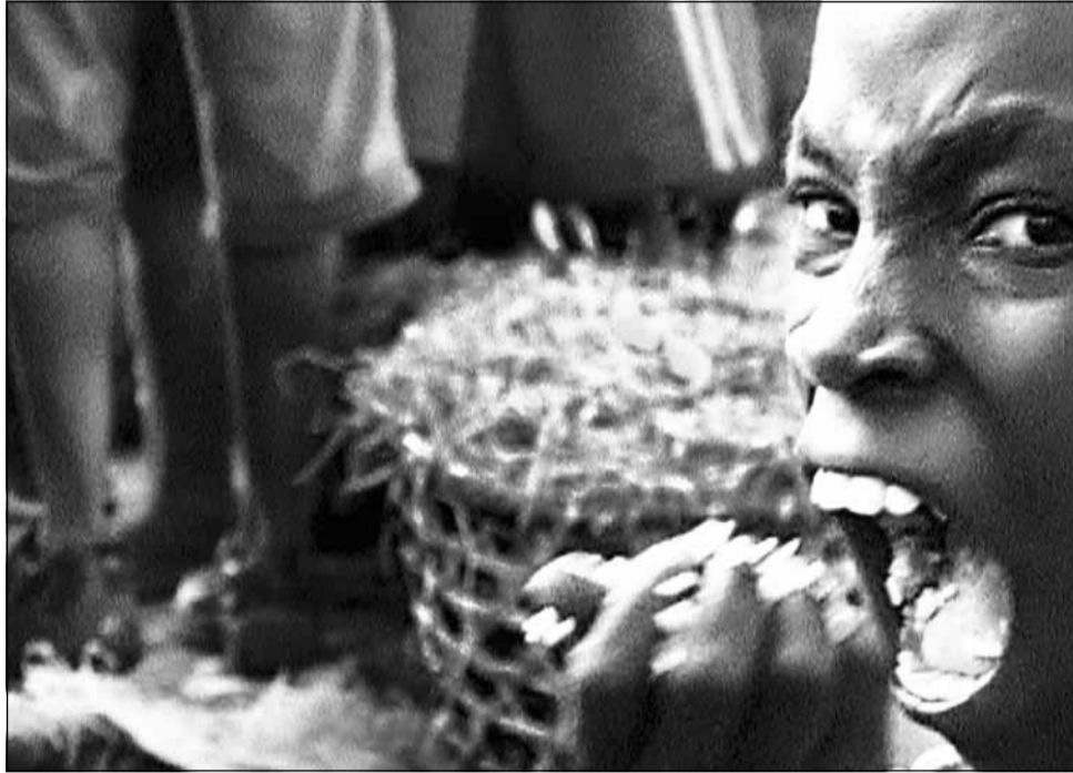
Filmul „Darwin's Nightmare” vorbește despre efectele globalizării mai puțin cunoscute europenilor

Următorul film, cel de marți, 4 octombrie, ora 19,